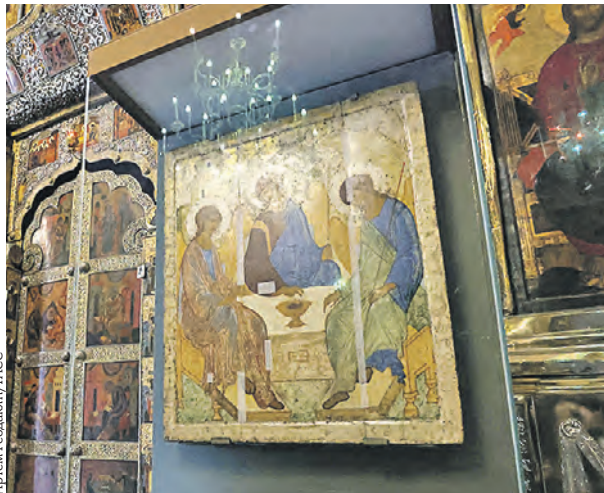
18 июля 2022 года. «Троицу» Рублева в лавру доставили из Третьяковки в честь праздника

■ Вчера специалисты Государственной Третьяковской галереи заявили, что из-за нестабильного состояния иконы «Троица» Андрея Рублева ее не будут передавать в храм Христа Спасителя на праздник Святой Троицы 4 июня.