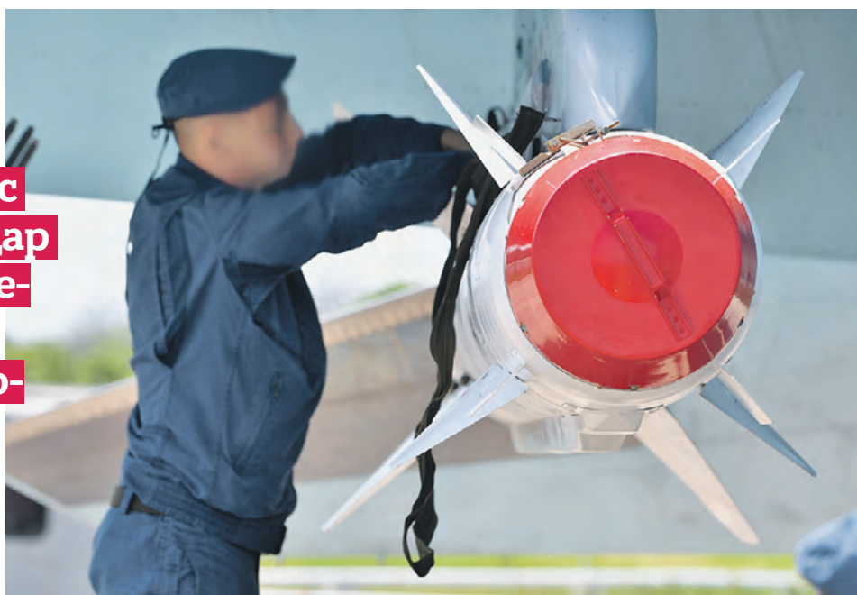
19 июня 2022 года. Техник вешает авиационную ракету класса «воздух-поверхность» Х-29 на узел подвески вооружения истребителя-бомбардировщика ВКС России Су-34

ефрейтора колонна прибыла в нужный район своевременно и без потерь.