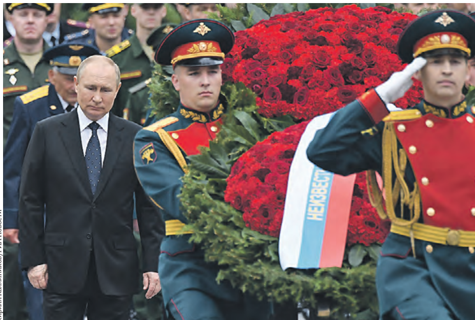
22 июня 2022 года. Президент РФ Владимир Путин на церемонии в честь Дня памяти и скорби, которая прошла в Александровском саду

Владимир Путин возложил цветы к Могиле Неизвестного Солдата