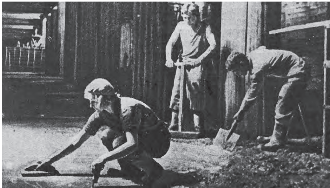
Издание «История метро Москвы». Рассказы строителей метро.

Тем временем на участках бригад Морченко и Юркова