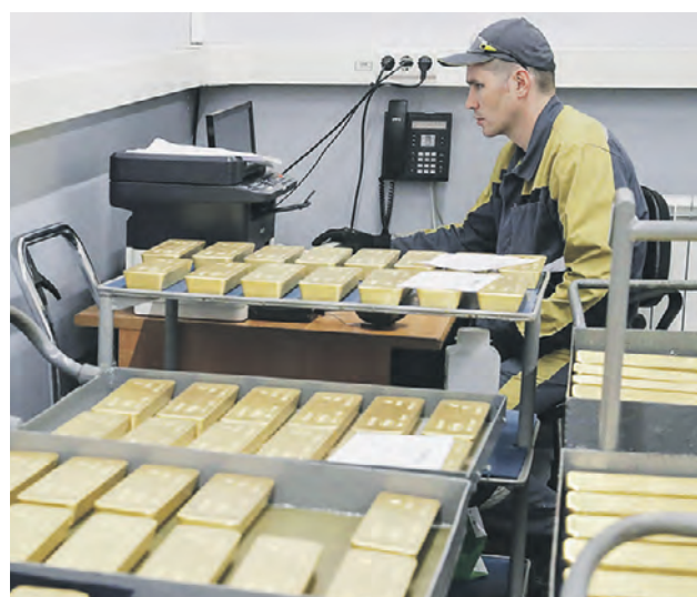
Маркированные слитки золота на участке отгрузки готовой продукции ОАО «Красцветмет»