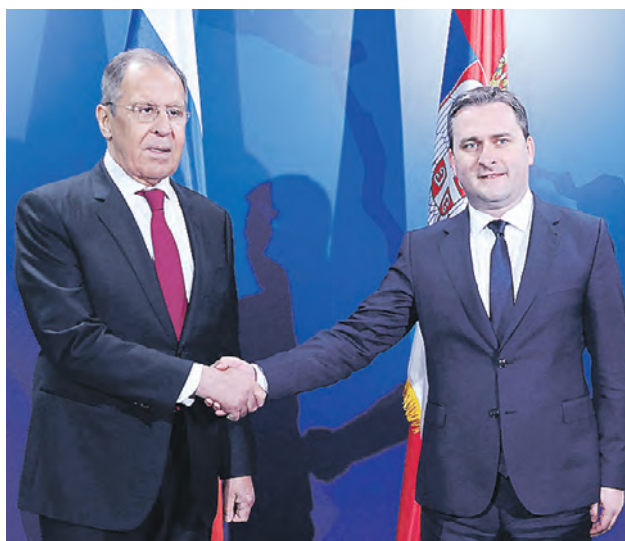
Сергей Лавров (слева) и министр иностранных дел Сербии Никола Селакович на встрече в Белграде