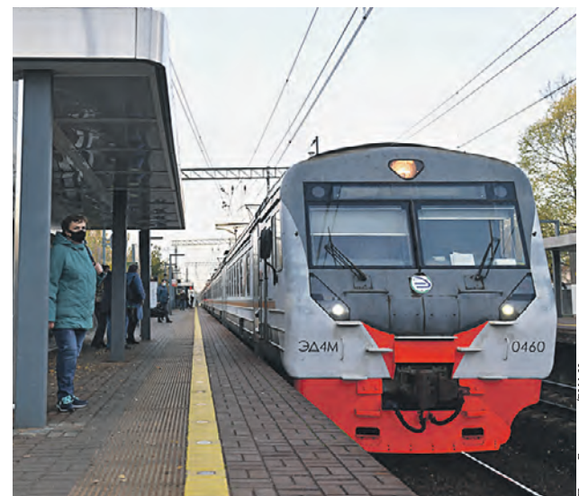
Электропоезд прибывает на станцию первого Московского центрального диаметра «Дегунино»