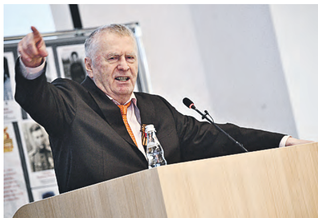
Владимир Жириновский перед своей смертью сделал много прогнозов, которые многие считали бредом

— Подождите 19 сентября. Все затихнет, все заглохнет до марта 2024 года, когда будут снова обострения. Когда будут выборы президента, — заявил Жириновский незадолго до смерти. Понедельник, однако, прошел без как-либо ярких по-