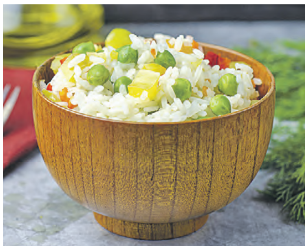
Рис длиннозерный 1 ст., перец болгарский 2 шт., горошек зеленый 100 г, лук и морковь по 1 шт., куриное филе 400 г, специи

Рис предварительно на 50 минут замочите в чуть теплой воде. Затем отварите. На отдельной сковороде потушите до мягкости лук и морковь, добавьте к ним кусочки курицы и обжарьте до готовности. В самом конце добавьте немного сливочного масла и пару зубчиков чеснока. Зеленый горошек и болгарский перчик также потушите на сливочном масле. Добавьте каглю соевого соуса и смешайте с отваренным рисом. Затем на дно глубокой посуды уложите немного куриного филе, поверх — смесь риса и овощей и сразу же подавайте.