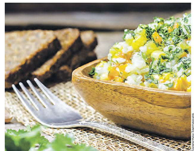
Рис 2/3 ст., кукуруза консервированная 100 г, чеснок свежий 1 зуб., болгарский перчик 1 шт., морковь 1 шт., зелень 50 г, соль

Хотя и считается, что употребление круп может привести к набору веса, к рису это утверждение не относится от слова «совсем». Напротив, его даже рекомендуют тем, кто сидит на диете. Так что этот салат, вариаций которого на самом деле масса, вам подойдет. Сложного в приготовлении ничего нет. Главное — правильно отварить рис, чтоб он получился рассыпчатым. Остальные ингредиенты мелко нашинкуйте и смешайте с крупой. Заправлять этот салат лучше всего небольшим количеством оливкового масла.