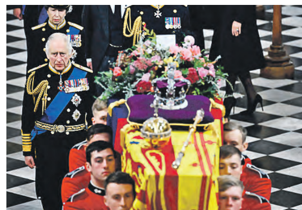
19 сентября 2022 года. Король Карл III (слева) в траурной процессии идет за гробом королевы

Государыню, которая провела на троне более 70 лет, по традиции проводили в последний путь в Вестминстерском дворце. 14 сентября епископ Кентерберийский провел поминальную службу, в которой приняли участие все члены монаршей семьи. Облаченные в глубокий траур потомки королевы стояли у гроба в скорбном молчании. К сыновьям Карла Третьего Уильяму и Гарри присоединились дети сестры Карла, принцессы Анны, Зара Тиндалл и Питер Филипс, а также дочери Эндрю — Беатрис и Евгения. Были и наслед-