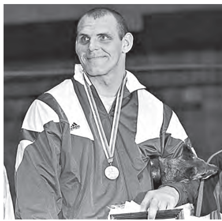
18 октября 1995 года. Александр Карелин на пьедестале почета

У меня есть тетрадь, где я записываю понравившиеся изречения. Мне очень близка мысль академика Николая Вавилова: «Единственный шанс как можно больше сделать — как можно больше на себя взвалить». Если хочешь что-то сделать — сделай сам. Можно долго рассказывать, а можно прийти и показать на личном примере. И еще завет полководца Александра Суворова: «Дисциплина — мать победы».