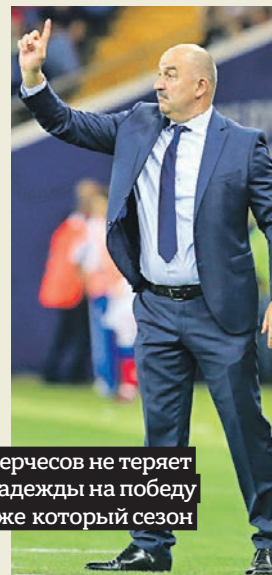
Черчесов не теряет надежды на победу уже который сезон

Вчера главный тренер сборной России по футболу Станислав Черчесов сообщил, что намерен сделать боеспособную команду к чемпионату мира — 2022. И это притом что сборная пару дней назад вылетела с оглушительным треском из Евро-2020. Теперь стоит главный вопрос: может, в сборную пора пригласить нового тренера? с. 7