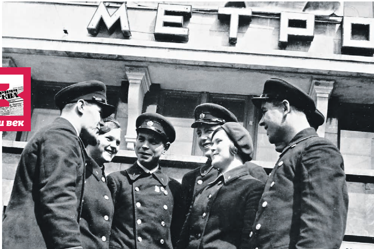
1935 год. Работники столичного метрополитена возле входа на станцию «Охотный Ряд»

Тем не менее городские власти старались сделать новый грандиозный транс-