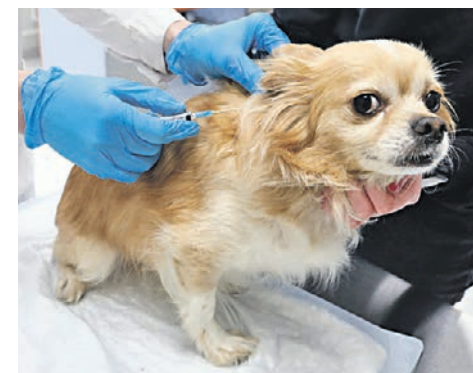
Агентство городских новостей «Москва»

Вчера Россельхознадзор представил метод выявления антител у животных.