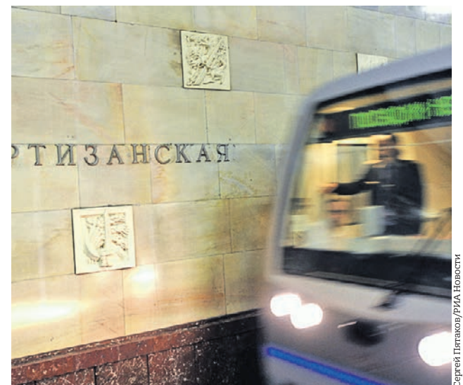
Местом происшествия стала станция столичного метрополитена «Партизанская»