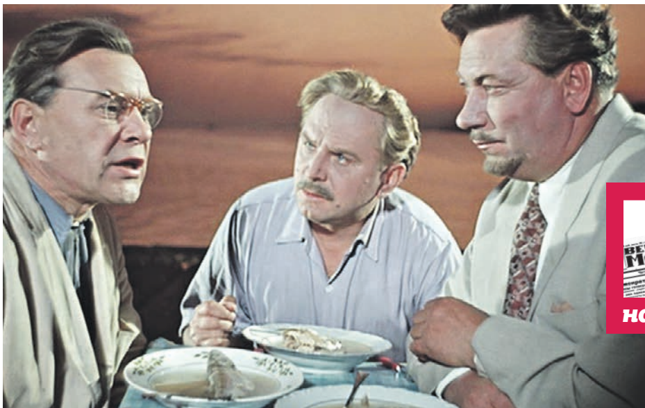
Кадр из фильма «Верные друзья» (слева направо): Борис Чирков, Александр Борисов, Василий Меркурьев

■ «Верные друзья» — единственная комедия в творчестве Михаила Калатозова. Именно она получилась фильмом на все времена.