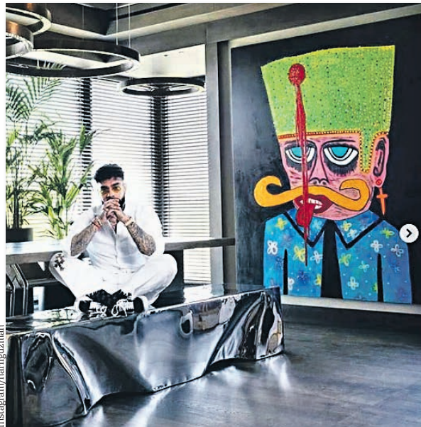
Подписчиков Тимати удивило обилие арт-объектов и различных скульптур на территории его огромной двухэтажной квартиры

Вчера рэпер Тимати показал свою элитную двухэтажную квартиру в столице площадью 650 квадратных метров. Поклонники артиста были шокированы роскошным интерьером.