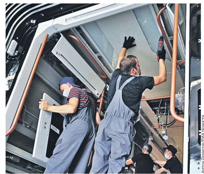
20 августа 2021 года. Сотрудники «Метровагонмаша» строят вагон метро для Ташкентского метрополитена