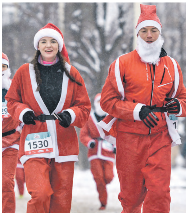
23 декабря 2018 года. В благотворительном забеге Дедов Морозов на ВДНХ участвовали и девушки