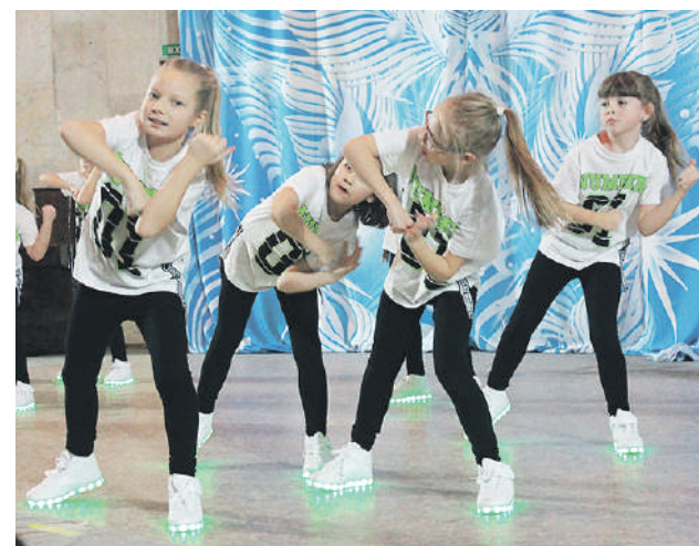
16 декабря 2018 года. Юные участники фитнес-фестиваля «Елка в кроссовках»

В программе были соревнования по аэробике, танцевальному фитнесу, фитнес-болу, чирлидингу и другим направлениям.