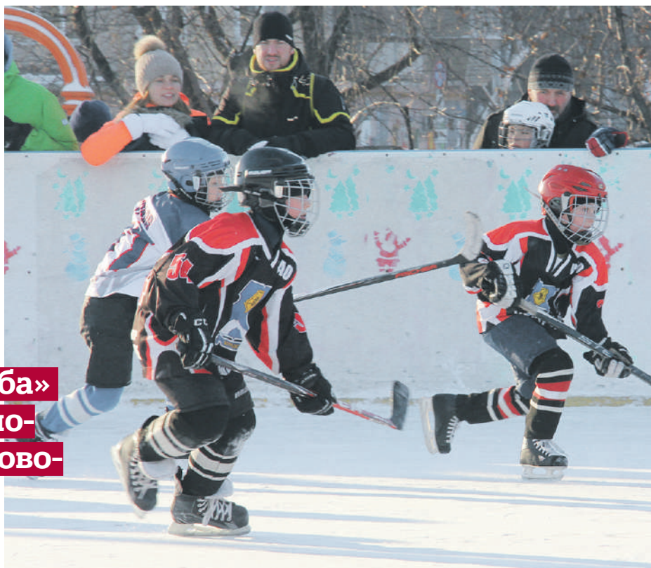
16 декабря 2018 года. Участники турнира «Золотая шайба», члены команды «Планета-Богородское» (в красной форме)