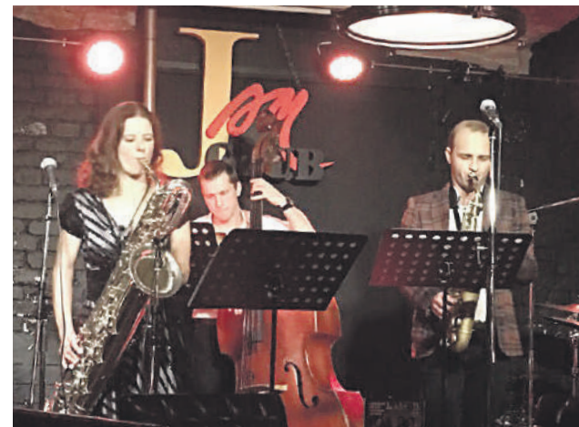
Группа «Соло Ц» во время одного из выступлений