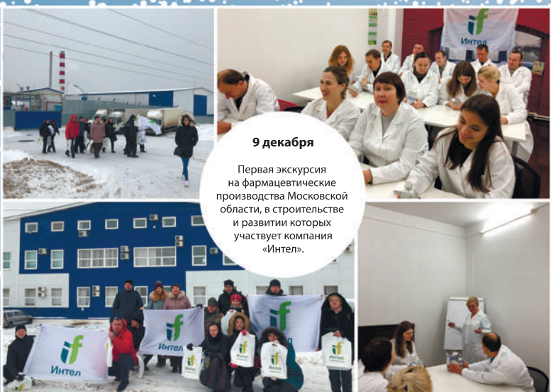
9 декабря Первая экскурсия на фармацевтическое производство Московской области, в строительстве и развитии которых участвует компания «Интел».