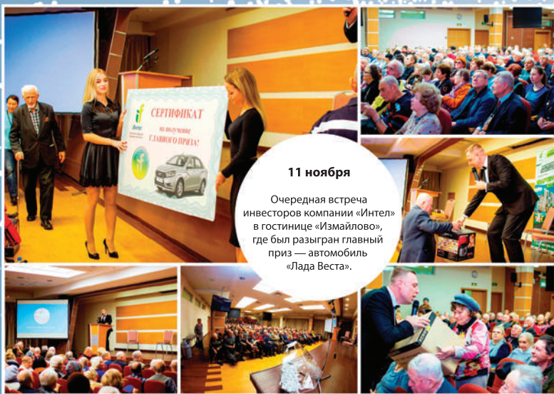
11 ноября Очередная встреча инвесторов компании «Интел» в гостинице «Измайлово», где был разыгран главный приз — автомобиль «Лада Веста».