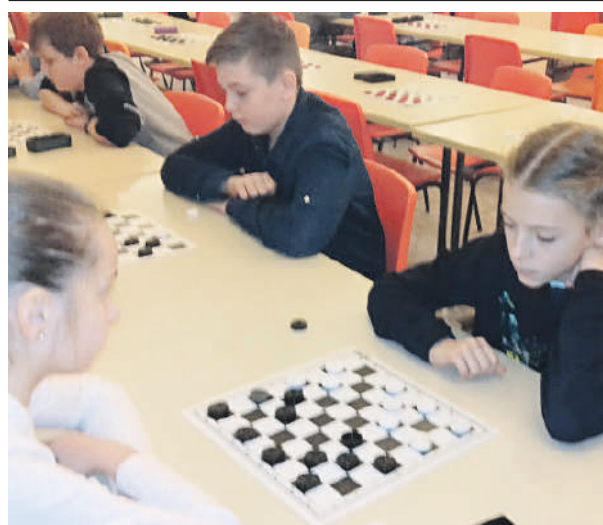
15 декабря 2018 года. Ученики школы № 1525 соревнуются в шахматах в рамках «Дня здоровья»