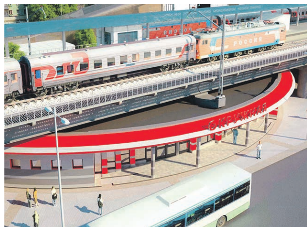
Проект транспортно-пересадочного узла «Окружная»