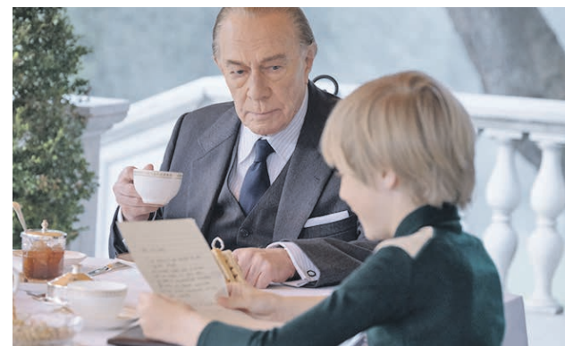
Кристофер Пламмер в роли Гетти (слева) и Кит Крэнстон в роли Марка Гетти в детстве

23 сентября на Первом канале запланирован показ нашумевшего фильма Ридли Скотта «Все деньги мира». В 23:10 вы окажетесь... в мире больших денег.