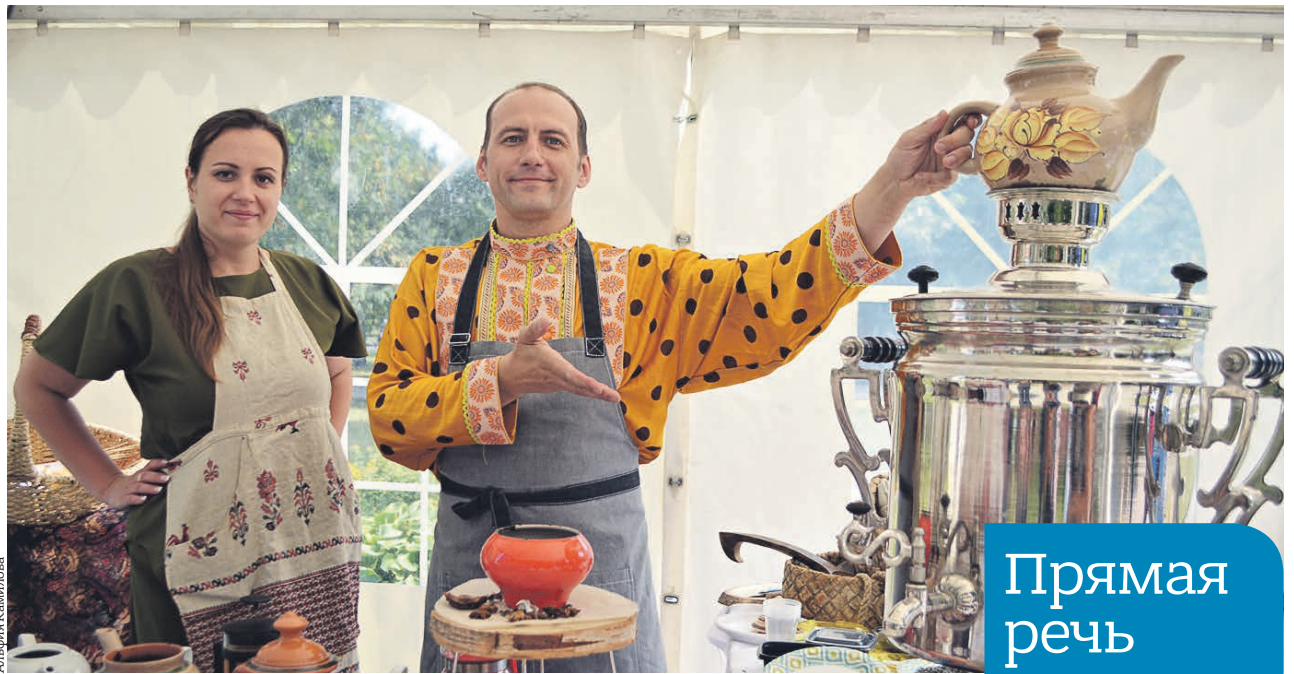
30 августа 2018 года. Гостей праздника встречали радушно и угощали душистым чаем

■ На мероприятие «Москва — любовь моя» участники проекта «Московское долголетие» пришли вместе с детьми и внуками.