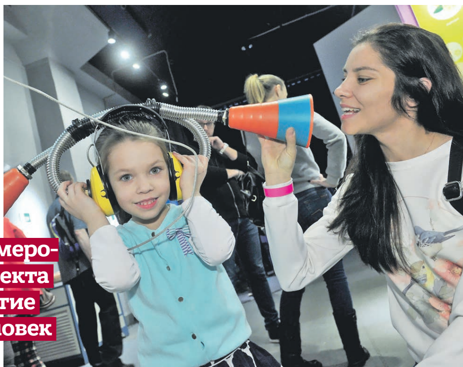
Агентство городских новостей «Москва»

■ Более 50 образовательных учреждений, среди которых вузы, колледжи, музеи и парки, приняли участие в мероприятиях, приуроченных к пятилетию проекта «Субботы московского школьника». Гостям прочитали лекции, желающие приняли участие в мастер-классах и спортивных мероприятиях, а также посетили твор-