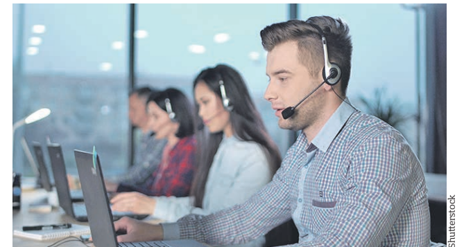
Штаб по защите бизнеса принимает звонки от столичных предпринимателей

Адрес: Вознесенский переулок, 22, 1-й этаж.