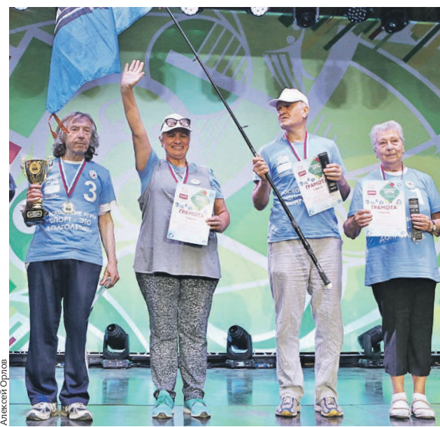
2 сентября 2018 года. Победители соревнований по айштокку (баварскому керлингу) с наградами