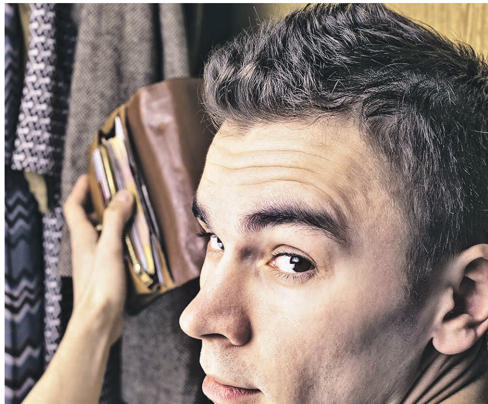
Если новоявленный поклонник стремится заглянуть в ваш кошелек, стоит задуматься, так ли искренни его чувства, как вам кажется