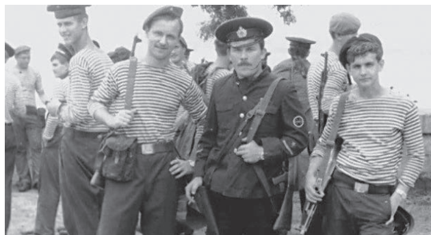
Кадр из фильма Татьяны Скабард «Последний парад «Беззаветного»

Это случилось 30 лет тому назад, в феврале 1988 года. На Черном море американскими военными и политиками была предпринята серьезная провокация. Совет-