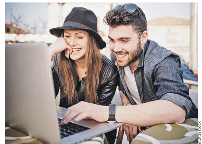
5 сентября 2018 года. Молодая пара отвечает на вопросы социологов