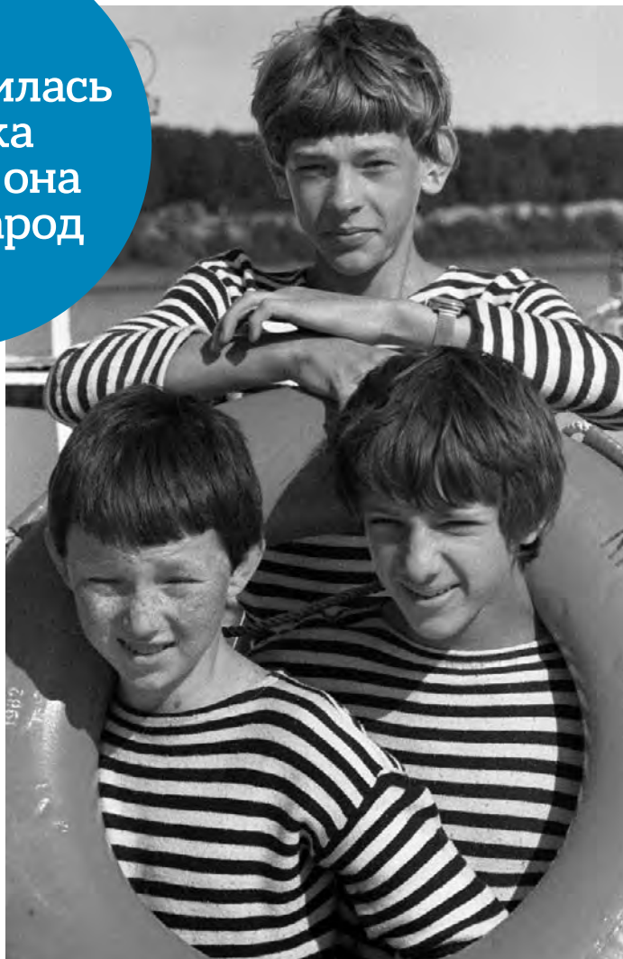
►1985 год. Юные моряки с гордостью носят тельняшки на занятиях в кружке детского речного пароходства