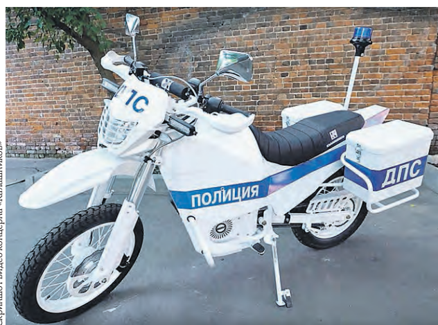
➔ Вчерашний концерт «Калашников» разместил в рунете презентацию нового электробайка для ГИБДД