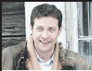
«Случайные знакомые» (2012)

В центре сюжета — пять женщин с маленькими детьми на одном из островов Ладожского озера.