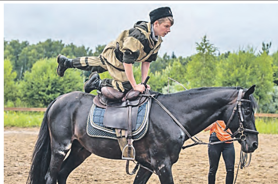
Департамент национальной политики и межрегиональных связей г. Москвы

О фестивале «Казачья станица Москва» → стр. VIII