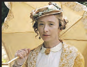
«Две женщины» (2014)

Мелодрама о двух противоположностях, которые по воле случая стали друг другу близкими.