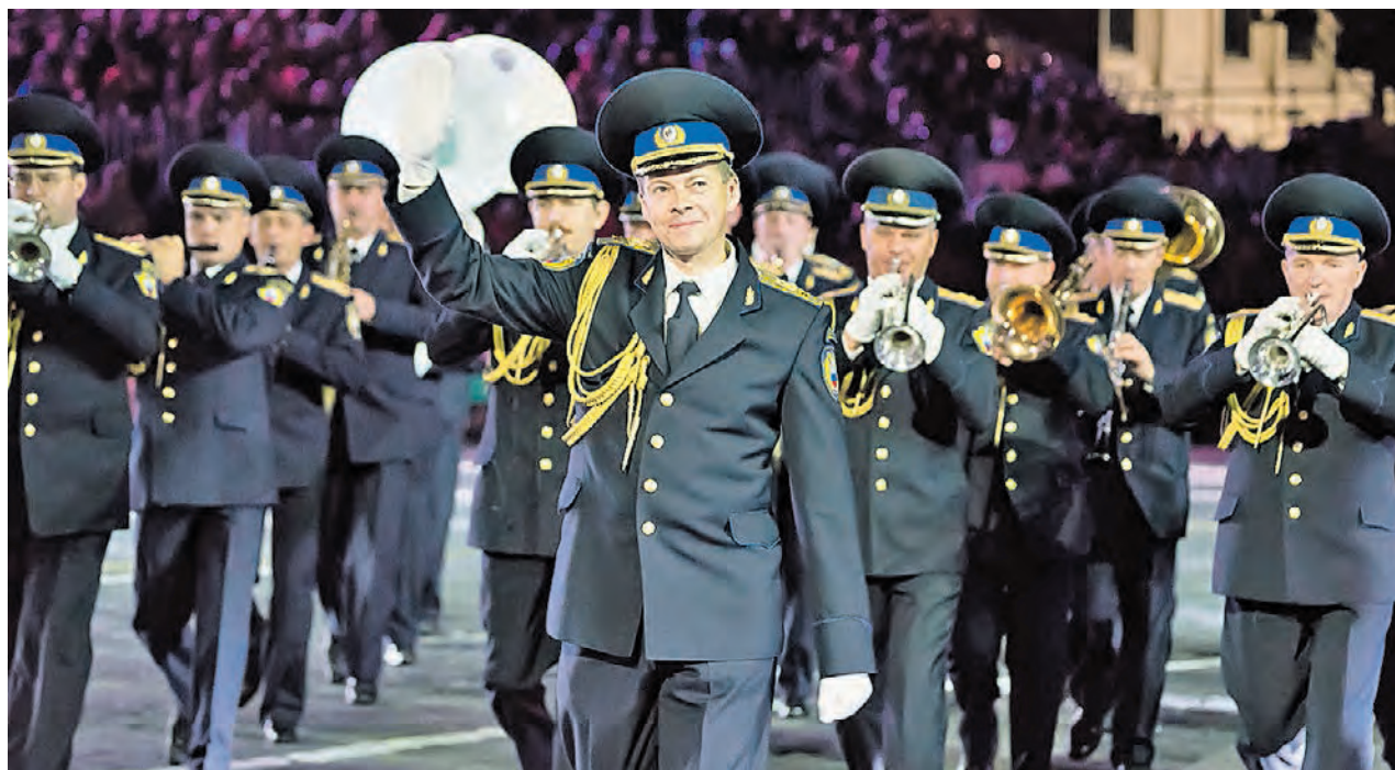
► Президентский оркестр службы коменданта Московского Кремля Федеральной службы охраны Российской Федерации во время выступления на фестивале «Спасская башня» — 2015. На переднем плане — Евгений Никитин

Президентский оркестр Российской Федерации — постоянный участник фестиваля, но, несмотря на это, мы каждый год стараемся придумать что-то новое, построить выступление так, чтобы оно запомнилось зрителю. Традиционно наш коллектив выступает совместно с ротой специального караула Президентского полка Службы