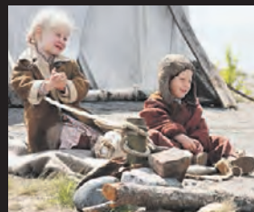
«Одна война» (2009)

Случайная встреча героев происходит на вокзале в минуту проводов своих семей на отдых.