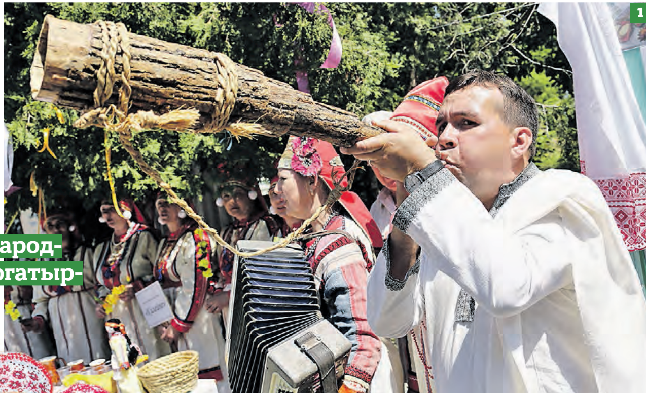
▶ 24 июня 2016 года. На празднике Шумбрат можно послушать мордовские народные мелодии (1), поучаствовать в мастер-классах и богатырских забавах, узнать историю национального костюма (2)

Тем более что в столице выходцев из этой республики живет немало — официально около 18 тысяч. Поэтому готовится весьма масштабная по своему размаху празд-