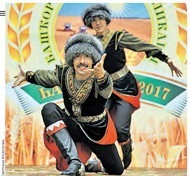
▶ 22 июля. Выступление башкирского танцевального коллектива на празднике Сабантуй