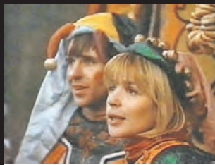
«Сломанный свет» (1990)

Вера Витальевна Глаголева была не только талантливой актрисой, но и отличным режиссером и превосходным сценаристом. «Вечерка» решила вспомнить ленты режиссера Глаголевой.