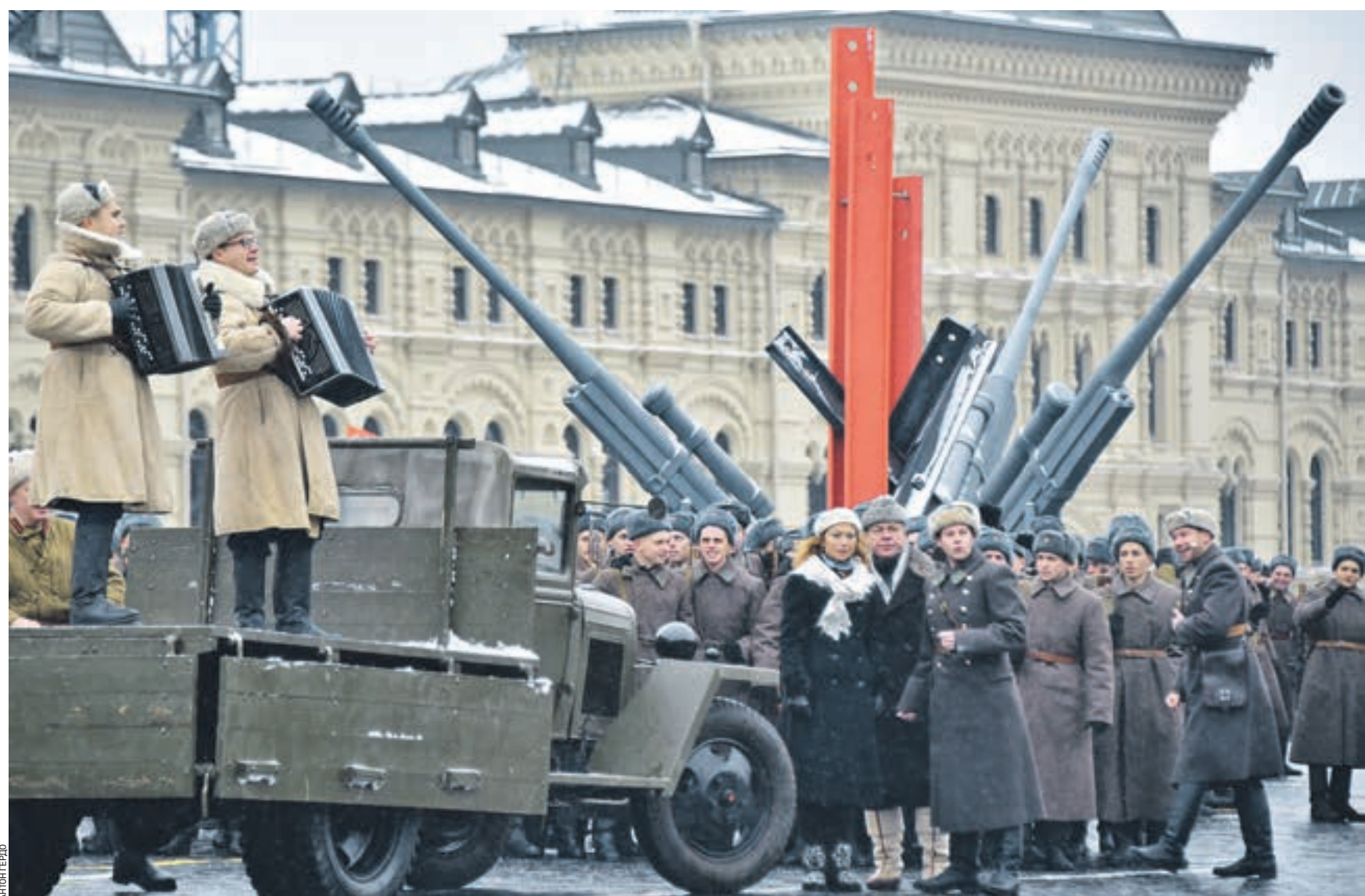
5 ноября 10:20 Красная площадь. Участники реконструкции военного исторического парада 1941 года исполняют марш танкистов из кинофильма «Трактористы»: «Броня крепка, и танки наши быстры»