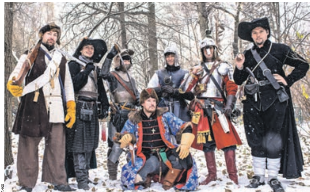
4 ноября 15:23 Лианозовский парк. Участники клубов исторической реконструкции воссоздали фрагменты битвы народного ополчения с польскими интервентами 1612 года