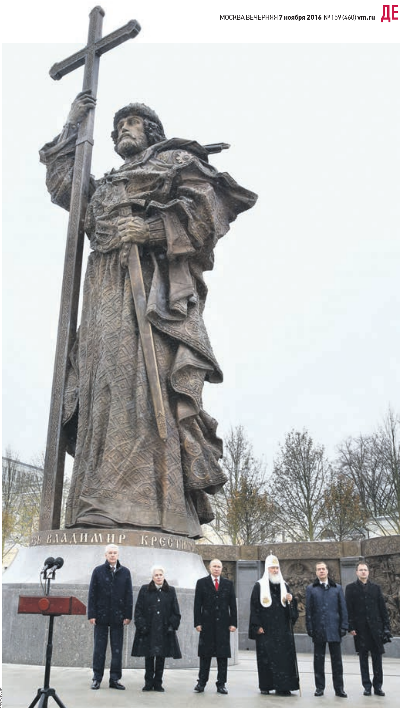
4 ноября 2016 года 13:16 В открытии памятника князю Владимиру приняли участие (слева направо): мэр Москвы Сергей Собянин, вдова писателя Александра Солженицына Наталия, президент России Владимир Путин, Патриарх Московский и всея Руси Кирилл, премьер-министр РФ Дмитрий Медведев и министр культуры РФ Владимир Мединский