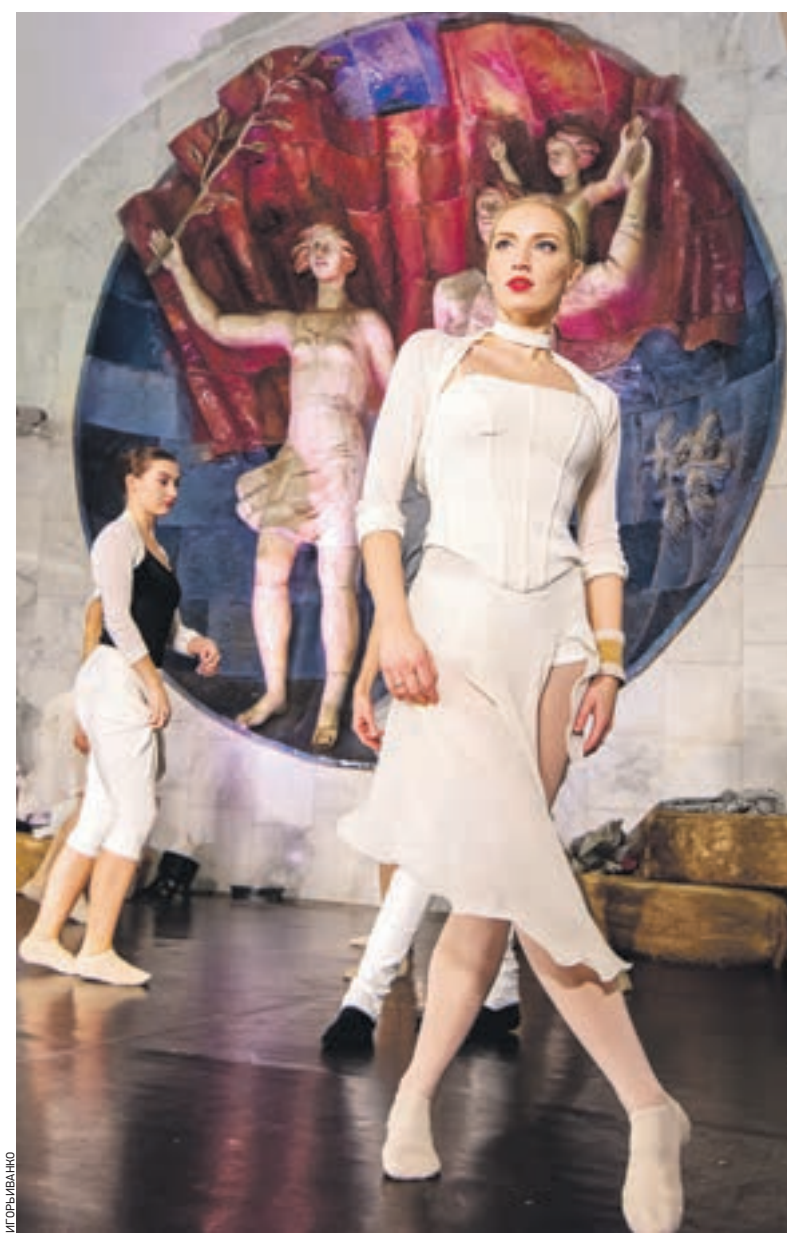
4 ноября 2016 года 23:12 Зал станции метро «Полянка» в рамках акции «Ночь искусств» на время стал настоящей сценой. На ней выступили артисты труппы театра «Балет Москва». Легкие белые наряды, отточенные па. Никаких слов, только танец. С его помощью артисты представили постановку под названием «Эквус». Она рассказывает зрителям историю балетной профессии, которая требует ежедневных усердных тренировок и эмоциональной отдачи

Сделав ставку на морскую тему, организаторы, что называется, сорвали джекпот: пришло так много посетителей, что зал не мог вместить всех одновременно, поэтому людям, отстоявшим очередь на улице, пришлось постоять еще и перед входом на выставку.