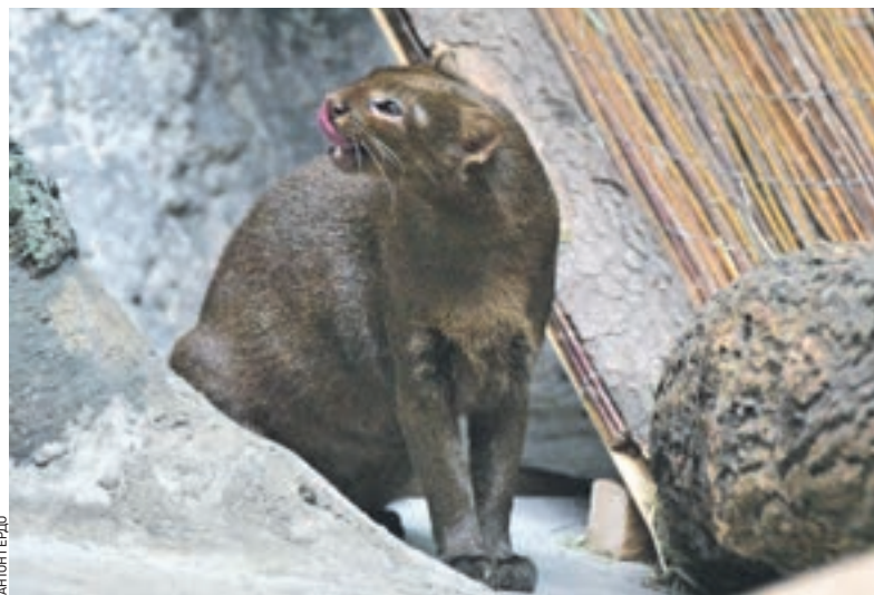
3 ноября 09:30 Самка ягуарунди, которую привезли из Германии, будет жить в Московском зоопарке вместе со своим женихом — ягуарунди из Сибири.

Ягуарунди — кошки небольших размеров (высота в холке в среднем — 25–35 сантиметров, вес — 4,5–9 килограммов), с вытянутым гибким телом на коротких сильных ногах и длинным тонким хвостом. Ягуарунди обитают в Центральной и Южной Америке, а также в США — в Южном Техасе и Аризоне. Это одиночные животные, в отличие от большинства кошачьих, активные в основном днем.