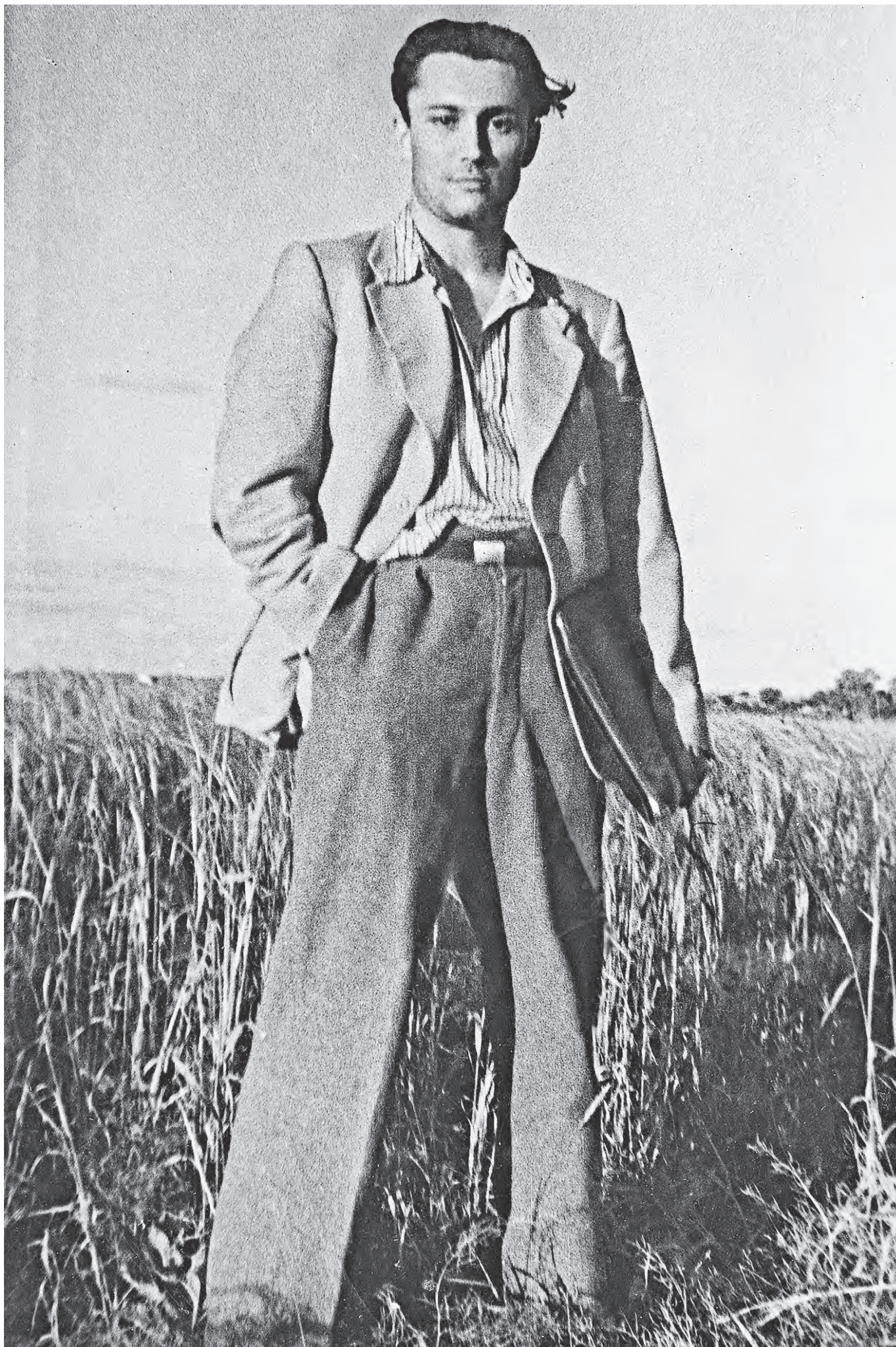
Юрий Нагибин. Около 1950 года. Писатель выглядел здоровым красавцем, но на самом деле война не прошла для него даром. После контузий у него остались нарушения слуха, а в минуты волнения начинался тик: Юрий Маркович крутил правой рукой перед лицом, будто крестился

На Волховском фронте Нагибин был инструктором 7-го отдела политуправления. Он занимался пропагандой на войска противника: читал трофейные документы, издавал листовки и газету на немецком языке, которые забрасывались в расположение фашистов самолетами. «Ездил я... также с радиопередвижкой, позволявшей непосредственно проводить десятипятнадцатиминутные передачи для войск про-