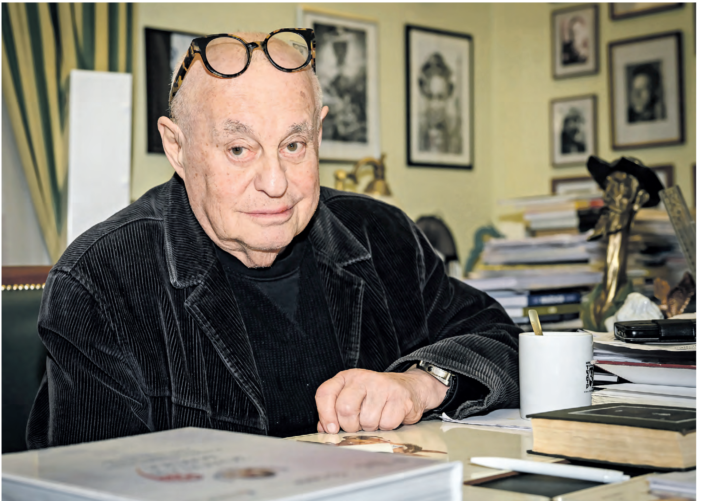
25 марта. Режиссер Марк Розовский в своем кабинете в созданном им театре «У Никитских ворот».

проникал в нутро человека, делал его зверем. И в Великую Отечественную войну, столкнувшись с фашистским зверем, мы же так его и называли, верно?