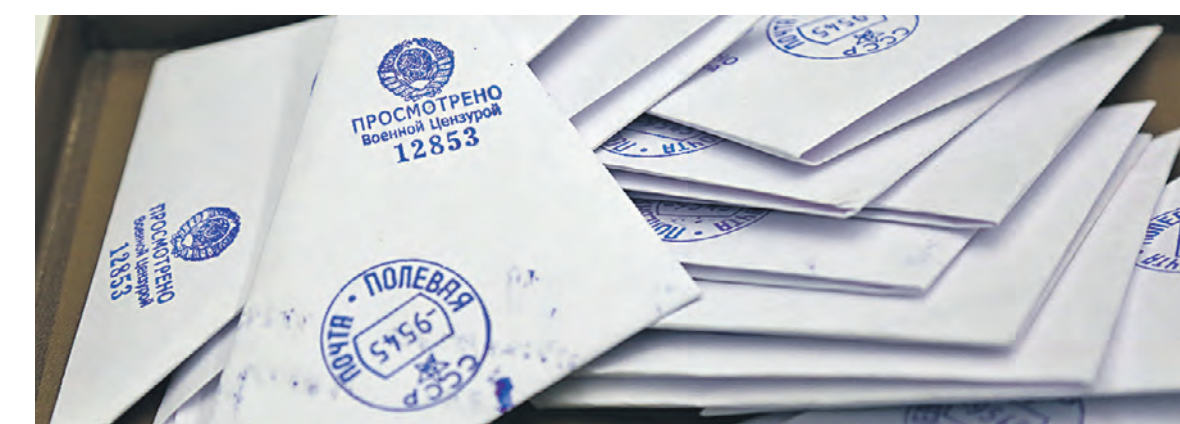
9 мая. В Музее Гаража особого назначения ФСО России отправили письма солдатам на СВО.