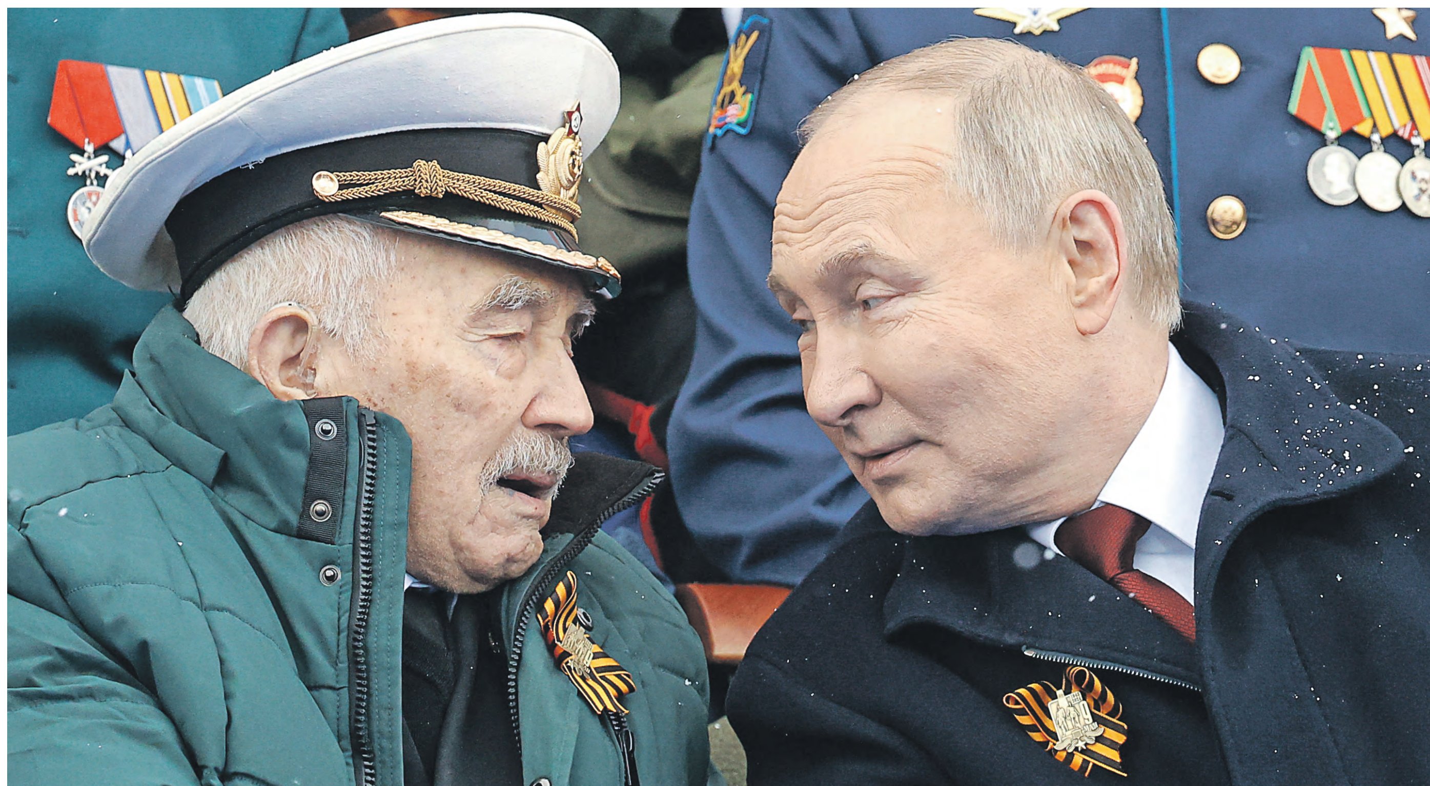
9 мая. Президент России Владимир Путин (справа) общается с ветераном Евгением Курapatковым во время парада на Красной площади