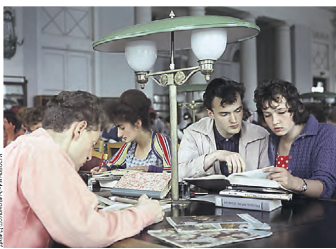
В читальном зале Государственной библиотеки имени Ленина всегда много посетителей. Фото 1962 года

только в случаях, требующих немедленной хирургической помощи, терапевтической или какого иного вмешательства. <...> «Скорая помощь» вызывается по телефону без номера (про-