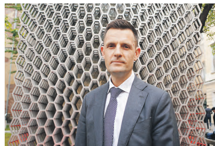
16 мая. Главный архитектор Москвы Сергей Кузнецов презентует свой арт-объект «Кристалл представления».

наших дней кирпичи. Выставка вдохновила главного архитектора Москвы на создание арт-объекта, который установили во дворе Государственного музея архитектуры имени Шусева. Сергей Кузнецов отметил, что название инсталляции — это отсылка к фильму Георгия Даниели «Кин-дза-дза!», в котором упоминается такой элемент. — «Кристалл представления» олицетворяет всю красоту и сложность такого художественного строительного материала, как кирпич Фальконье, имеющего бесконечное количество проявлений, вне зависимости от освещения, погоды, архитектуры. И в то же время он заигрывает с воображением зрителя, все время меняясь у него на глазах и вызывая на диалог, — рассказал он.