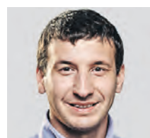
ОЛЕГ ЦАПКО ПРЕДСЕДАТЕЛЬ ВСЕРОССИЙСКОГО СТУДЕНЧЕСКОГО СОЮЗА

Так что, прежде чем вводить оценки за что-либо, в том числе и за поведение, нужно определить четкие критерии и стандарты: что есть плохо и что есть хорошо. Например, у нас есть понятие «духовно-нравственные ценности», но что именно входит в это понятие, пока нигде четко не прописано. Еще в Российской империи эти критерии были, и они согласовывались со Священным Писанием. Считаю, что современной молодежи надо продолжать опираться на эти заповеди.