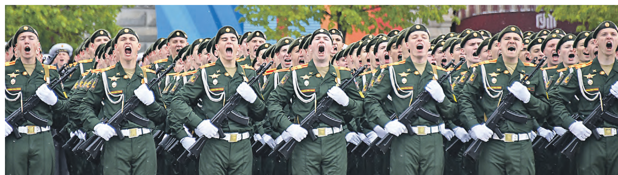
9 мая. Слушатели Военной академии сухопутных войск и Военной академии материально-технического обеспечения на Параде Победы.