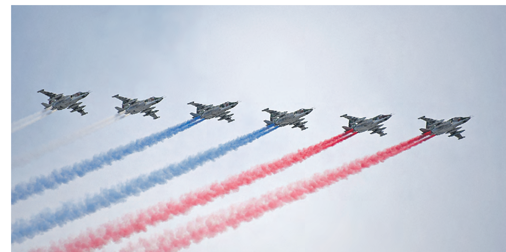
9 мая. Самолеты Су-25БМ окрасили небо над Москвой в цвета российского флага.