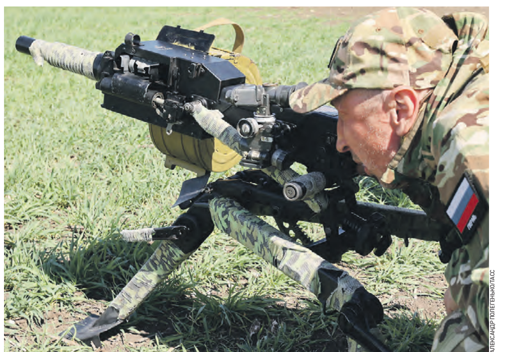
16 мая. Разведчик Новороссийского горного соединения ВДВ возле автоматического гранатомета АГС-17 «Пламя» во время работы на заповоронном направлении в зоне проведения специальной военной операции. Автоматический станковый гранатомет АГС-17 «Пламя» предназначен для поражения живой силы и огневых средств врага, расположенных вне укрытий.