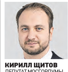
КИРИЛЛ ЗИТОВ ДЕПУТАТ МОСГОРДУМЫ

Я выпускник спортивной школы «Самбо-70». Когда был последний звонок, со школой было расставаться тяжело, все понимали, что теперь мы уходим в самостоятельную плавнину. Но большинство выпускников остались преданными школе и сегодня. Мы заедем туда, приезжаем на встречи выпускников, а в сентябре выпускники всех лет, не договорившись, собираются на день рождения школы. Так что наша школа всегда с нами.