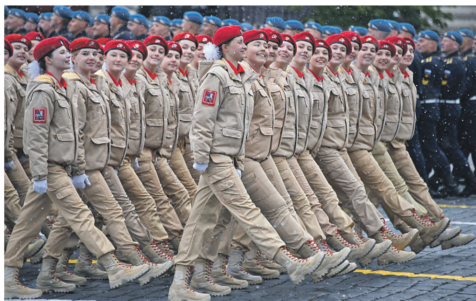
9 мая. Представители Всероссийского военно-патриотического общественного движения «Юнармия» на Параде Победы.

День Победы прошел, как всегда, с размахом. В каждом районе Москвы были организованы площадки, посвященные одному — чувству памяти тех, кто каждый из 1418 страшных огненных дней на фронте и в тылу приближал Великую Победу. Сегодня мы еще раз вспоминаем, как отпраздновали эту дату, и начинаем обратный отсчет до 9 мая 2025 года — юбилея разгрома немецко-фашистских войск и их европейских союзников Красной армией.