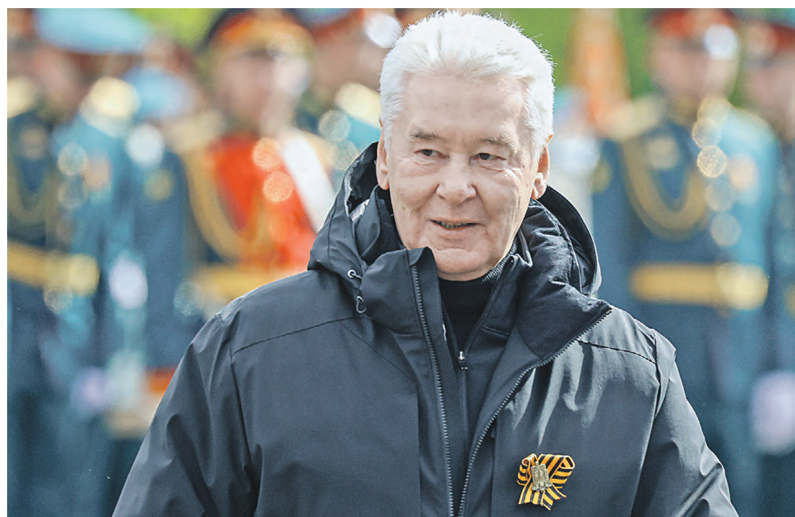
9 мая. Мэр Москвы Сергей Собянин во время парада на Красной площади