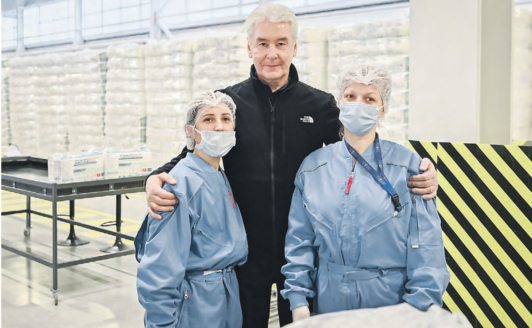
8 декабря 2023 года. Мэр Москвы Сергей Собянин пообщался с сотрудниками нового завода, выпускающего медицинские изделия. Площадку оборудовали в индустриальном парке «Руднево» всего за полгода. Локализация производства в столице гарантирует стабильность поставок изделий москвичам

— Только в прошлом году территория ОЭЗ увеличилась на 53 гектара, — написал Сергей Собянин. — Это произошло после ввода в эксплуатацию индустриального парка «Руднево», на базе которого по поручению Владимира Путина создан Федеральный центр беспилотных авиасистем. Кроме того, недавно к технополису присоединили участок площадью больше 5 гектаров. Там находится бывший производственный корпус автомобильного завода. Его реконструируют и отдадут предприятиям московского кластера электромобилестроения. Здесь же планируют выпускать аккумуляторы для электротранспорта. — Всего в ОЭЗ работает уже больше 200 предприятий, —