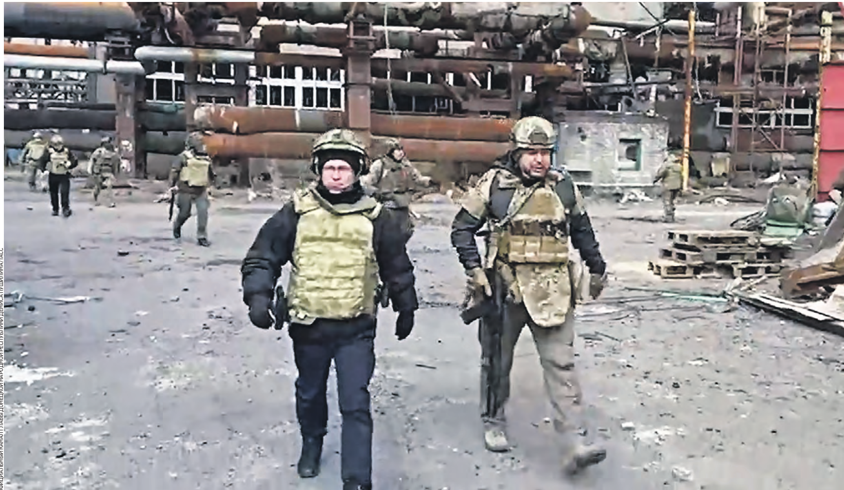
12 марта. Первый заместитель руководителя администрации президента РФ Сергей Кириенко (слева) и глава ДНР Денис Пушилин во время посещения Авдеевки. По просьбам жителей будет проведена необходимая работа по восстановлению города