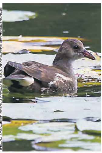
Камышница на пруду в парке «Яуза». Редкие птицы стали чаще выбирать столицу местом своего обитания

На Яузе в природно-историческом парке «Останкино» специалисты обнаружили редкую птицу — камышницу. Корреспондент «ВМ» узнала, на каких еще природных территориях города обитают редкие животные.