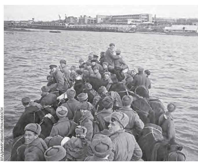
13 марта 1944 года. Советские войска освободили Херсон — последний контролируемый противником город на Днепре

Это был последний контролируемый противником город на берегах Днепра. Взятие Херсона было поручено частям 49-й гвардейской стрелковой дивизии и 295-й стрелковой дивизии.