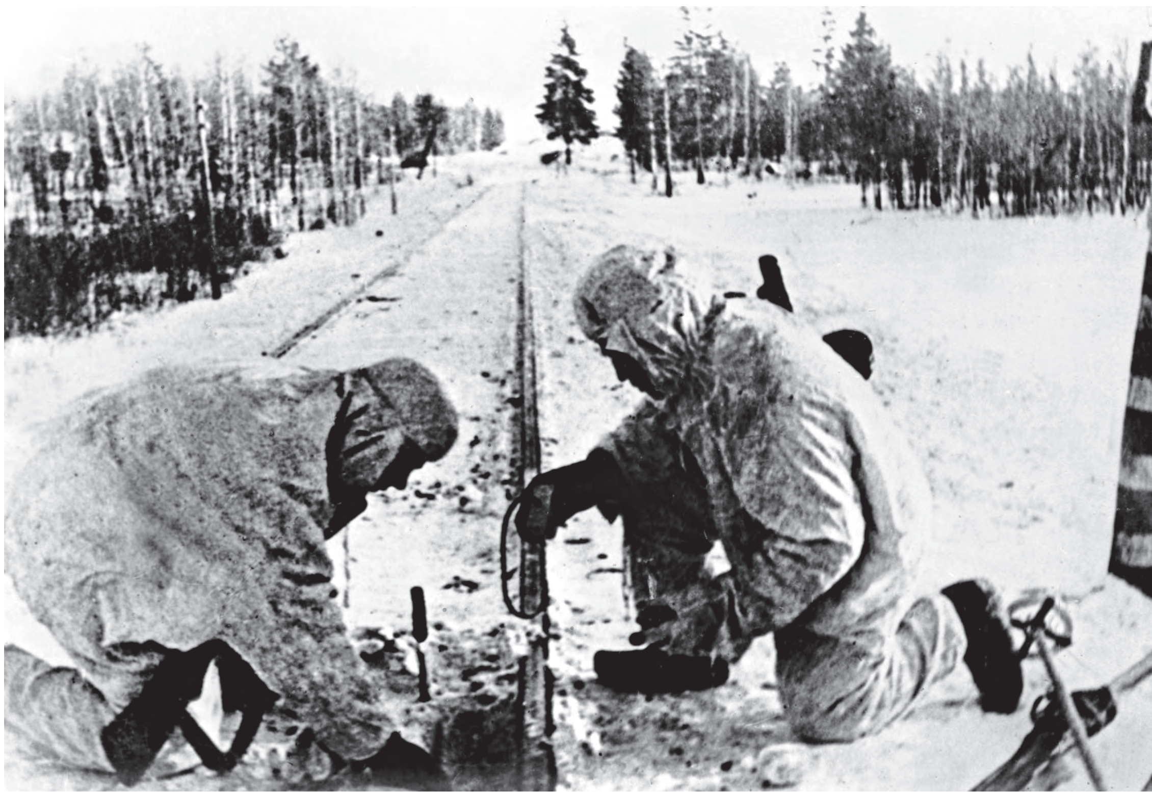
1941 год. Управление НКВД по Москве и Московской области участвовало в обороне столицы от гитлеровских захватчиков. Чекисты организовали спецшколу, где изготавливали мины и готовили диверсантов