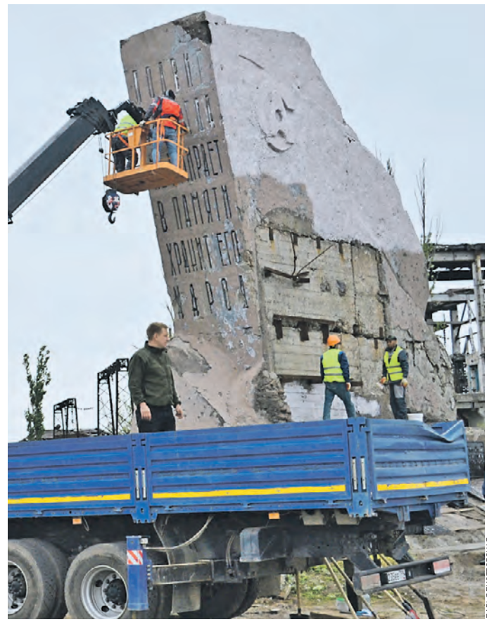
8 мая 14:32 Волонтеры убирают территорию комбината «Азовсталь» и помогают восстанавливать объекты

Мы продолжаем серию публикаций, в которых рассказываем о бойцах, мужественно защищающих нашу страну в ходе спецоперации. Их пример показывает, что воинские традиции времен Великой Отечественной и в современной Российской армии чтят свято.