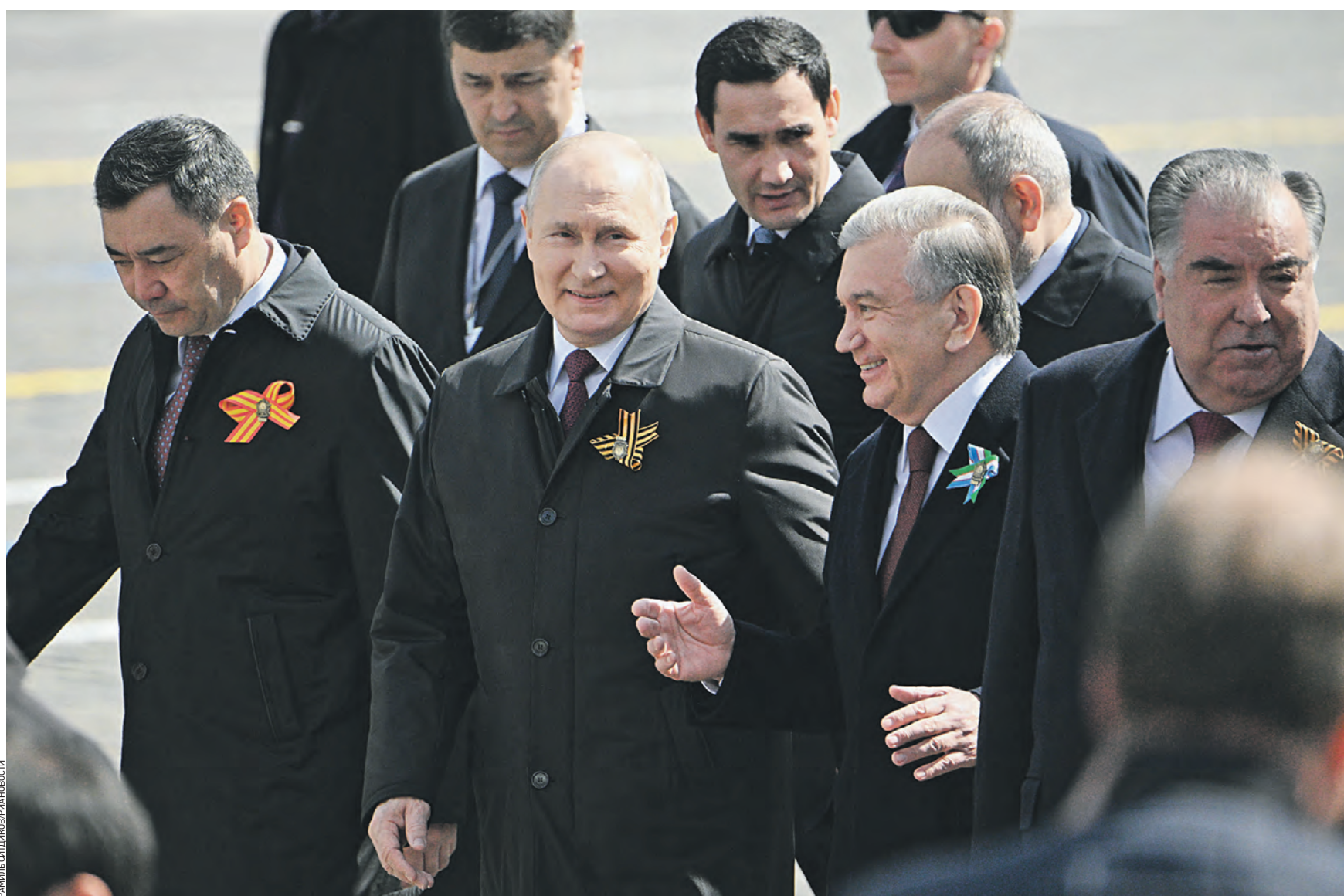
Вчера 10:53 (слева направо) Президент Киргизии Садыр Жапаров, президент России Владимир Путин, президент Узбекистана Шавкат Мирзиёев и президент Таджикистана Эмомали Рахмон на Красной площади в Москве, где только что завершился парад, посвященный 78-й годовщине Победы в Великой Отечественной войне

Военнослужащие почетного караула под песню «Священная война» проносят перед стройными рядами парадных расчетов российский триколор и красное Знамя Победы. Парадом командует главнокомандующий Сухопутными войсками РФ Олег Салюков. В центре Красной площади главнокомандующий министру обороны России Сергею Шойгу о готовности войск Московского гарнизона к параду. Открывается парад торжественным шествием пешеходных колонн, среди них — расчеты военной полиции, несколько сотен участников специальной военной операции, бойцы Отдельной дивизии оперативного назначения имени Дзержинского войск национальной гвардии. Затем по брусчатке главной площади страны громыхает военная техника — машины системы противовоздушной обороны С-400, ракетные комплексы стратегического назначения «Ярс». Во главе механической колонны бодро движется легендарный танк Т-34. Российский лидер обращается к гостям и участникам парада Победы с речью. — Сегодня цивилизация вновь находится на решающем, переломном рубеже. Против нашей Родины вновь развязана настоящая война, но мы дали отпор международному терроризму, защитим и жителей Донбасса, обеспечим свою безопасность, — подчеркнул