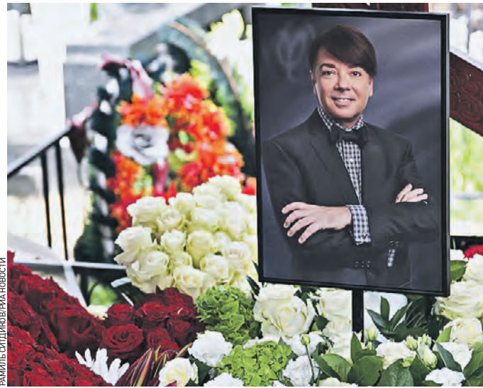
6 мая 2023 года. На Троекуровском кладбище состоялась церемония прощания с Валентином Юдашкиным

На Троекуровском кладбище простились с модельером Валентином Юдашкиным. Курьезе в 2016 года боролся с онкологией.