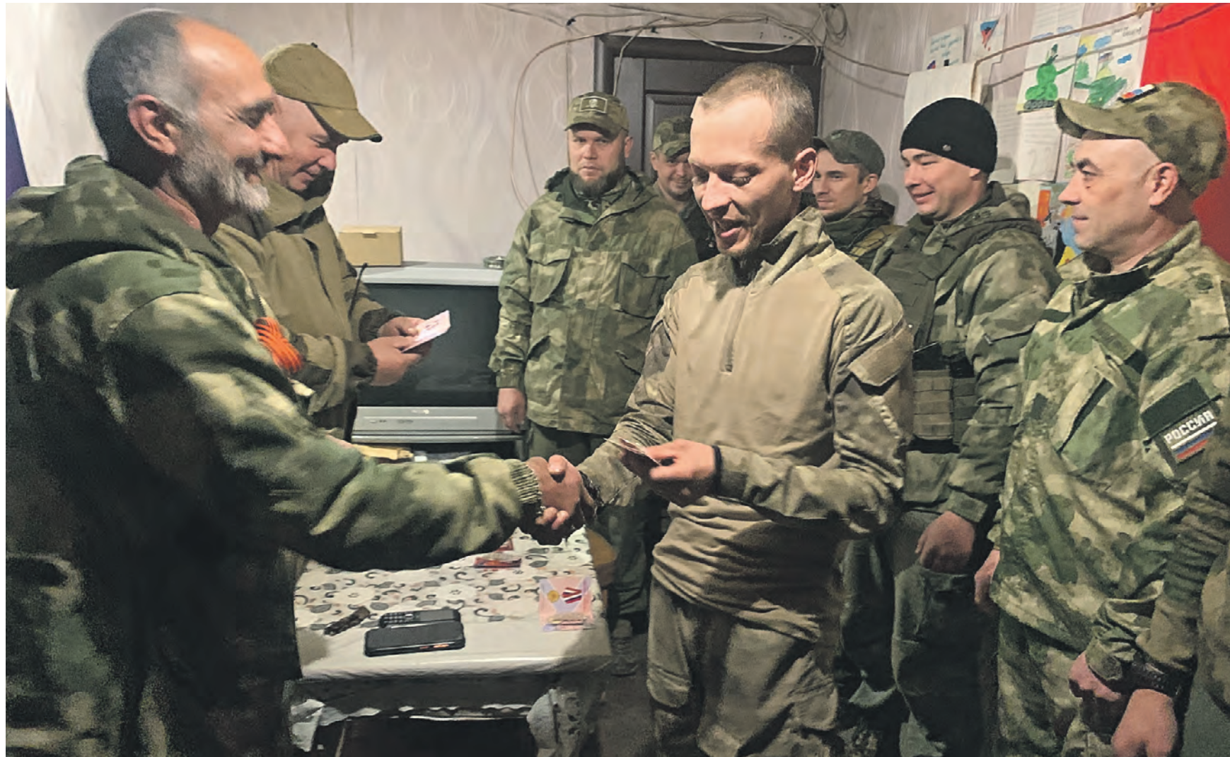
Вчера 13:47 Командир роты Рамзес (на фото слева на переднем плане) и его заместитель Бармалей награждают памятными медалями отличившихся бойцов своего подразделения на Авдеевском направлении