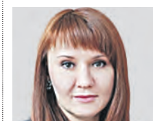
СВЕТЛАНА БЕССАРАБ ДЕПУТАТ ГОСДУМЫ РФ

Герой — это человек, на которого хочется равняться, с которого хочется брать пример. На которого с почтением, а может быть, даже и с восхищением смотрят не только взрослые, но и подрастающее поколение. Потому что мы учимся на героических поступках. Я думаю, что Герои Советского Союза и Герои России — это люди, которые заслуживают нашего глубочайшего уваже-