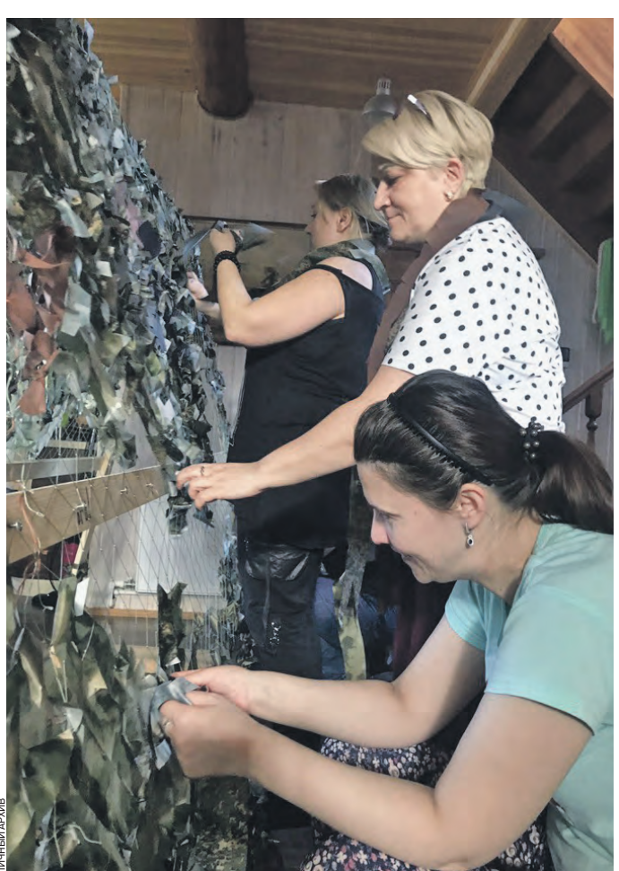
27 марта 2023 года. Волонтеры группы «Невидимки» плетут маскировочные сети, которые отправятся российским военнослужащим в зону спецоперации