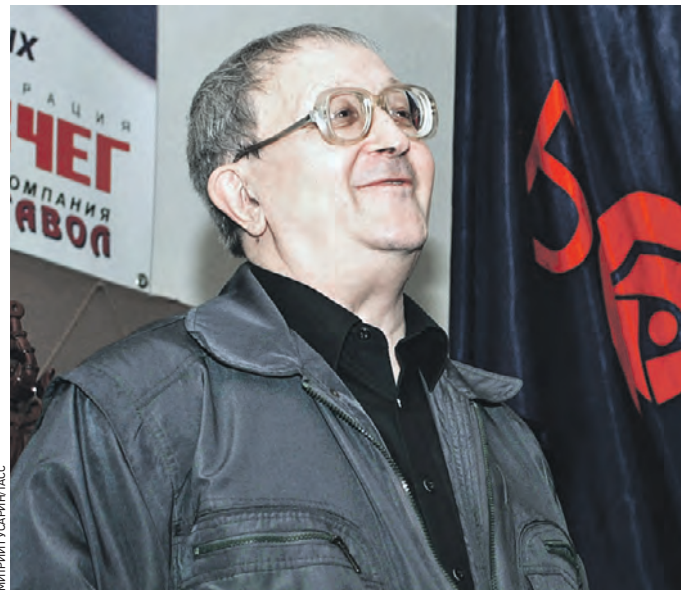
21 июня 2004 года. Писатель-фантаст Борис Стругацкий на церемонии награждения международной «АБС-премии»

Иван Ефремов, Кир Булычев, Александр Казанцев создавали в своих текстах утопический мир коммунистического будущего. В плане планетарного оптимизма творчество братьев Стругацких не вписывалось в магистральную линию. В своем видении перспектив и понимании природы человека они шли дальше большинства советских фантастов. Стругацкие исследовали прошлое, настоящее и будущее человеческой цивилизации на примере homo sapiens как носителя разума и раба своих внутренних комплексов, отталкиваясь от реалий своего времени, искали способы спасения мира от неизбежной деградации, обрушения в «темные века». Их фантастика «дальнего прицела» ставила под сомнение право человека называть себя творением Божьим или «царем природы». Если этот «царь» не может навести порядок не только на своей планете, но и в собственном сознании, зачем ему космос и будущее?