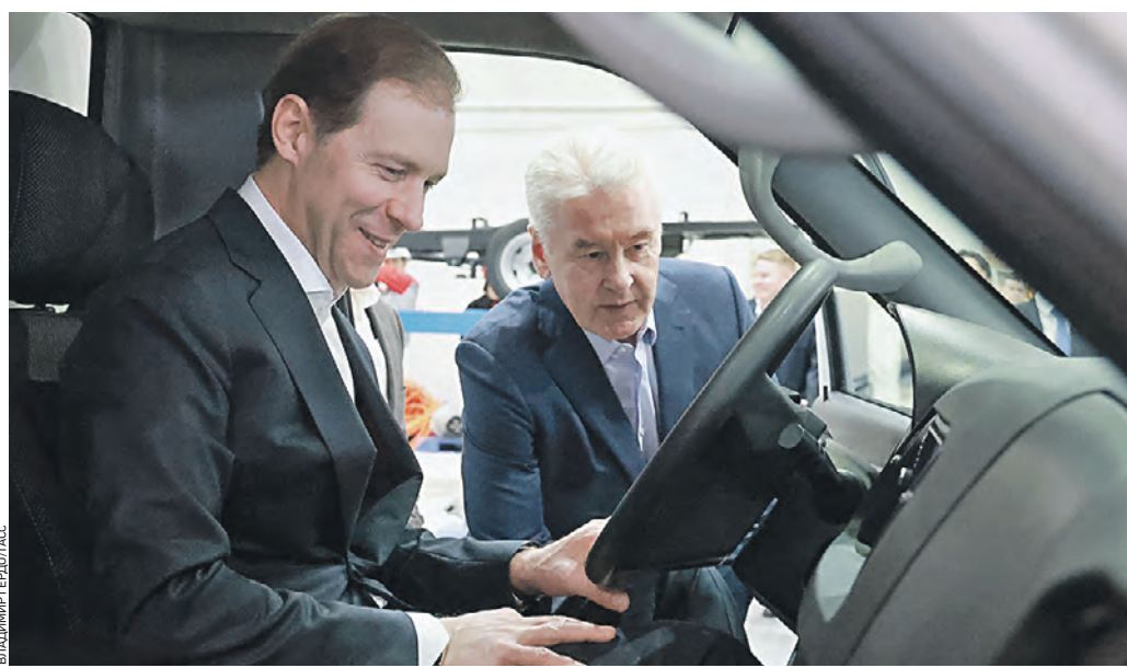
Вчера 17:18 Министр промышленности и торговли РФ Денис Мантуров и мэр Москвы Сергей Собянин (справа) осматривают первый российский электрогрузомобиль на производстве в особой экономической зоне «Технополис «Москва».

Уникальная разработка Площадь производственного комплекса, где создаются грузовые электромобили, составляет свыше 2,7 тысячи квадратных метров и включает цеха металлообработки и крупноузловой сборки, а также электротехнический цех. Введение санкций против России компания по разработкам