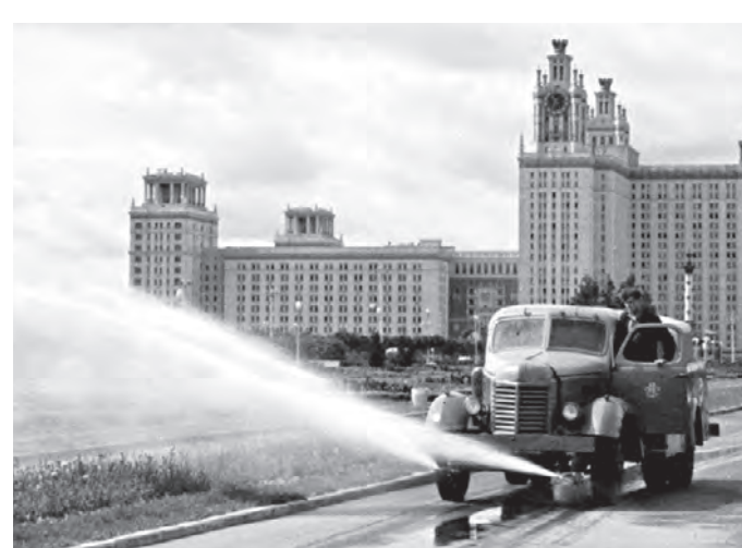
1950-е годы. Полив газонов у здания Московского государственного университета имени Ломоносова

Московским работникам «Жилищника» тоже есть чему поучиться. В Зеленограде спасатели рассказали о том, как тушить возможные пожары на природных территориях. — В ходе практических занятий, которые проводятся на базе нашего отдела, обучающимся рассказывают о способах тушения различных видов пожаров: лесных, болотных, полевых, торфяных. Также их обучают