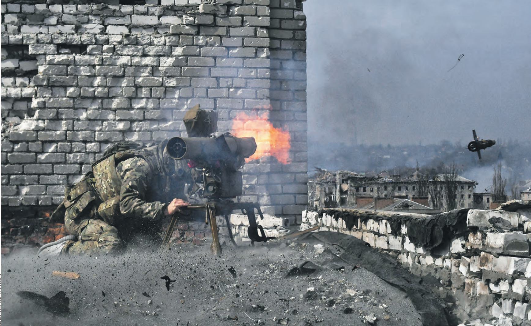
9 апреля 10:55 Боец ЧВК «Вагнер» ведет огонь из противотанкового ракетного комплекса по позициям националистов в Артемовске. Сейчас в городе идут ожесточенные бои. Российские силы уже взяли под контроль более 80 процентов территории населенного пункта

— ВСУ продолжают подтягивать резервы и перебрасывать их в городскую черту. Идут тяжелейшие кровопролитные бои, — сказал Евгений Пригожин. Он добавил, что под контролем российских сил находится уже более 80 процентов территории города. Наши военные делают успехи и на херсонском направлении. Там российским войскам удалось уничтожить около 35 украинских националистов. Кроме того, по словам Игоря Конашенкова, были