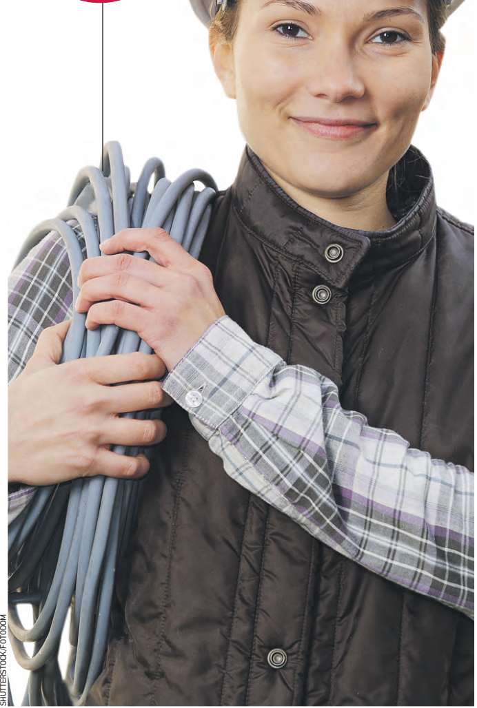
По данным mos.ru

20 000 москвичей прошли бесплатное обучение в прошлом году