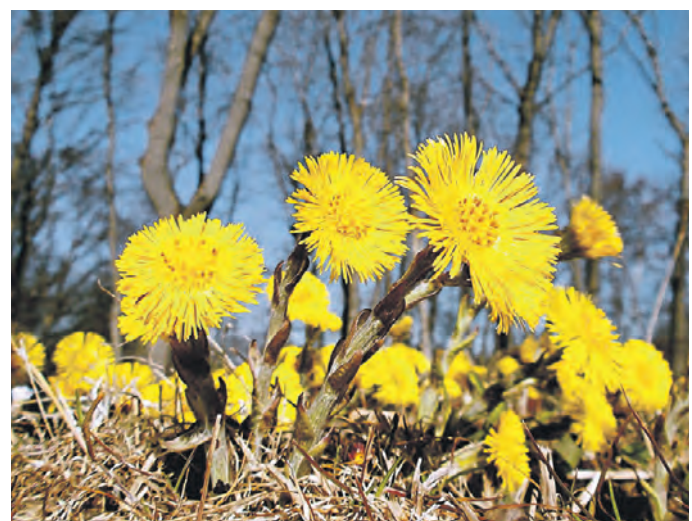
Вчера 12:33 Цветы мать-и-мачехи распустились в парке «Друзья леса» в Богородском районе