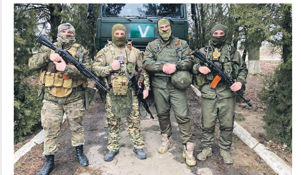
19 февраля. Морпехи, воюющие на Южном направлении, поблагодарили коллектив газеты «Вечерняя Москва», ее читателей и моряков-черноморцев за доставку им очередного гуманитарного груза — аптечек, раций, предметов личной гигиены, пауэрбанков и дизельного генератора