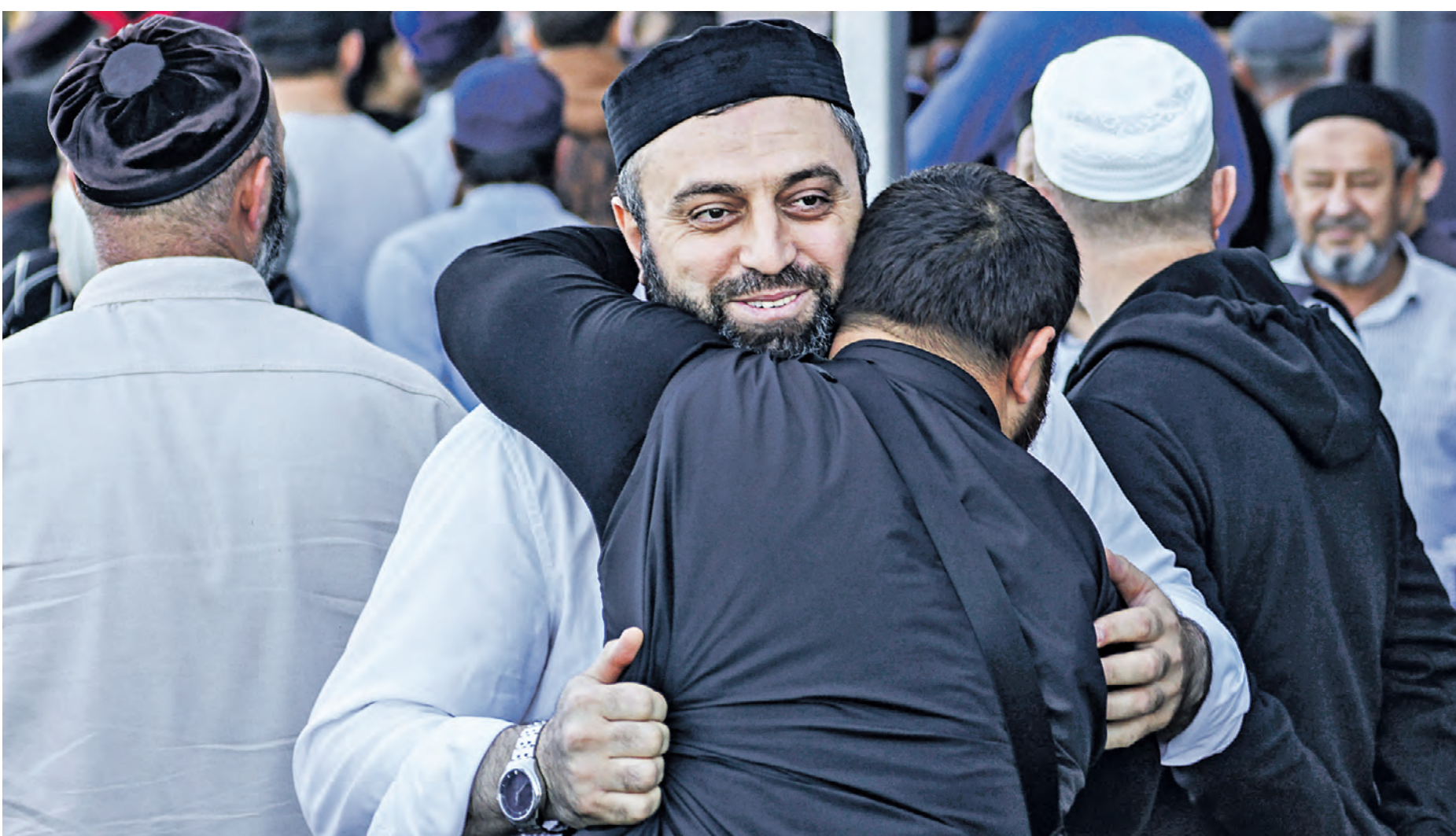
31 октября. Жители и гости Махачкалы на территории аэропорта, который возобновил свою работу. Последствия беспорядков были оперативно ликвидированы. А более двухсот зачинщиков противоправных действий уже задержаны правоохранительными органами

Майор Тамбовский У нас вообще-то статья есть в Уголовном кодексе за разжигание национальной и религиозной ненависти. Все понесут наказание, другим неповадно будет.