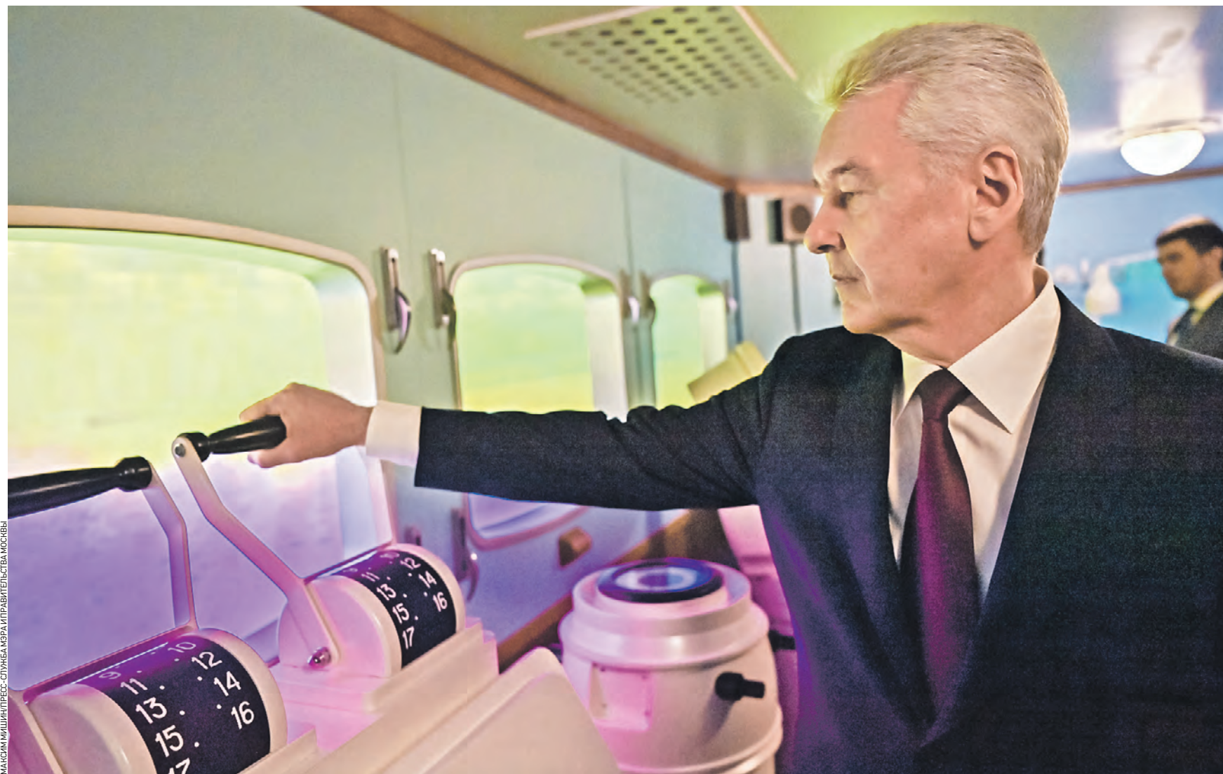
2 ноября. Мэр Москвы Сергей Собянин во время открытия павильона «Атом» на ВДНХ в рубке одного из экспонатов — атомного ледокола

В Музее городского хозяйства Москвы, расположенном в павильоне № 5 на ВДНХ, расскажут об особенностях работы столичных коммунальных служб, системах и технологиях, помогающих поддерживать бесперебойное жизнеобеспечение города на всех направлениях — от тепло-, газо-,