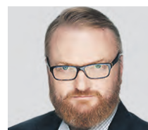
ВИТАЛИЙ МИЛОВ ДЕПУТАТ ГОСУДАРСТВЕННОЙ ДУМЫ

ство счастья, необходимо будет полностью переработать Уголовный кодекс. Например, физическое или психологическое насилие в семье у нас недостаточно регулируется и точно не будет подпадать под понятие «счастье». Для того чтобы контролировать эту область, нужно будет вносить много корректировок и изменений в имеющееся законодательство. Если министерство счастья будет делать новые регламенты по улучшению благосостояния россиян, это плавно коснется всех отраслей школьных, например, и медицинских учреждений. Если врач кричит на пациента, он что делает? Нарушает счастье человека. Этому сложному проекту будет недостаточно просто проверять новые законы: ему необходимо будет провести огромную работу по распространению этики и морали.