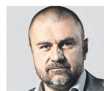
КИРИЛЛ КАБАНОВ ПРЕДСЕДАТЕЛЬ НАЦИОНАЛЬНОГО АНТИКОРРУПЦИОННОГО КОМИТЕТА

человека. Не на макроэкономические процессы, не на какие-то отрасли, а на наших граждан. Если какая-либо модель или идея не приносит людям счастья — она нерабочая. Поэтому новое министерство будет заниматься оценкой воздействия законов на человека, его ощущения и комфорт. Это важный параметр, над которым сейчас мало кто задумывается. Сейчас все смотрят на деньги и опираются на цифры. Но как говорит известная поговорка, не в деньгах счастье.