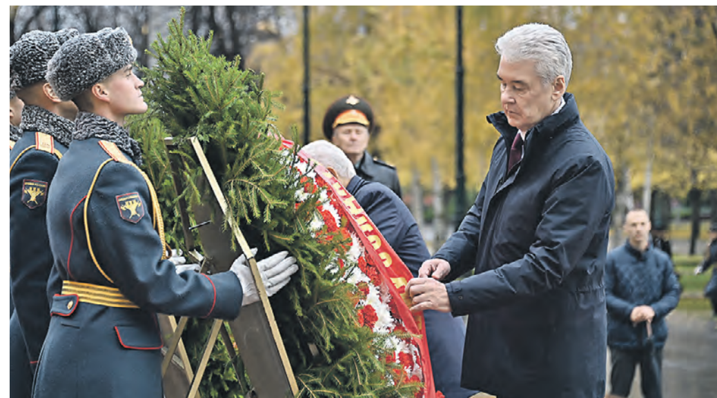
7 ноября. Мэр Москвы Сергей Собянин в день 82-летия со дня проведения легендарного парада на Красной площади возлагает венок к Могиле Неизвестного Солдата в Александровском саду

— 7 ноября 1941 года на Красной площади прошел легендарный военный парад. Он стал символом мужества и веры, помог укрепить боевой дух армии и всего советского народа, — напомнил уже в соцсетях Сергей Собянин.