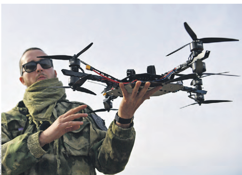
Российский военнослужащий учится управлять беспилотным летательным аппаратом на базе добровольческого батальона имени П. А. Судоплатова в Запорожской области. Теперь там создана школа для операторов БПЛА, а также налажено производство ударных FPV-дронов (с камерой для передачи видеозображения в реальном времени). Их будут использовать для нужд подразделений российской группировки войск, выполняющих боевые задачи в зоне спецоперации