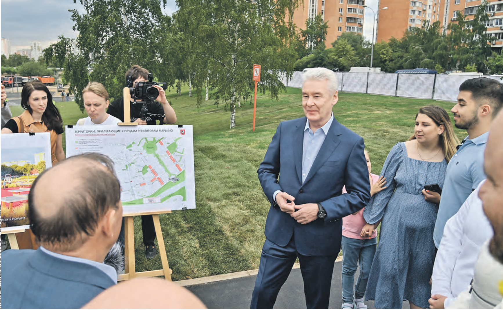
Вчера 13:22 Мэр Москвы Сергей Собянин (в центре) пообщался с горожанами, рассказав, как изменится территория возле Марьинских прудов. Вместо узких дорожек — широкие тротуары, удобные лавочки и освещение. Каскад из 16 водоемов станет любимым местом отдыха