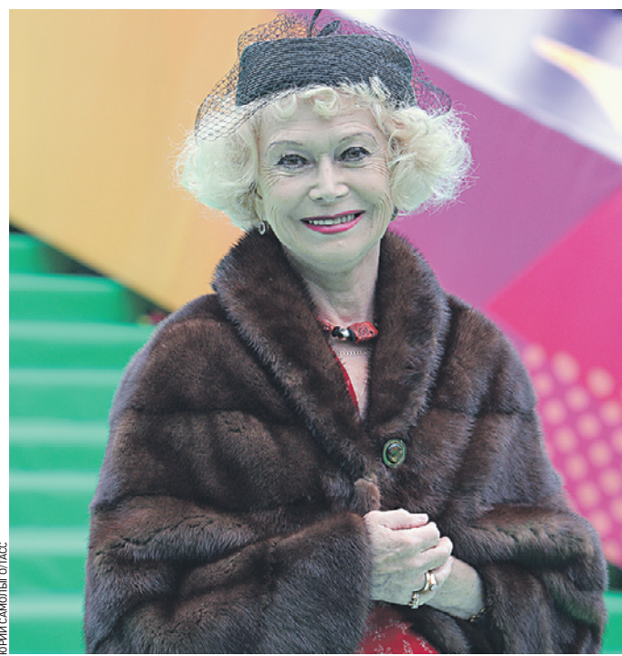
17 июня 2010 года. Актриса Светлана Немоляева на открытии Московского международного кинофестиваля

Точную цифру не назову, но я на возраст не заикаюсь и не страдаю, сколько бы мне ни исполнилось. Кто-то слышит дал такую способность. Это мое счастье. И к тому, что мне уже много лет, я отношусь абсолютно спокойно, философски. Люблю жизнь. Чувствую