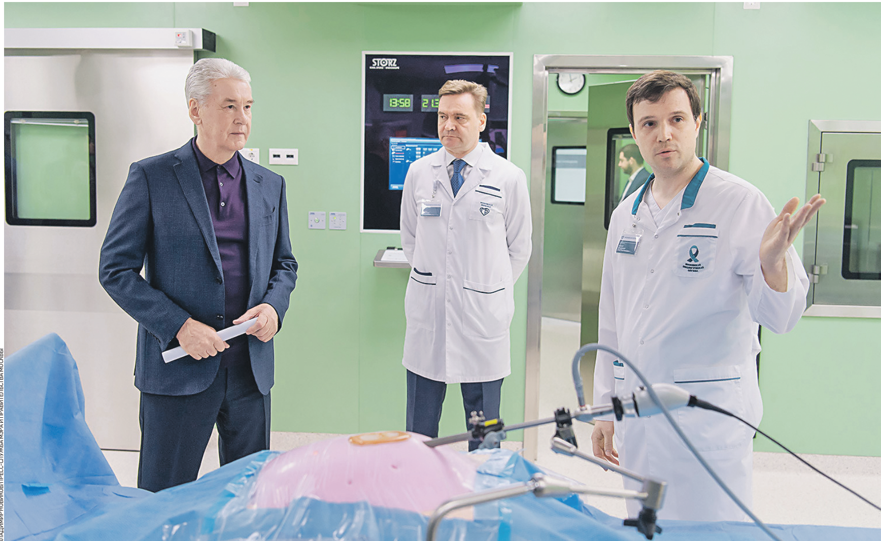
15 апреля 14:37 Главный врач городской клинической онкологической больницы № 1 Всеволод Галкин (в центре) и заведующий онкологическим отделением № 4 Владимир Лядов (справа) показали мэру Москвы Сергею Собянину оборудование обновленных операционных и других кабинетов корпуса № 7