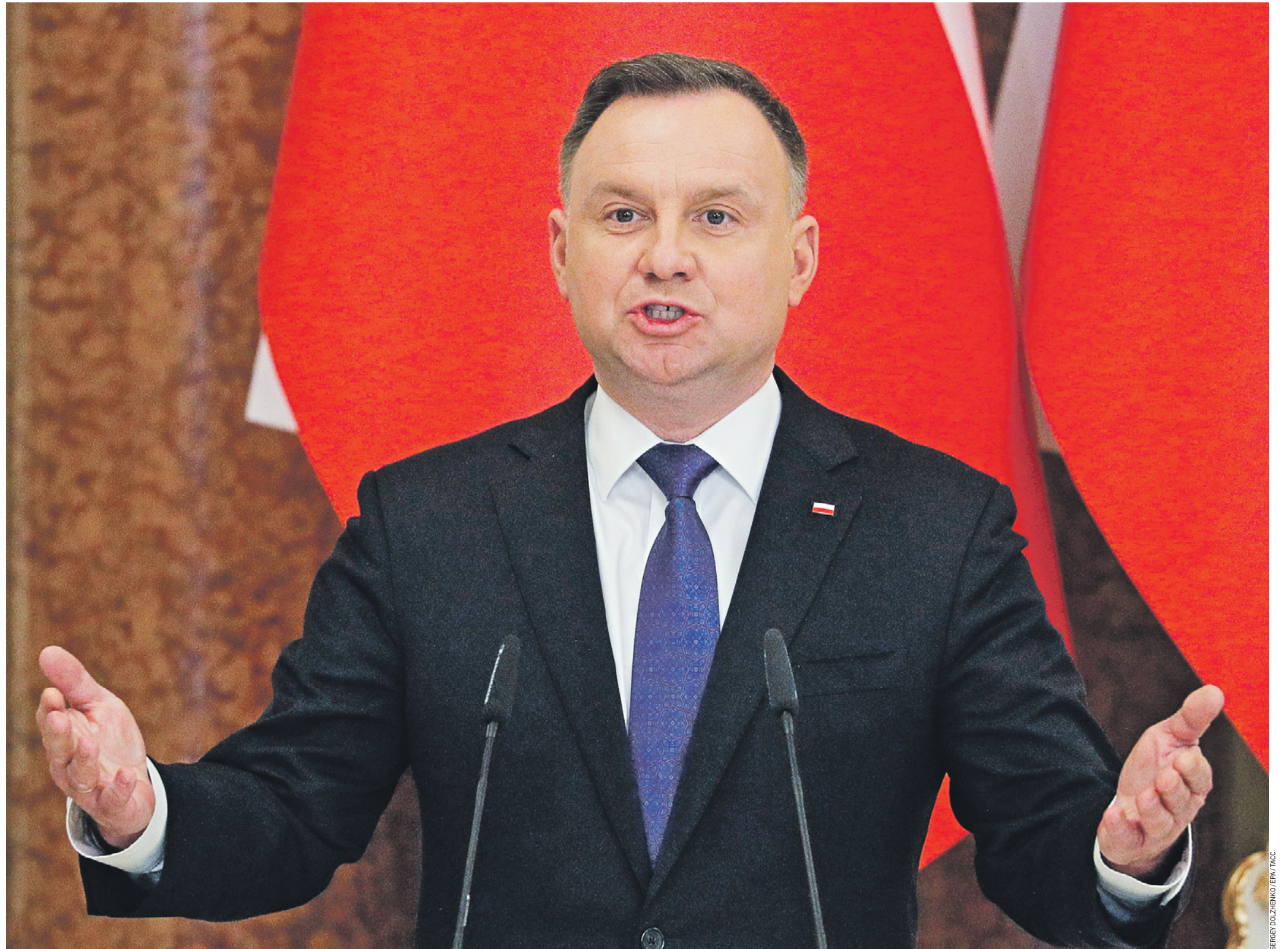
23 февраля 2022 года. Украина. Киев. Президент Польши Анджей Дуда на совместной пресс-конференции с президентом Украины Владимиром Зеленским. Похоже, он вполне готов «откусить» у соседей часть территории