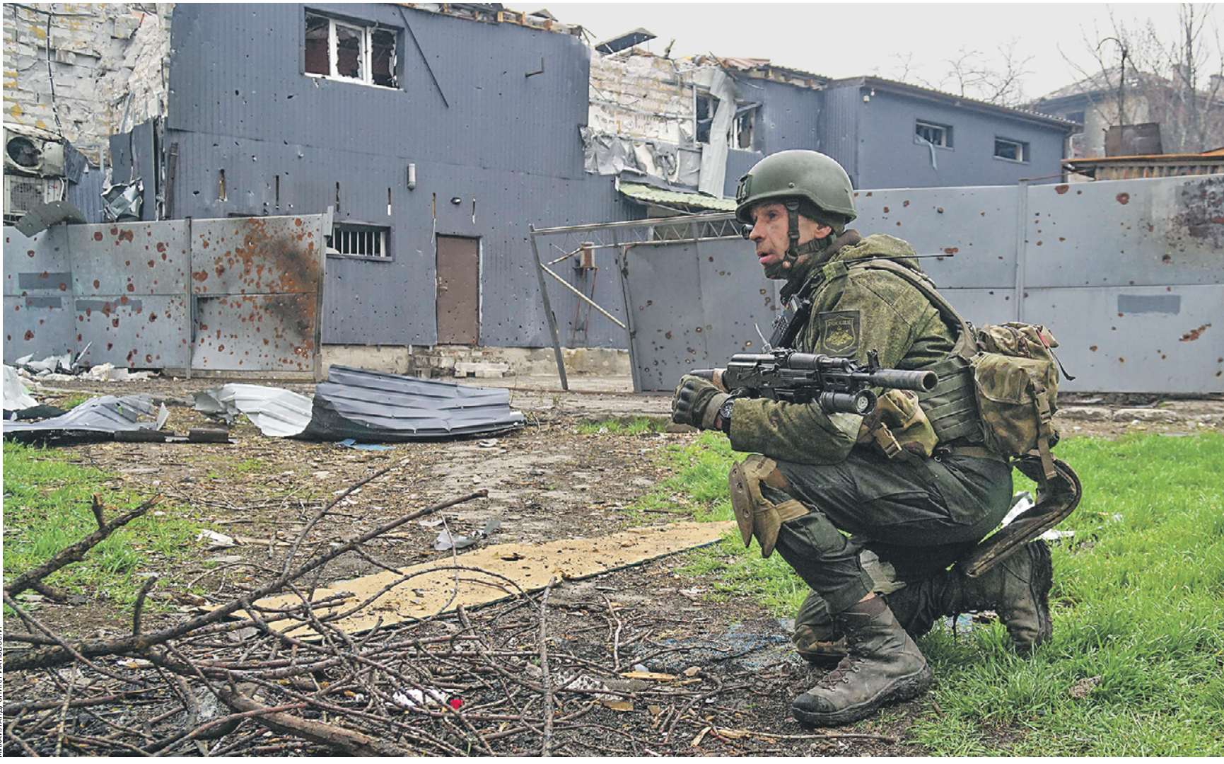
12 апреля 12:40 Военнослужащий Народной милиции ДНР осматривает местность в промышленной зоне на окраине города Мариуполя. Эти кварталы вплотную примыкают к заводу «Азовсталь», где заблокированы украинские боевики и наемники