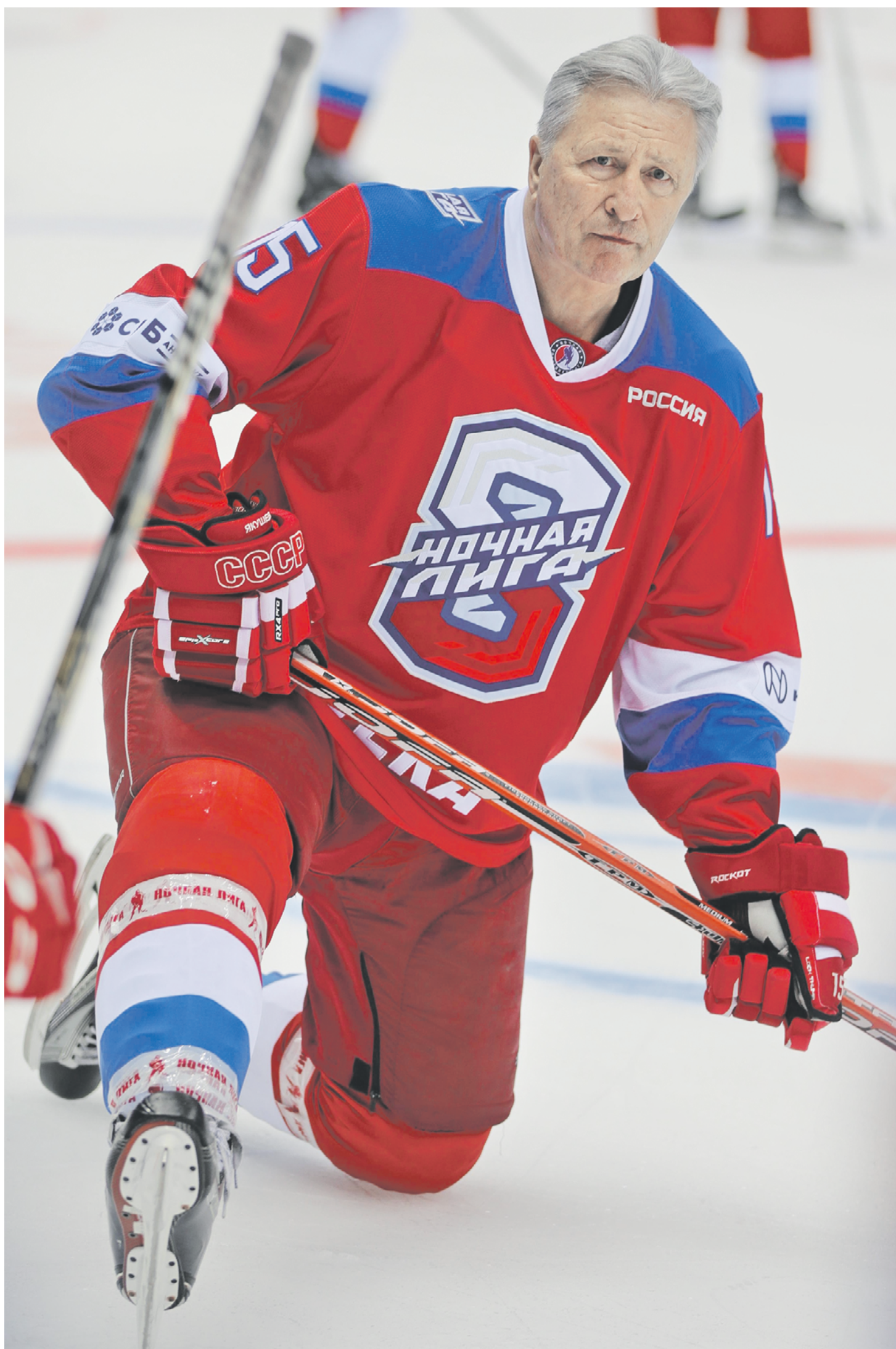
10 мая 2019 года. Александр Якушев перед началом гала-матча Ночной хоккейной лиги в ледовом дворце «Большой» в Сочи

Нет у меня к этим ребятам никакой зависти. Ни белой, ни черной. Пусть получают хорошие деньги, если того заслуживают. Моя спор-