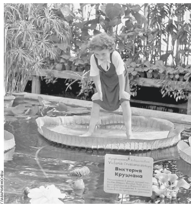
Цветущая тропическая кувшинка Виктория Крещанина в «Аптекарском огороде». 1953 год