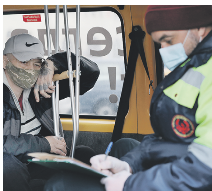
28 октября 2021 года. Переписчик и бездомный во время переписи населения на Комсомольской площади Москвы

Систему регистрации бездомных планируется усовершенствовать. Президент России Владимир Путин поручил правительству представить соответствующие идеи до 1 мая. Также правительство разработает меры поддержки некоммерческих организаций, которые оказывают живущим на улице социальную и медицинскую помощь.