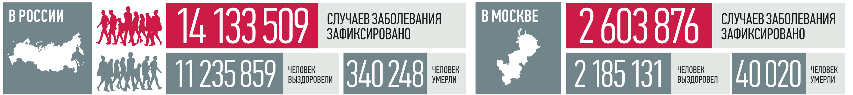
По данным стопкоронавирус.рф и mos.ru на 19:00 13 февраля

Россияне младше 18 лет смогут с 21 февраля самостоятельно получить печатный сертификат о вакцинации от COVID-19, медицинских противопоказаниях к прививке или перенесенном заболевании, вызванном коронавирусной инфекцией, следует из приказа Минздрава РФ. Соответствующий документ был опубликован в пятницу на официальном интернет-портале правовой информации. Ранее печатный ковид-сертификат могли получить только совершеннолетние.