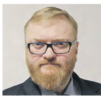
ВИТАЛИЙ МИЛОНОВ ДЕПУТАТ ГОСУДАРСТВЕННОЙ ДУМЫ

Мнения экспертов могут не совпадать с точкой зрения редакции «Вечерней Москвы»