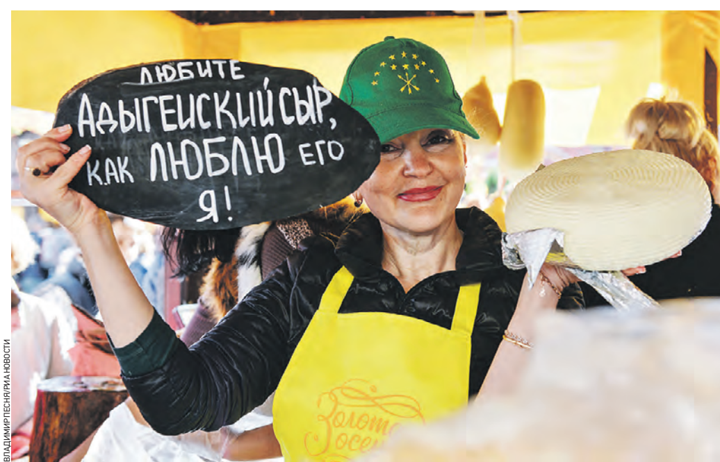
1 октября 2016 года. Продавец сыра во время мероприятия «Сырные дни», проходящего в рамках гастрономического фестиваля «Золотая осень» в Москве

Этот сыр, по словам эксперта, считается мягким, потому что его делают исключительно из коровьего молока. Несмотря на то что это гостовское название, лишь один из производителей («Адыгейский молзавод») указал стандарт в маркировке. Остальные сыры изготовлены по техническим условиям производителя. Это есть доверия к ним меньше. — Название «Адыгейский» имеет два значения: вид сыра по ГОСТу и наименование места происхождения. Это вносит путаницу и вводит в заблуждение потребителей, однако вина производителей