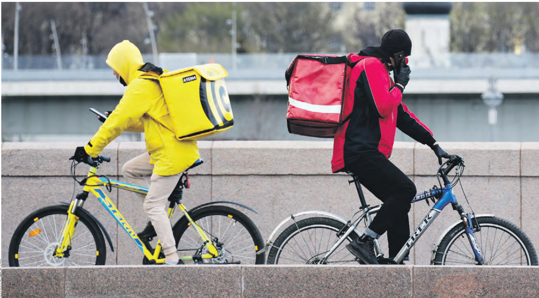
22 апреля 2020 года. Велокурьеры по доставке еды на Большом Москворецком мосту в период пандемии коронавируса COVID-19. Доставка готовой еды становится одним из наиболее быстро растущих бизнесов. Однако качество услуги порою хромает: горячие блюда могут привести остывшими и даже вовсе холодными

Немалую роль играет и время доставки. Оно, по словам Виталия Горюнова, зависит от многих факторов: популярности заведения, количества курьеров