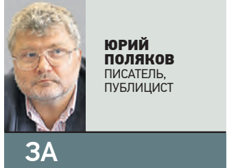
ЮРИ ПОЛЯКОВ ПИСАТЕЛЬ, ПУБЛИЦИСТ

Падение уровня знаний у выпускников школ и вузов — процесс общемировой. У него две глобальные причины. Первая — отказ в большинстве стран от университетской системы преподавания, содержащего основы всех наук, в пользу обучения утилитарно-фрагментарного, при котором даются только знания, предположительно нужные для дальнейшей самореализации. А вторая — как ни странно, повсеместная доступность интернета. Ощущение, что все можно в любой момент узнать по одному клику, лишило стимула к самостоятельному поиску, накоплению и усваиванию информации. А ведь знания, которые отложились в голове, не просто ждут своего часа — они независимо от твоего желания формируют картину мира, систему представлений, которая помогает решать эвристические задачи. В нашей стране есть и специфические беды. Подготовка к ЕГЭ предполагает натаскивание на то, чтобы проверяемый дал нужные ответы. Выпускник, не научившийся мыслить, при столкновении с профессиональными или жизненными проблемами беспомощен. Многолетний отказ от сочинений и устных ответов на экзаменах привел к тому, что два поколения выросли безграмотными и косноязычными. Даже выпускники гуманитарных факультетов не умеют строить связную фразу, их словарный запас минимален — ведь никто не оценивал, как они рассуждают вслух, не исправлял их ошибки.