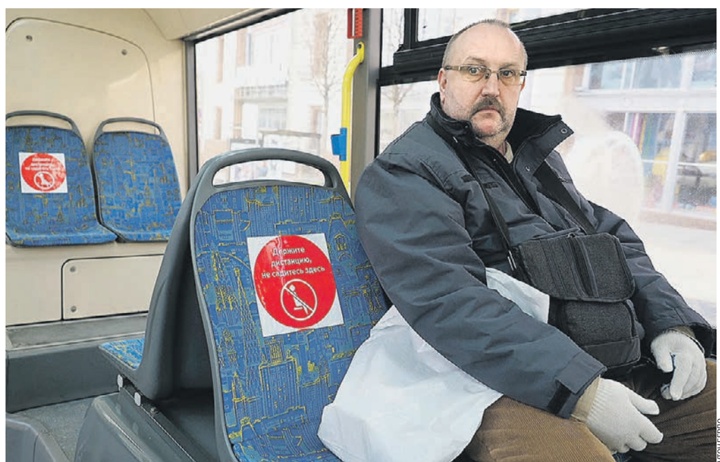
Вчера 17:22 Пассажир автобуса, курсирующего по маршруту № 904 от Белорусского вокзала к 4-му микрорайону Митина, соблюдает дистанцию, следуя рекомендации на наклейке