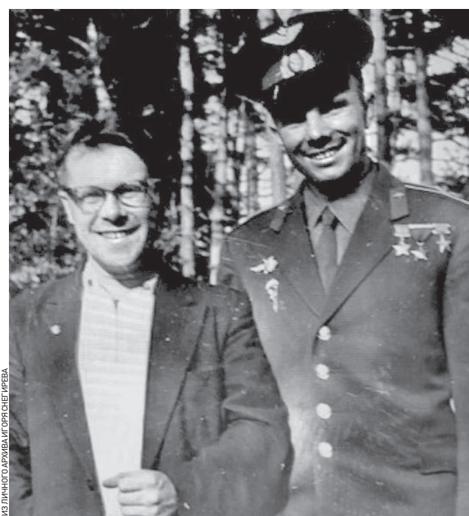
10 апреля 1963 года. Фотограф Игорь Снегирев (слева) с первым космонавтом Юрием Гагариным