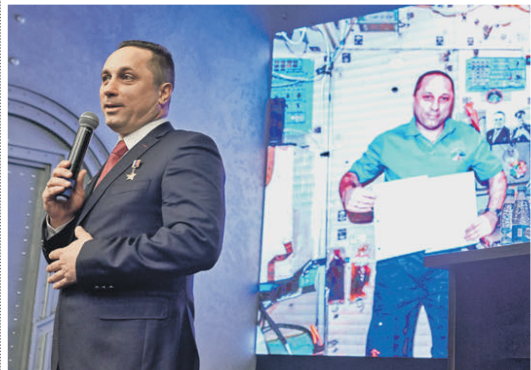
21 февраля 12:00 Герой России космонавт Антон Шкаплеров выступает перед участниками «Тотального диктанта»

Статистика показывает, что люди часто путают одну и две «и» в словах разных частей речи, забывают правила правописания «не» и «недо», а также — правила пунктуации на границах частей сложного предложения. Однако есть и хорошая новость: люди почти перестали путать, в каких случаях глагол оканчивается на «тса», а в каких — на «тсья».