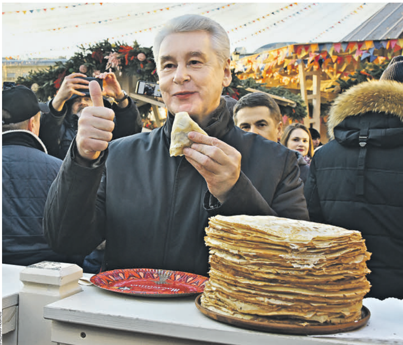
21 февраля 17:00 Мэр Москвы Сергей Собянин открывает на Манежной площади фестиваль «Московская Масленица» и пробует главное блюдо праздника

Всего на площадках работают свыше 200 торговых и ресторанных шале. Посетители могут попробовать более 210 ви-