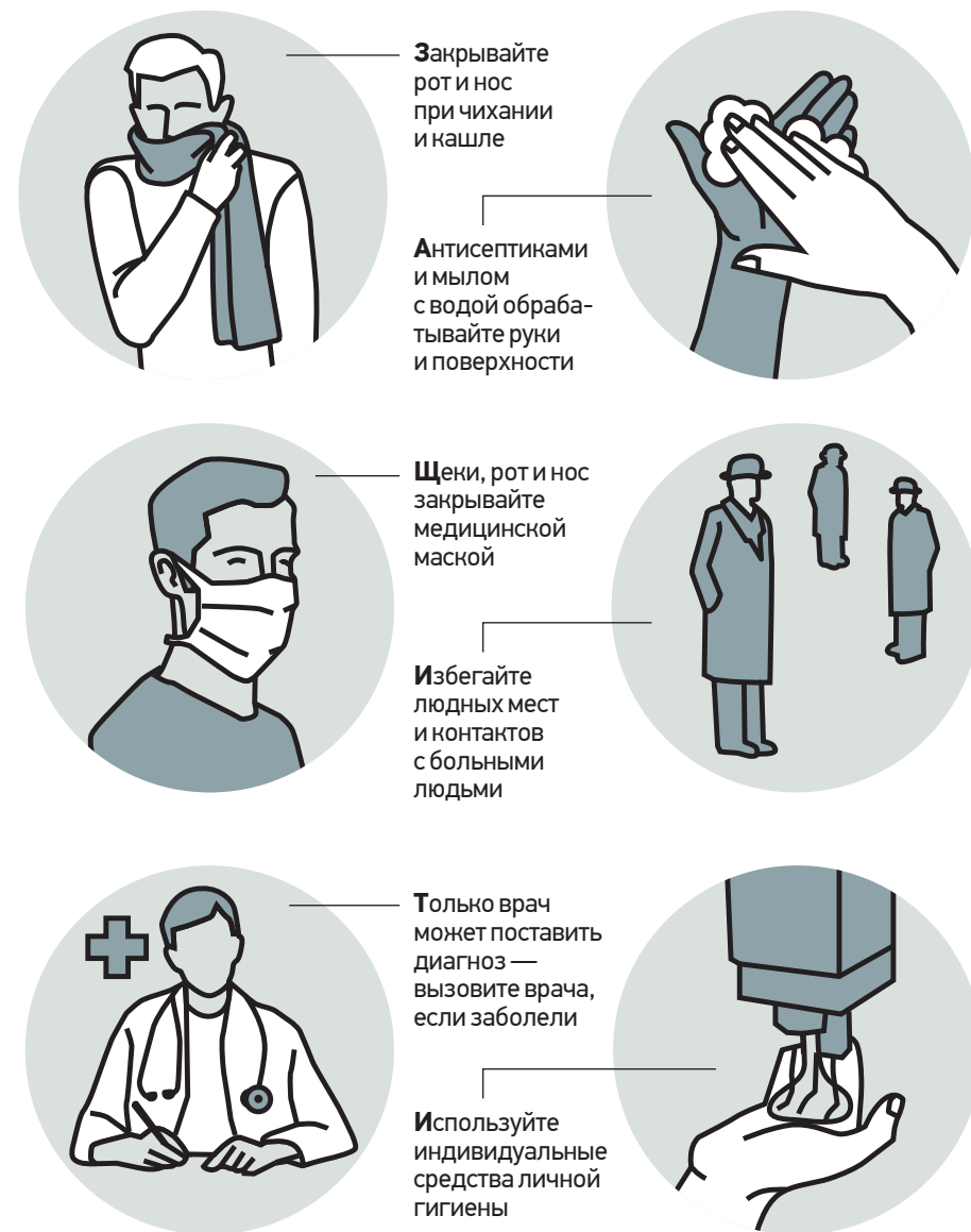
По данным Роспотребнадзора