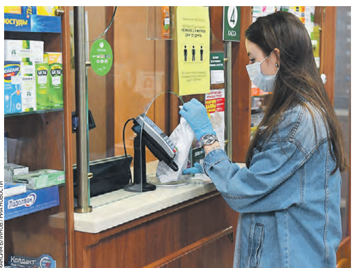
20 мая 2020 года. Покупательница в одной из столичных аптек забирает лекарства. Препараты для лечения от COVID-19 рекомендуют выбирать только по указанию врача

Вчера главный микробиолог Министерства здравоохранения России Роман Козлов предупредил соотечественников, что необоснованный прием антибиотиков при COVID-19 может ухудшить состояние пациента.