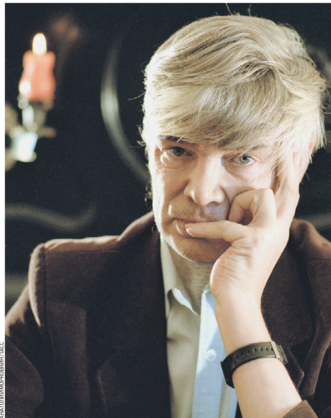
1988 год. Венедикт Ерофеев. За свою короткую жизнь он успел и глотнуть славы, и увидеть крах описанного им мира

Спустя годы после взрыва читательского внимания к этому произведению, пропетых критиками гимнов о его глубине и совершенстве приходится констатировать, что для исследователей бржежневской эпохи поэма «Москва — Петушки» интересна прежде всего как художественно выраженный советский интеллигент на глухой затор семидесятых. Многие об-