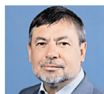
ПАВЕЛ ПОЖИГАЙЛО ЧЛЕН ОБЩЕСТВЕННОЙ ПАЛАТЫ РФ

что указания государства вредны и их можно обходить. По сути, это воспитание непокорных детей и будущих граждан. Поэтому существует вероятность, что вырастет поколение, которое будет плевать на свое государство.