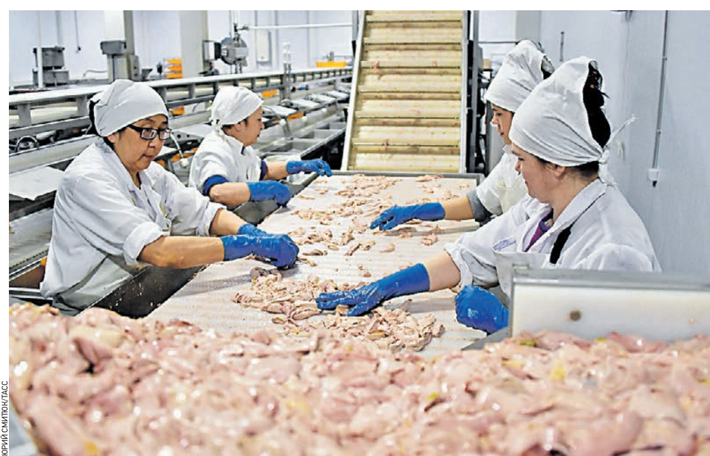
24 февраля 2020 года. Рыболовобработывающий завод «Камчаттралфлот» на Камчатке. Здесь тоже производят печень трески — полезный, но нуждающийся в контроле продукт

Росконтроль исследовал печень трески популярных брендов: «5 морей», «Морской котик», «Новый океан», «Боско-морепродукт» и «Беринг».