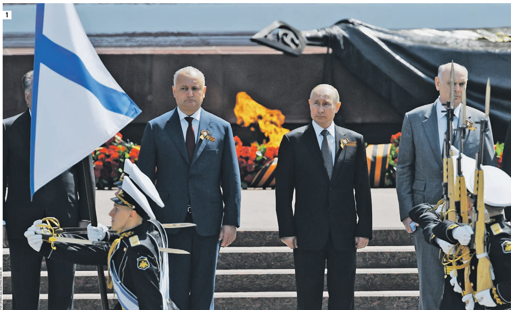
Вчера 11:28 (слева направо) Президент Молдавии Игорь Додон, президент России Владимир Путин и президент Абхазии Аслан Бжания на церемонии совместного возложения цветов к Могиле Неизвестного Солдата в Александровском саду (1) С трибуны за парадом Победы наблюдает мэр Москвы Сергей Собянин (2)

Военный парад в ознаменование 75-й годовщины Великой Победы прошел с размахом