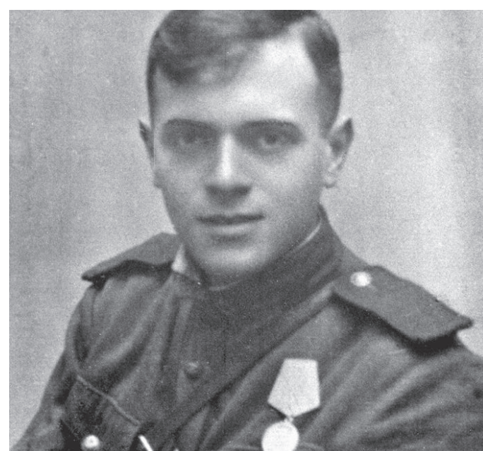
1943–1944 годы (точная дата неизвестна). Первой наградой Давида Самойлова стала медаль «За отвагу»

Завтра в Российском государственном архиве литературы и искусства откроется выставка «Война, беда, мечта и юность». Она построена на материалах из фонда поэта-фронтовика Давида Самойлова (1920–1990), 100-летие которого отмечается 1 июня.