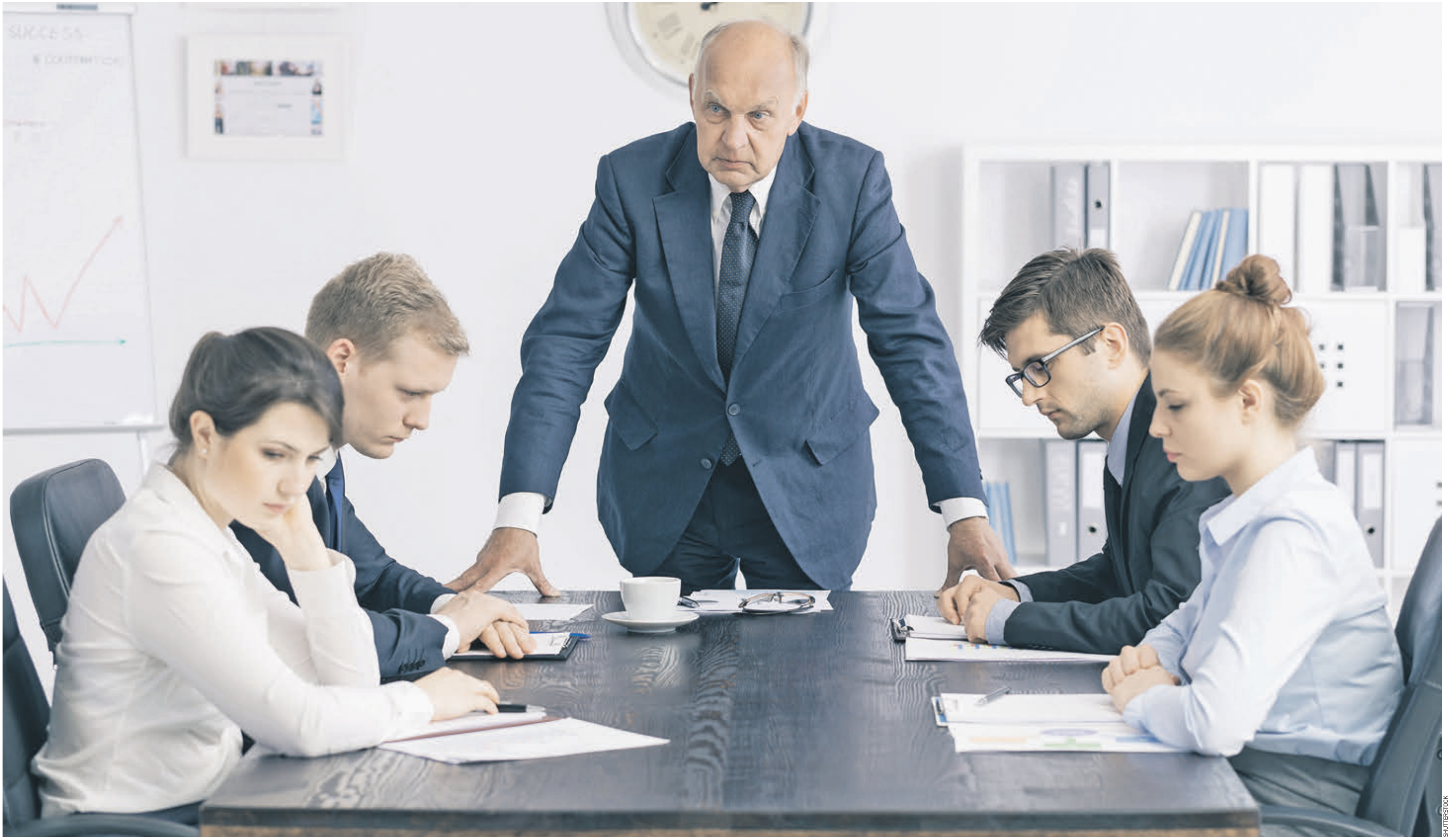
24 мая 2019 года. Совещание у руководителя в одном из московских офисов. Собрания нередко заканчиваются криком, потому что только крик заставляет сотрудников начать работу

В общении с подчиненными руководители все чаще применяют кнут. В чем дело?