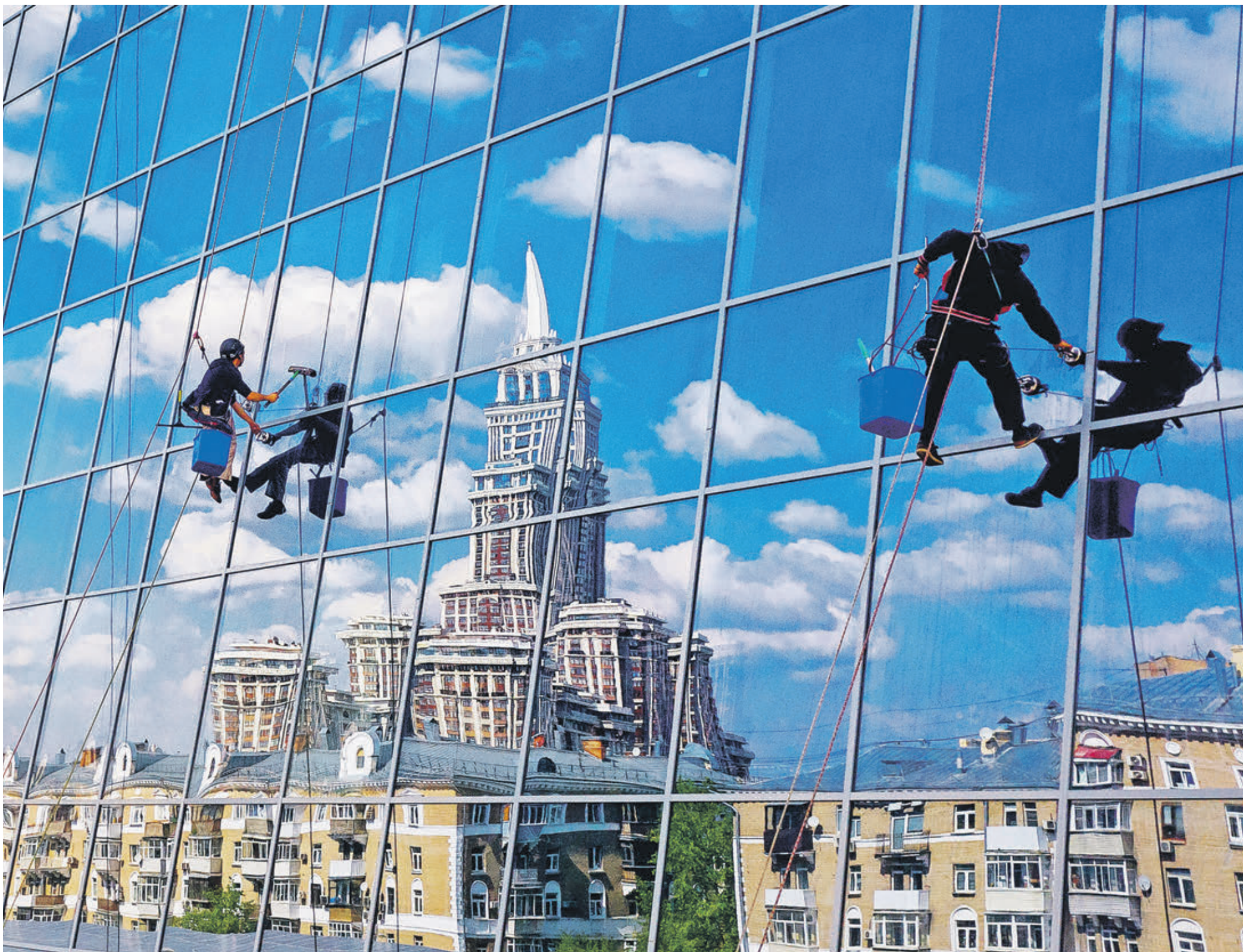
Вчера 12:52 Специалисты моют окна одного из зданий, рядом с которым находится небоскреб на Соколе. В стеклах отражается ситцевое небо, по которому плывут облака, и кажется, что оно нарисовано масляными красками