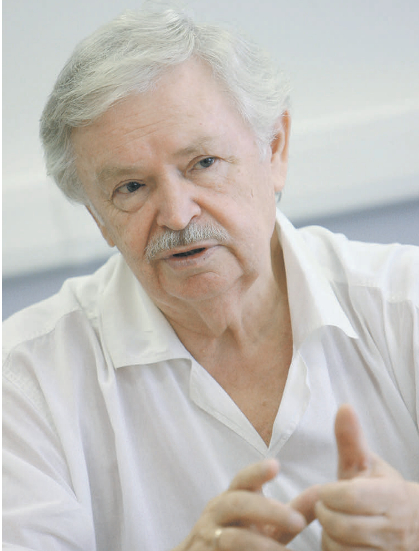
8 августа 2010 года. Председатель Российского детского фонда, писатель Альберт Лиханов

Вот мы и подошли, наверное, к самому главному: к вопросу, а зачем все это нужно. Дело в том, что сегодня есть многое, что нашу страну не только соединяет, но, увы, и разделяет. Глубокой тайны я, говоря это, безусловно, не открываю. Нетрудно заметить, что дети из стран СНГ теперь плохо знают русский язык. Есть и политические реалии, которые впадают ребенку иногда изрядно искаженную картину. Но, приезжая сюда, они чувствуют отношение к себе России и Москвы. И видят то, что, возможно, и я говорю это с глубокой горечью, не увидит больше никогда, ведь это дети из детских домов, детишки с инвалидностью, ребята из семей, которые проходят большие нравственные испытания. Поездка открывает им особый мир, ставит перед ними добрые цели.