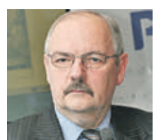
АНАТОЛИЙ ВАССЕРМАН журналист, публицист

С одной стороны, список научных специальностей разросся настолько, что никто не может все их обозреть. Если число специальностей сократится в пользу их объединения, то это разумно. Однако, если рассматривать конкретно инициативу ВАК сократить число специальностей именно в инженерной сфере, так как по ней защищают мало диссертаций, то я ее не поддерживаю. Данная сфера связана скорее не с наукой, а с практикой. Как известно, за годы реформ в нашей стране многие высокотехнологичные производства просто уничтожены. И сейчас мы по-прежнему восстанавливаем эту промышленность. Если резко закрыть специальности, относящиеся к высоким технологиям, то это затормозит развитие ряда наших производств, в том числе и в оборонной части.