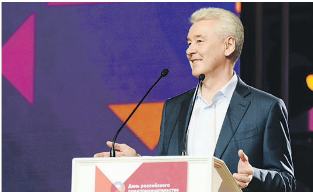
29 мая 19:17 Мэр Москвы Сергей Собянин поздравил предпринимателей с профессиональным праздником и вручил диплом обладателю Гран-при первой бизнес-премии «Прорыв года»

Город возможностей Чествование столичных предпринимателей прошло в концертном зале Государственного Кремлевского дворца.