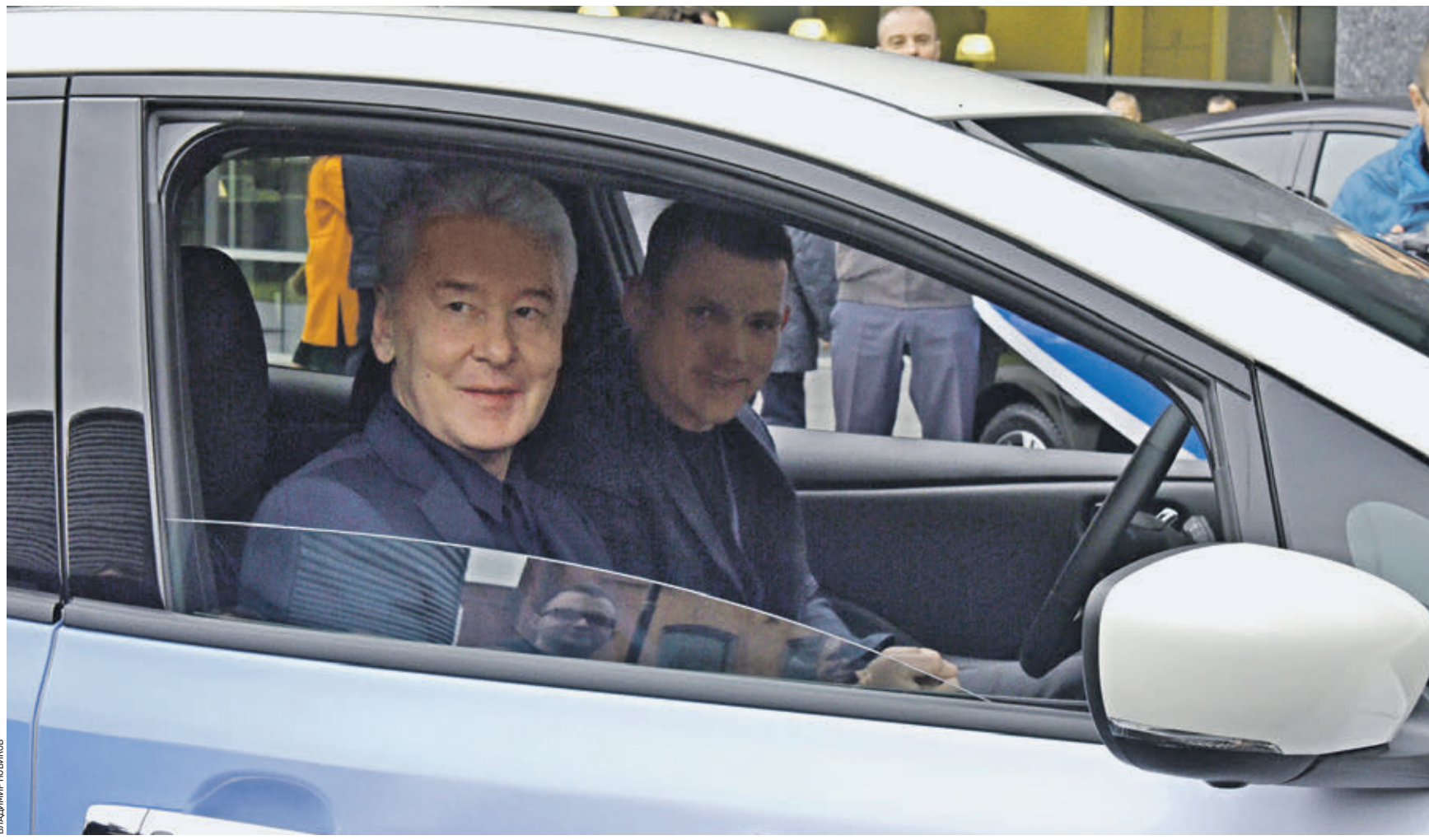
Вчера 13:11 Мэр Москвы Сергей Собянин (на первом плане) и гендиректор сервиса краткосрочной аренды автомобилей Антон Рязанов в новом электромобиле. Всего по городу будут курсировать 30 подобных машин

Москва стала первым городом в России, где появился каршеринг электромобилей. Со вчерашнего дня пользователям одного из популярных сервисов по краткосрочной аренде автомобилей доступны 30 электрокаров самой последней модификации. В отличие от обычных машин, которым нужно топливо, электрические экологичнее и удобнее в эксплуатации и почти бесшумны. — Для нас это эксперимент и одновременно шаг в будущее, — сказал гендиректор сервиса Антон Рязанов. — Мы верим, что в будущем парки каршеринга перейдут на электромобили, поэтому уже сейчас решили предложить своим пользователям брать в аренду экологичные машины. Новые автомобили доступны для водителей старше 26 лет и со стажем вождения от шести лет. Кроме того, сервис будет учитывать дополнительные факторы: например, как часто пользователь нарушает Правила дорожного движения. Ездить на электромобилях можно по всему городу и даже за его пределами, а вот вернуть — только в пределах