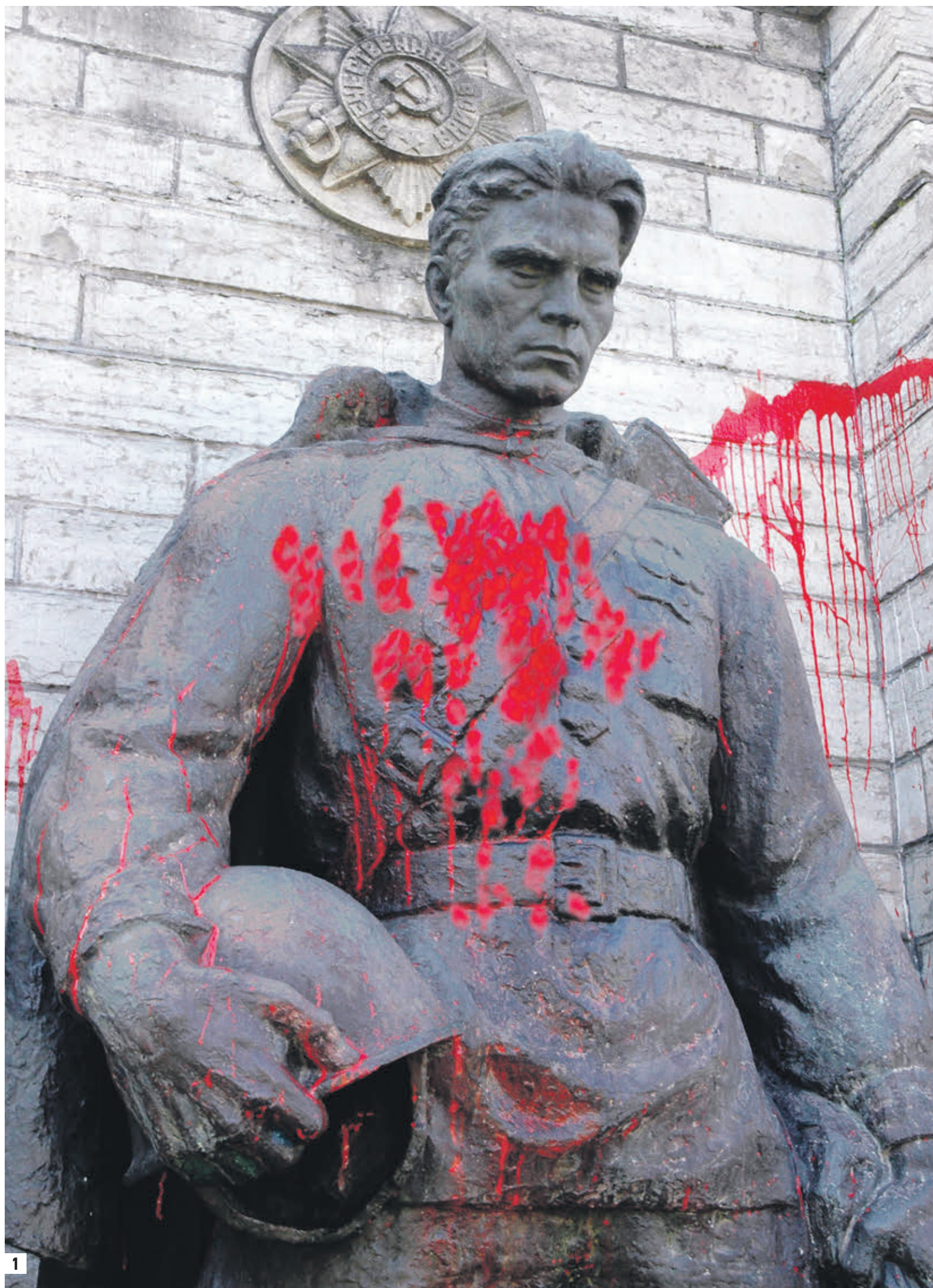
Памятник воинам в Таллине (1) Демонтаж памятника РККА в Варшаве (2) Защитники памятника РККА в Риге (3) Памятник маршалу Коневу в Праге (4)

Подходить к оценке исторических событий нужно с позиции адекватности