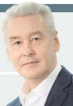
СЕРГЕЙ СОБЯНИН МЭР МОСКВЫ

Дорогие ветераны! Сердечно поздравляю вас с Днем старшего поколения.