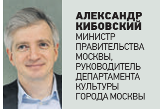
АЛЕКСАНДР КИБОВСКИЙ МИНИСТР ПРАВИТЕЛЬСТВА МОСКВЫ, РУКОВОДИТЕЛЬ ДЕПАРТАМЕНТА КУЛЬТУРЫ ГОРОДА МОСКВЫ

Фестиваль — отличная площадка и для начинающих специалистов. Это возможность познакомиться с профессионалами и приобрести новые знания. Хочется верить, что те образовательные встречи, которые включены в программу, будут полезны москвичам и гостям столицы.