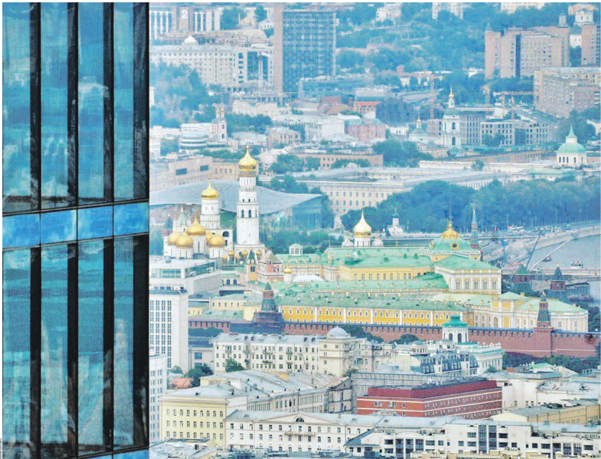
22 августа 13:07 Любуясь башнями и куполами Московского Кремля со смотровой площадки «Москвы-Сити», особенно остро осознаешь, как тесно в нашем городе переплелись история и современность