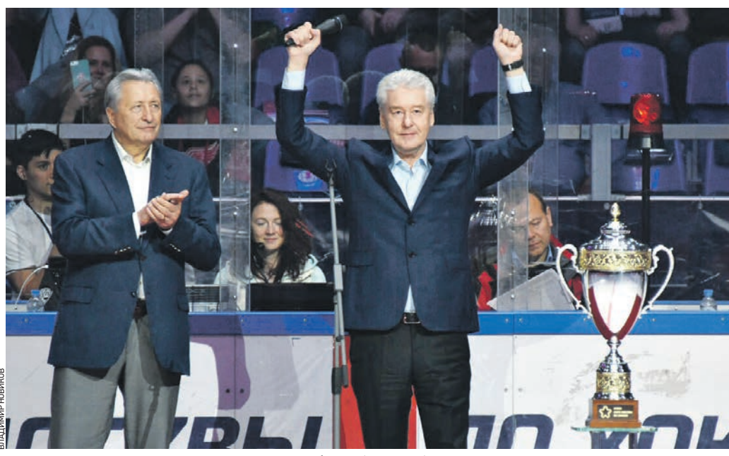
Вчера 19:12 Мэр Москвы Сергей Собянин (в центре) и советский хоккеист и тренер Александр Якушев перед открытием Кубка Мэра Москвы по хоккею