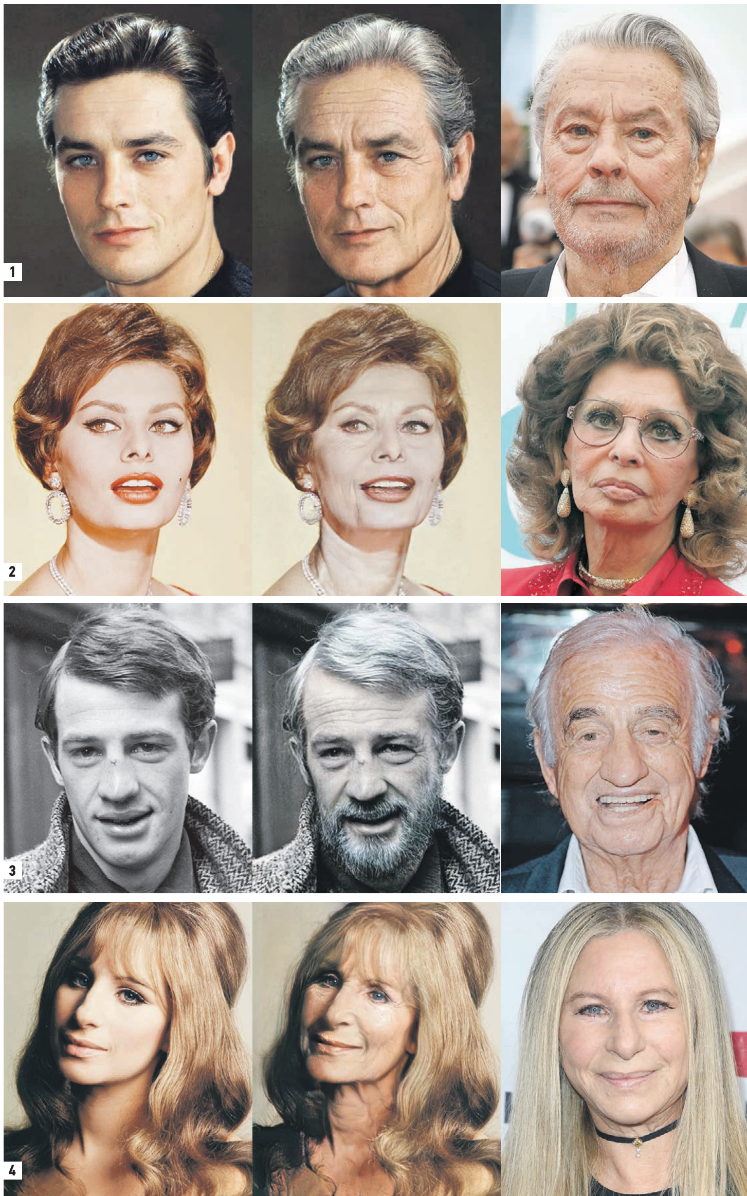
Чтобы посмотреть, «как это работает», мы решили сравнить результат «искусственного», «программного» старения со, скажем так, естественным ходом истории. И вот что получилось. Перед вами знаменитый актер Ален Делон: в молодости, состаренный программой и в реальности, в этом году (1). Актриса Софи Лорен: в молодости, состаренная FaceApp и в настоящее время (2018 год) (2). Актер Жан Поль Бельмондо: в молодости, состаренный программой, в реальности — в 2018 году (3). Актриса и певица Барбра Стрейзанд в молодости, состаренная FaceApp и в 2019 году (4)