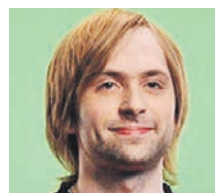
ЯРОСЛАВ КУЗНЕЦОВ КИБЕРСПОРТСМЕН, БЫВШИЙ КАПИТАН КОМАНДЫ VIRTUS.PRO

и школьного спорта. На данный момент эти тенденции находятся в начальной стадии, сложно прогнозировать, какое развитие они получат. Геймификация как технология и методика в перспективе обязательно будет влиять на процессы обучения. Но необходим отбор игр. Не все из них подходят для подобных уроков. Все же это часть образовательного процесса, поэтому выбранные игры должны развивать в ребенке полезные качества.