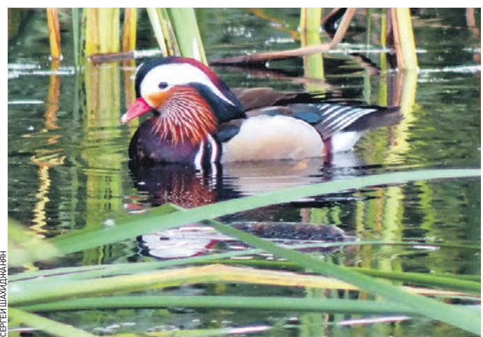
25 июля 15:12 Утка-мандаринка, обитающая на Большом Дворцовом пруду, — птица для Москвы редкая