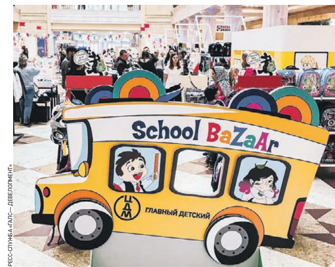
16 августа 13:35 В атриуме Центрального Детского магазина на Лубянке продолжает работу школьная ярмарка

А здесь есть все, что необходимо школяру: в главном атриуме торгово-развлекательного центра, где раскинулась ярмарка, представлено более 20 брендов детской одежды, обуви, канцелярские принадлежности и товары для творчества. — В главном атриуме покупатели смогут найти продукцию не только ведущих производителей, но и молодых прогрессивных брендов, которые создают актуальные школьные коллекции. Одновременно мы открыли новые магазины, которые порадуют родителей широким выбором