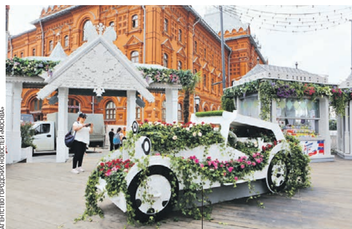
Украшенные цветами и арт-объектами, 14 фестивальных площадок ждут гостей, чтобы ярко и интересно отметить праздник.

Специальные мероприятия, посвященные Дню российского флага, ждут в эти дни посетители фестиваля «Цветочный джем».