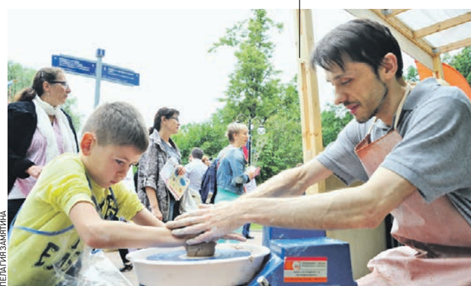
Желающих обучат гончарному мастерству.