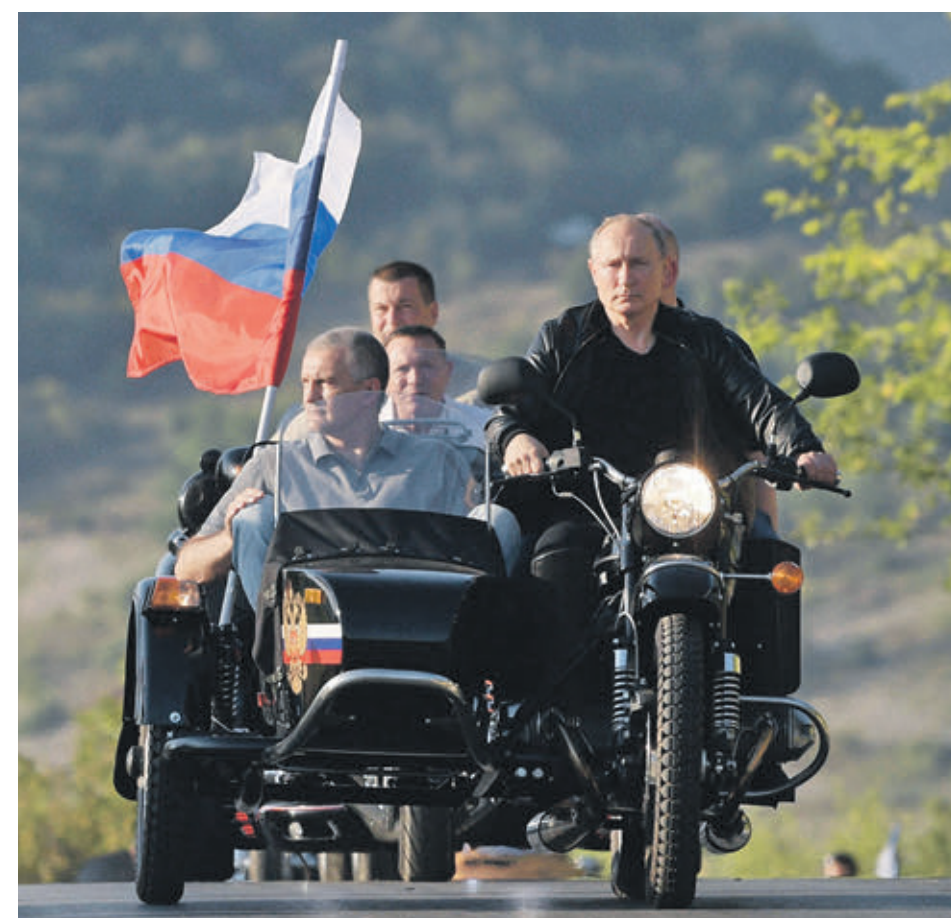
10 августа. Владимир Путин прибыл на мотоцикле «Урал» на байк-шоу «Тень Вавилона» в Севастополе. Глава государства подъехал к сцене и выступил с приветственной речью. Президента сопровождал руководитель Республики Крым Сергей Аксенов (в коляске). Шоу, организованное мото клубом «Ночные волки», проводится на полуострове в 11-й раз.