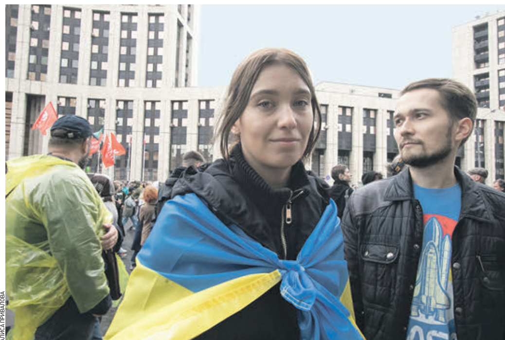
10 августа 15:48 Одна из участниц акции повязала на плечи украинский флаг. К теме митинга это никакого отношения не имеет, зато служит хорошей иллюстрацией к «оранжевым технологиям», которые используют организаторы подобных акций