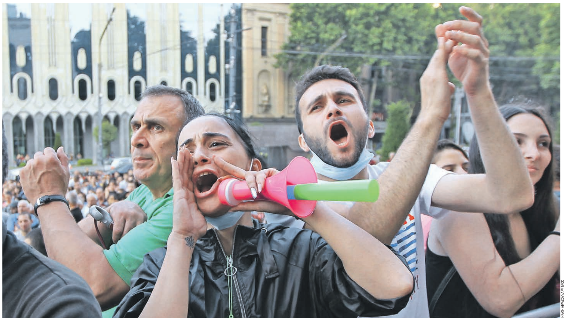
24 июня. Демонстранты в столице Грузии требуют отставки министра внутренних дел Георгия Гахарии, наказания полицейских, разогнавших акцию протеста 20 июня, и проведения досрочных выборов в парламент

У нас есть все равно будут туда ездить. Особенно те, кто поддерживает антироссийские санкции. Еще и шашлыкком их бесплатно накормят.