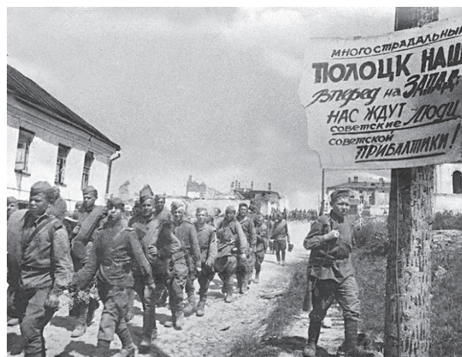
Июль 1944 года. Советские войска проходят через освобожденный Полоцк. В ходе Полоцкой операции было захвачено более 7 тысяч солдат и офицеров противника.

Вчера в Музее Победы в честь 75-летия освобождения Белоруссии открылась выставка «Операция «Багратион». Разгром».