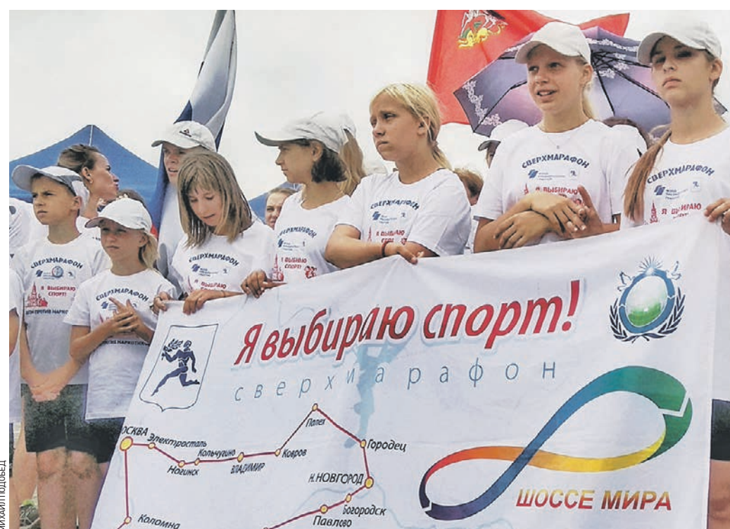
Вчера 12:22 Участники сверхмарафона «Дети против наркотиков — я выбираю спорт!» демонстрируют схему своего международного забега

Не остались в стороне и медики и психологи, которые в специальных палатках проверяли здоровье всех желающих и рассказывали о том, какой вред способны нанести организму наркотические вещества и насколько тяжело для тела и рассудка отказываться от их употребления. — Мы должны выбирать здоровую жизнь, так как именно от нас зависит будущее Рос-