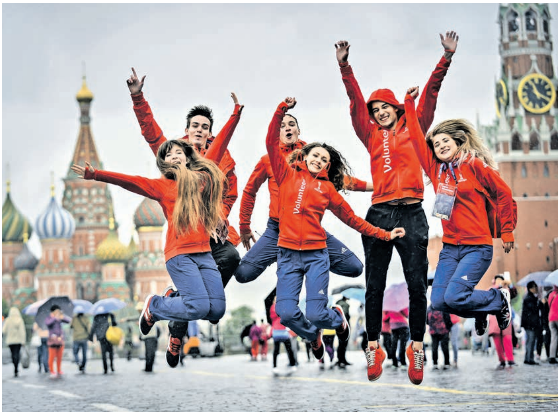
15 июня 2017 года, Красная площадь. Добровольцы из числа московских студентов, помогающие проводить Кубок конфедераций в Москве. Событийное волонтерство в столице становится все более популярным

Почему добровольческое движение в столице становится все более массовым