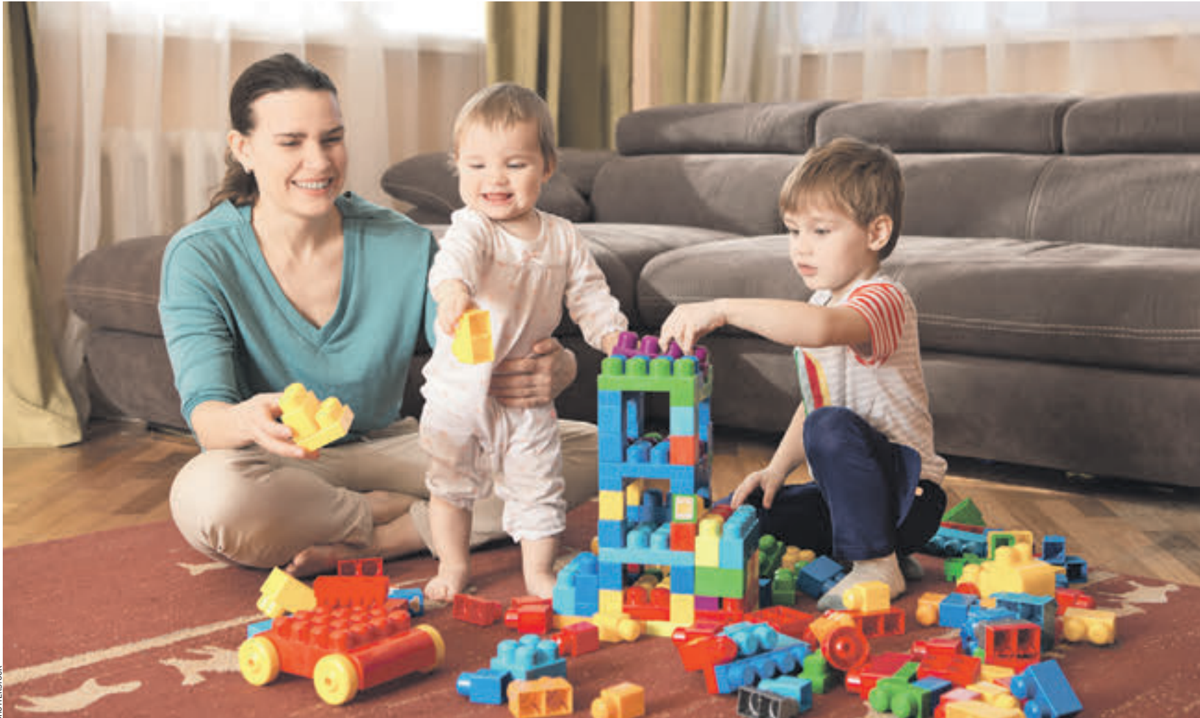
Няня играет с детьми в одной из столичных семей. Сегодня большинство профессиональных нянь не платит налогов, но при этом пользуется бесплатным образованием, медицинским обеспечением, пенсией. Теперь всем самозанятым гражданам предлагается покупать патент

Комитет Совета Федерации по бюджету и финансовым рынкам подготовил изменения в Налоговый кодекс. И даже передал их на рассмотрение в правительство. — Суть изменений в том, что для самозанятых предлагается ввести патентную систему, — заявил председатель комитета Совфеда Сергей Рябухин. — Предложения прежде всего касаются тех категорий самозанятых, что получили так называемые налоговые каникулы на два года. Напомним, в прошлом году благодаря изменениям в Налоговый кодекс некоторые категории россиян освободили от налога на доходы физических лиц на два года. Речь идет о репетиторах, нянях, сиделках и домработницах. По истечении двух лет они должны определиться со своим дальнейшим статусом — станут ли они ИП (индивидуальными предпринимателями) либо оформят свои отношения с работодателями в соответствии с Трудовым кодексом. — Мы же предлагаем еще более простой механизм: покупку патента, — пояснил Рябухин. — С одной стороны, не стоит загонять людей в жесткие рамки. С другой стороны, самозанятые должны начать осознавать свою ответственность перед государством. Юрий Алтухин, кандидат социологических наук, ведущий научный сотрудник Института