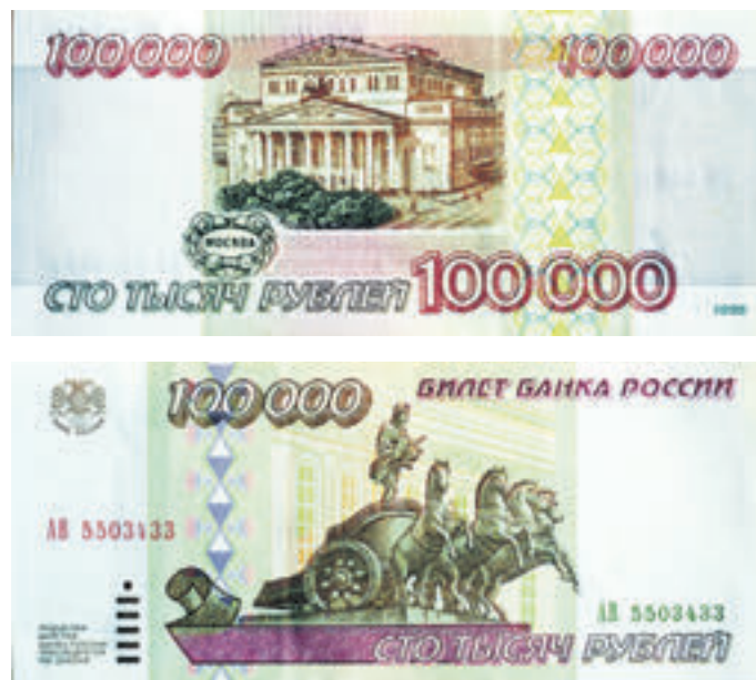
Двухсторонний образец купюры номиналом в сто тысяч рублей, выпущенной 30 мая 1995 года