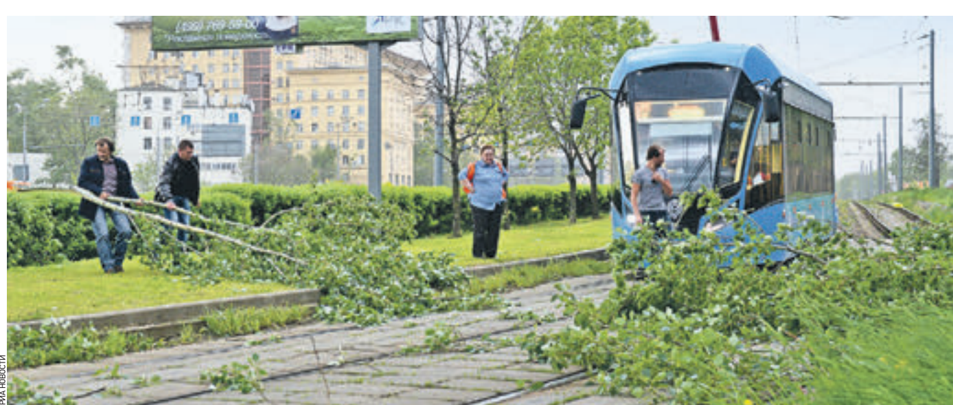
Вчера 18:08 Рабочие убирают упавшие ветки с трамвайных путей. После прошедшего урагана было повалено несколько сотен деревьев по всему городу

В городе в круглосуточном режиме дежурит 368 аварийных бригад — это 1104 человека и 285 единиц техники, в том числе — специальной. По состоянию на 17:00 заявок о подтоплениях в диспетчерскую службу предприятия не поступало. А когда заявки поступают, диспетчеры направляют на место происшествия ближайшую бригаду.