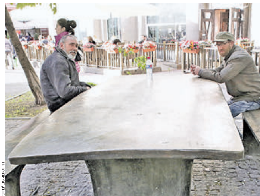
Вчера 12:30 Стол и лавочки около памятника Булату Окуджаве на Арбате постоянно оккупированы бездомными