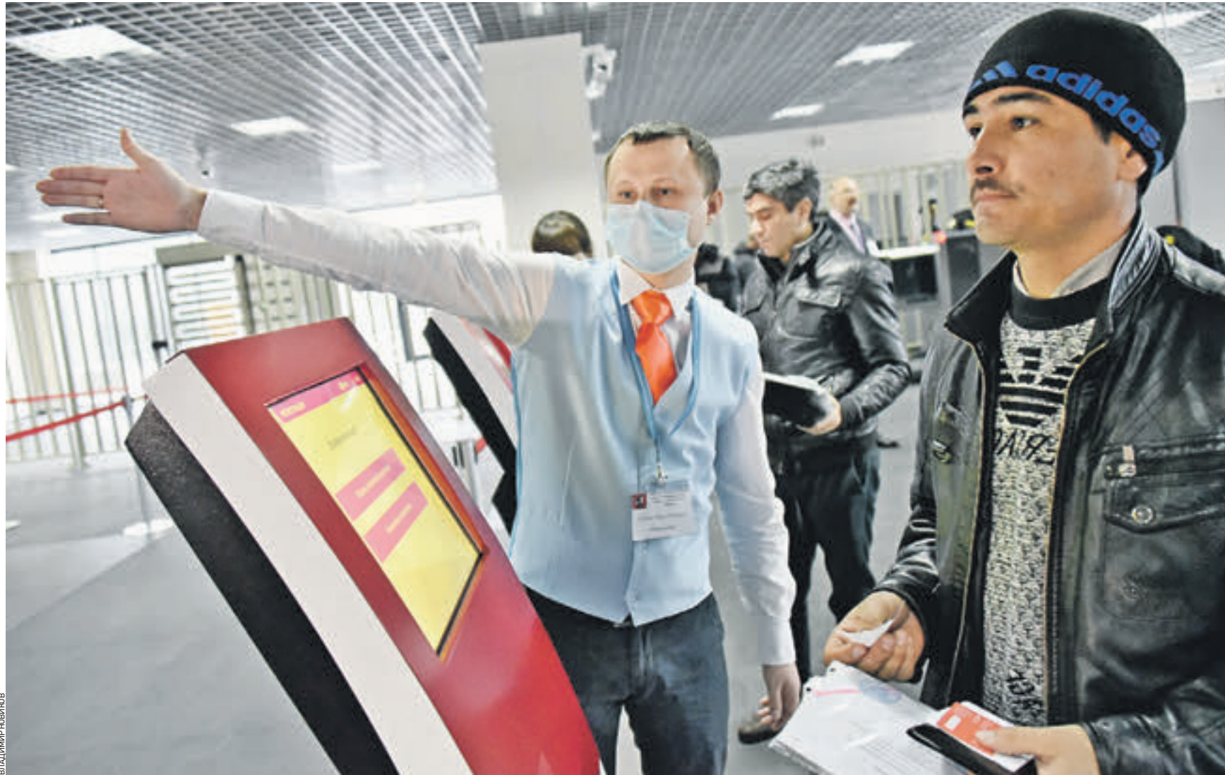
29 января 2016 года 10:42 Один из обычных рабочих дней в Многофункциональном миграционном центре, который расположен в Сахарове. Миграционный центр — единственная организация в Москве, на территории которой проводится оформление и выдача патентов иностранным гражданам на работу в столице