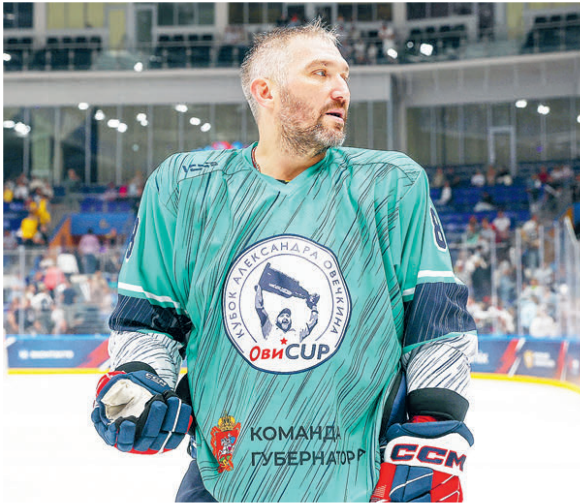
Александр Овечкин скоро догонит Уэйна Гретцки в гонке бомбардиров НХЛ. А в Милан со сборной поедет?

Что это значит? С 1 февраля Федерация фигурного катания на коньках России (ФФККР) и Союз конькобежцев России (СКР) могут представлять по одному спортсмену в каждом виде программы в фигурном катании, конькобежном спорте и шорт-треке. При этом наши фигуристы не допущены к командному турниру, а вот насчет запрета на выступление российских конькобежцев в командной гонке и эстафете в шорт-треке ISU не