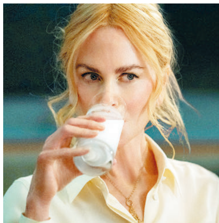
ФОТО ИЗОБРАЖЕНИЙ ИСТОЧНИКОВ

Во второй половине фильма «Плохая девочка» вместо за-