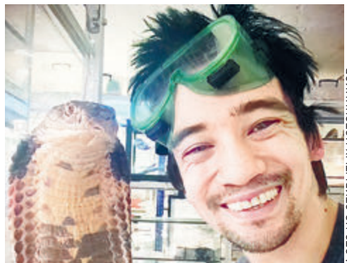
Погибший от укуса змеи в 2017 году петербургский зоолог и блогер Арслан Валеев.

– Живущие в террариумах, особенно кобры, прекрасно отличают хозяина, который их кормит и поит, от любого другого человека.