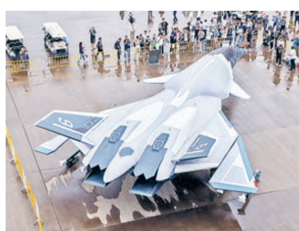
Тот самый «Белый император».

А пока что в небо взмыл китайский боевой самолет шестого поколения со звучным названием «Белый император», который, судя по всему, будет гиперзвуковым. Эту версию подкрепляет информация о том, что китайские ученые анонсировали революционный проект двигателя RRDE (ram-