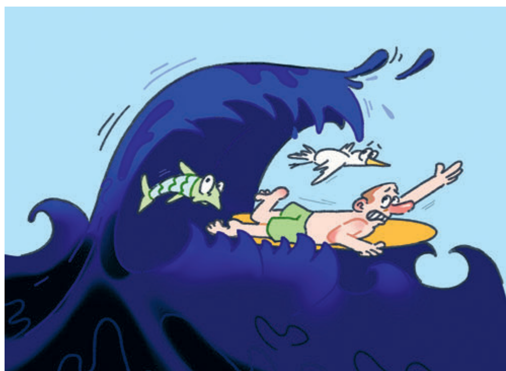
ИЛЛЮСТРАЦИЯ НАСТАСИИ КОВАЛЕВСКОЙ