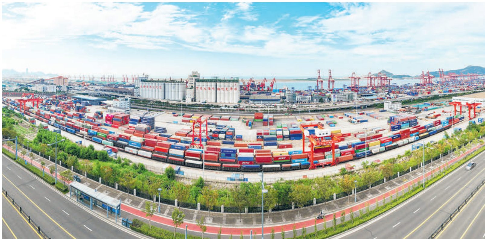
Китайско-казахстанская логистическая база в городе Ляньюньган (провинция Цзянсу, Восточный Китай).

В 2024 году Китай подписал документы о сотрудничестве по совместному строительству инициативы «Один пояс, один путь» с несколькими странами, включая Египет, Восточный Ти-