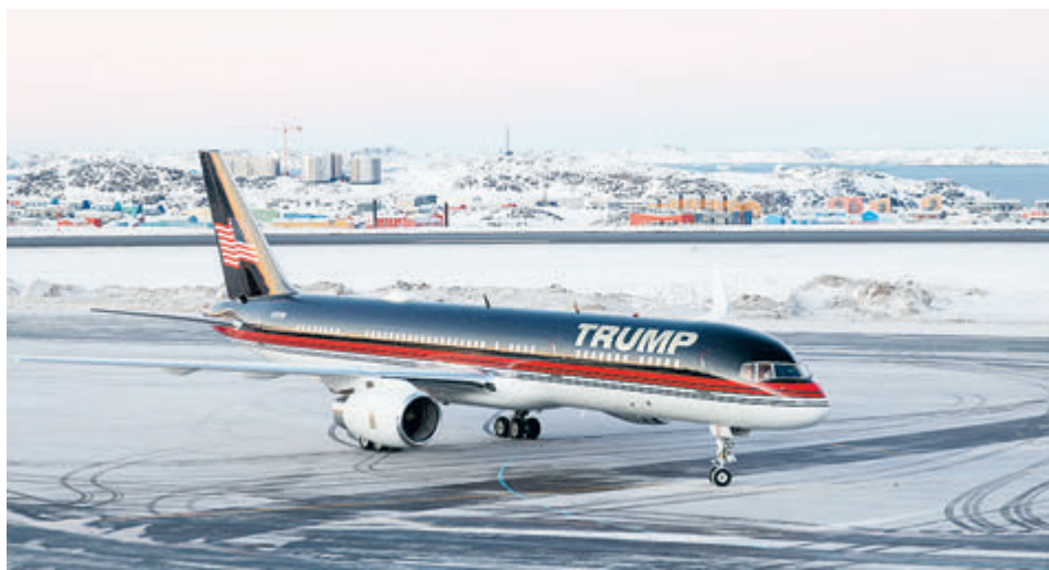
7 января в Гренландии приземлился личный самолет избранного президента с Дональдом Трампом – младшим на борту.

То что? Кто сильнее, тот и прав? Похоже, именно на такой нехитрой философии зиждется ныне мировой порядок. Но для начала нелишне будет понять, для чего эта пустынная и безлюдная земля, ледяное пространство понадобилось далекой Америке. США не в первый раз замахиваются на владение огромной северной территорией, откуда можно