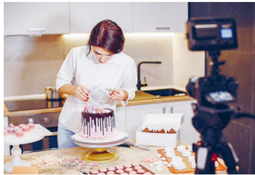
Готовим торт на дому в режиме онлайн. Дорого, но вкусно.

Напомним: для назначения страховой пенсии по старости в России