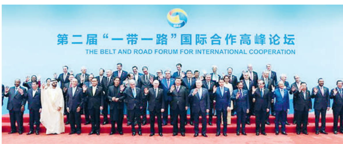
Лидеры стран мира на форуме «Один пояс, один путь» в Пекине в 2023 году.

Более 150 стран и более 30 международных организаций подписали документы о сотрудничестве в рамках «Одного пояса, одного пути», реализованы тысячи совместных проектов