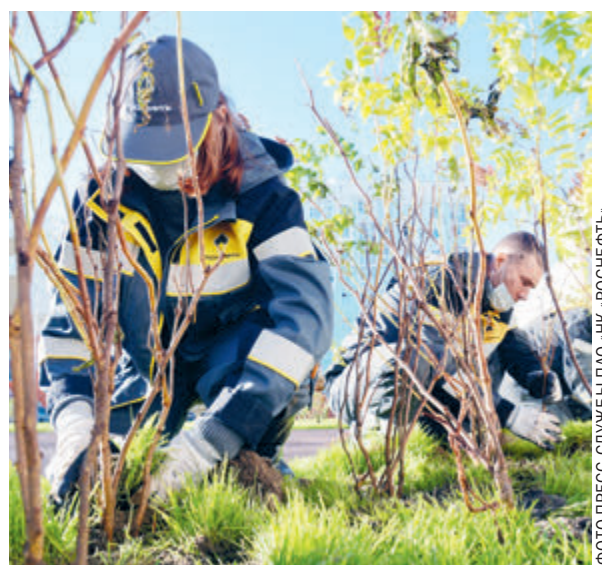
Сотрудники дочерних обществ «Роснефти» высадили около 4 млн саженцев и деревьев в первом полугодии 2021 года.