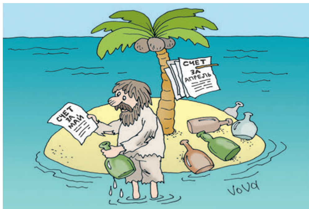
ИЛЛЮСТРАЦИЯ ВЛАДИМИРА ИВАНОВА / CARTOONBANK.RU

На ЖКХ жалуются все и на все: от непомерных тарифов и отвратительного качества услуг до из рук вон плохого состояния жилого фонда и никудышного управления сферой ЖКХ. Причем многие коммунальные беды тянутся еще из прошлого и даже позапрошлого веков. Европейцы поражаются: как население богатейшей страны терпит пещерные условия проживания в бараках без нормального водопровода (в 83 российских регионах более 11 млн человек не обеспечены качественной питьевой водой), без канализации (около 22,6% населения пользуется «удобствами на улице» и выгребными ямами). И это при русских морозах!