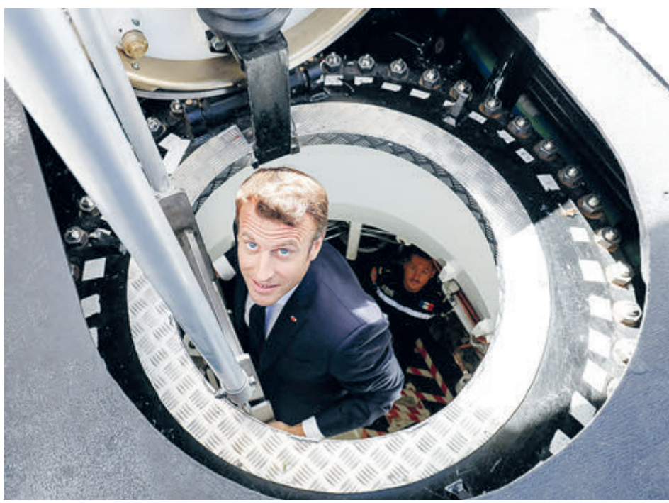
Макрон: куда бы деться с подводной лодки?

И Париж задохнулся от злости. Спустя 48 часов после аннулирования в пользу США соглашения на поставку французских подлодок Париж отозвал своих послов из Вашингтона и Канберры для консультации. Глава МИД Франции Жан-Ив Ле Дриан не выдерживал: «В этой истории проявились двуличие, презрение и ложь. В отношениях с союзником так себя не ведут. Это нож в спину». По его мнению, у Франции есть основания задать себе вопрос «о надежности союзнических отношений с США». Поскольку англосаксы поставили себя на ступеньку выше остального Запада, заключив про-