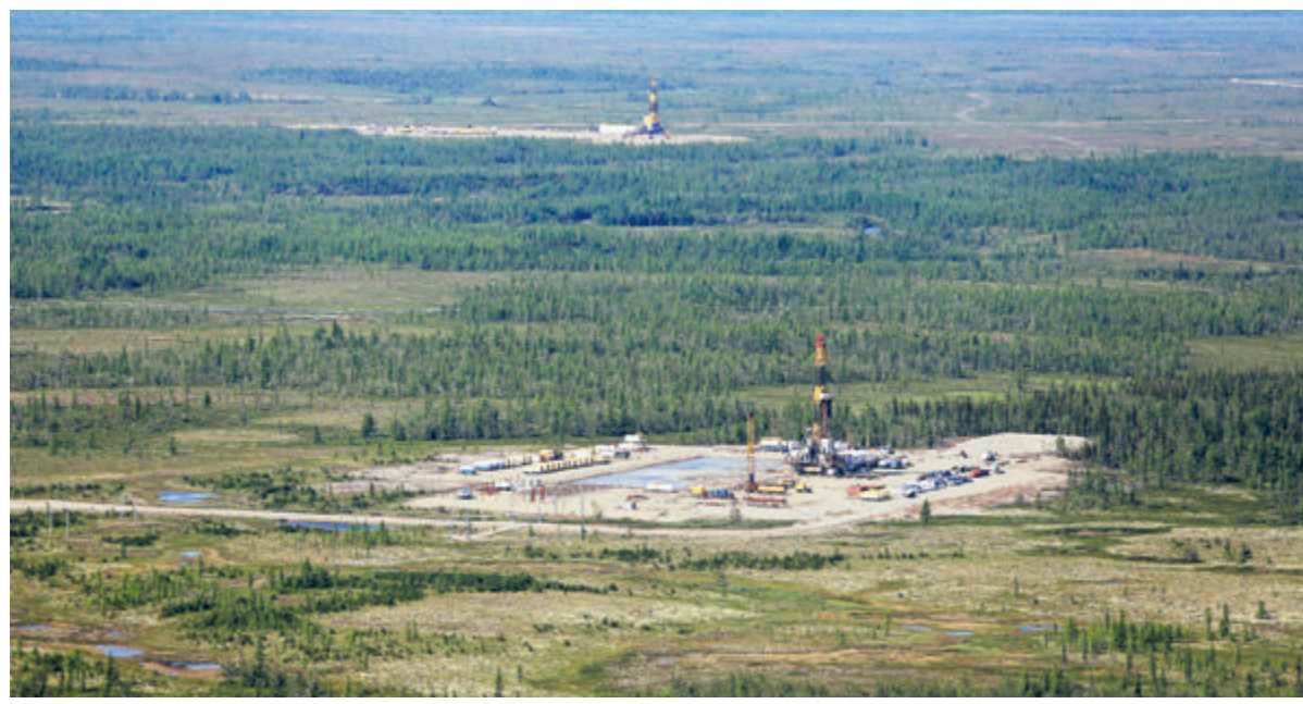
Углеродный след «Восток Ойла» на 75% ниже, чем у других новых крупных нефтяных проектов в мире.

Углеродный менеджмент – не просто слова для компании. Еще в конце 2020 года «Роснефть» представила свой план по контролю над выбросами до 2035 года, став первой компанией в стране, кто установил четкие долгосрочные цели в этом направлении. План предусматривает предотвращение выбросов парниковых газов в объеме 20 млн тонн CO 2 -эквивалента, сокращение интенсивности выбросов в нефтегазодобыче на 30%, достижение