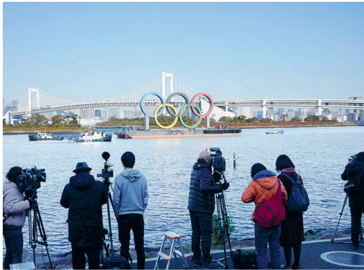
В Токио вернулись пять олимпийских колец. Вторая попытка напомнить миру: Олимпийские игры будут обязательно, хотя бы с опозданием на год.

Но в марте 2021 года уже начинается отборочный турнир к чемпионату мира. То есть еще до начала чемпионата континентальные европейские сборные вынуждены будут провести по три отборочных матча к ЧМ-2022. Сборная России 24 марта играет с Мальтой в гостях, 27 марта – со Словенией дома и 30 марта – в Словакии. Таким образом, уже ранней весной у наших ведущих футболистов будет рекордно плотный календарь. И уже возникают опасения на сей счет. Но не стоит забывать, что у наших соперников (ну кроме разве что мальтийцев) календарь будет куда плотнее нашего. Половина словенцев и словаков, а у хорватов три четверти состава сборной будут еще играть и в еврокубках, тогда как у нас в весеннюю стадию пробилась лишь краснодарцы.