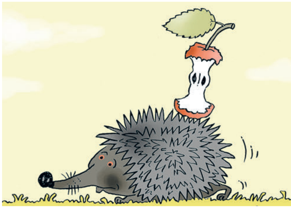
ИЛЛЮСТРАЦИЯ ВАСИЛИЯ АЛЕКСАНДРОВИЧА КАРТОНОВИЧУ

Чтобы оценить трагичность ситуации, представьте, что аналогичные команды сейчас отдаст в Берлине Ангела Меркель, в Париже – Эмманюэль Макрон, в Лондоне – Борис Джонсон. Ну а за океаном напоследок веселит публику Трамп. Смешно? Да как-то не очень. Добавим для ясности: два этих продукта, попавших на язык начальства, в нашей стране выпускаются более чем достаточно – и для внутреннего потребления, и для продажи. В частности, среди мировых экспортеров подсолнечного масла Россия уверенно держит второе место (23% рынка), отправив за рубеж в январе – июле 2,4 млн тонн. Это почти в 20 раз больше, чем Германия производит в год (около 130 тысяч тонн). Но на