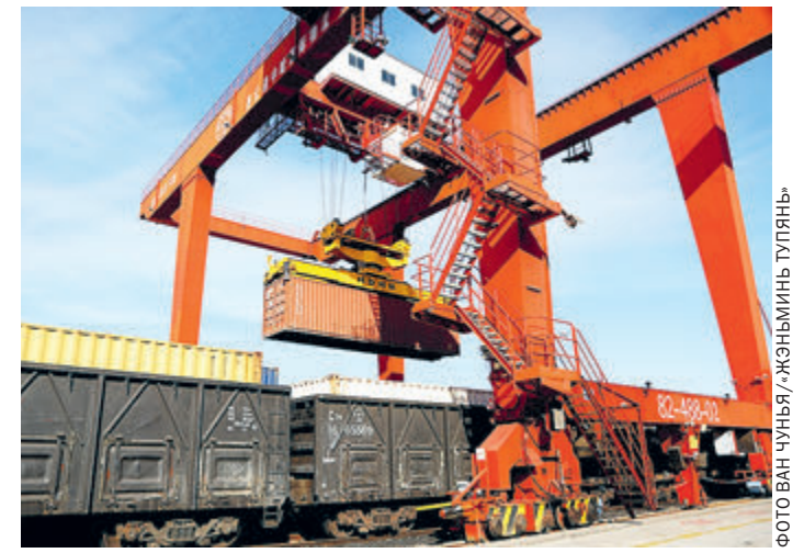
8 декабря на логистической базе в Ляньюньган провинции Цзянсу загружаются контейнеры для отправки в Казахстан.