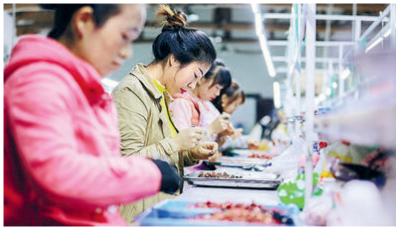
В сельской мастерской в провинции Гуйчжоу изготавливают электронные компоненты, которые напрямую продаются предприятию в городе Гуанчжоу.