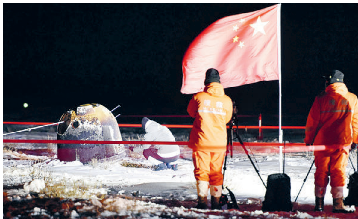
16 декабря. Лунный грунт доставлен на Землю. Еще один шаг в осуществлении китайской миссии на Луне сделан.

Китайская миссия – это, по сути, репетиция пилотируемого полета на Луну, который китайцы планируют совершить в ближайшие годы. И даже если американцам удастся реализовать намеченный на 2021-й полет к Луне, то они окажутся там в китайской компании: на спутнике Земли функционирует «Чанъэ-4» – луноход и спускаемый модуль. Чуть менее двух лет назад Китай, новичок в проведении дальнекосмических миссий, совершил то, чего раньше не делала ни одна другая страна: 3 января 2019 года Поднебесная высадила на обратной стороне Луны посадочный аппарат с roverом на борту. Миссия «Чанъэ-4» функционирует до сих пор: луноход «Юйту-2» прокопал по лунной поверхности более 500 метров, передав на Землю уникальные данные о геологии и окружающей среде обратной стороны Луны.