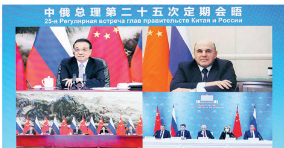
Ли Кэцян и Михаил Мишустин во время проведения 25-й регулярной встречи глав правительств Китая и России.

Ли Кэцян отметил, что в этом году председатель КНР Си Цзиньпин неоднократно общался по телефону с президентом России Владимиром Путиным, направляя ход дальнейшего развития межгосударственных отношений на высоком уровне. В условиях серьезного спада в мировой экономике, а также падения объемов мировой торговли и инвестиций темпы сотрудничества между двумя странами отнюдь не замедлились. Во многих областях был достигнут новый прогресс: повышается интенсивность торговли, бурно развиваются новые форматы бизнеса, включая трансграничную электронную коммерцию, последовательно развиваются крупные стратегические проекты, в том числе в сфере энергетики. Программа сотрудничества на Дальнем Востоке и межрегиональные контакты приносят новые результаты, в полной мере продемонстрировав высокий уровень взаимодополняемости и огромный потенциал двустороннего сотрудничества. Глава китайского