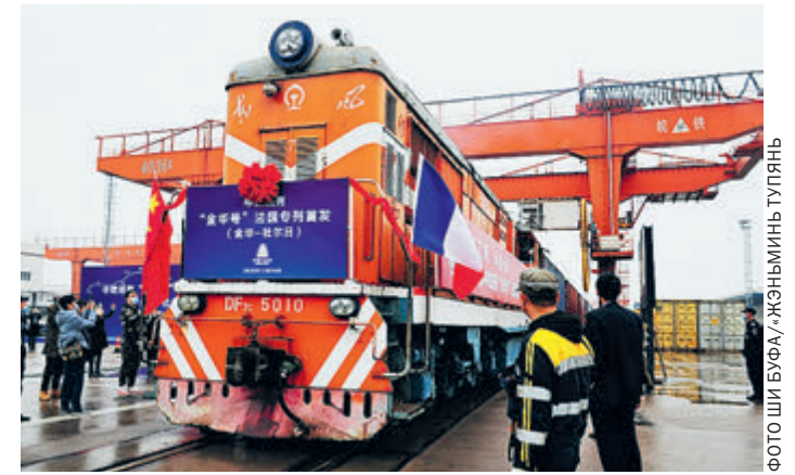
26 ноября из города Цзиньхуа провинции Чжэцзян во Францию успешно отправился первый поезд «Цзиньхуа» в рамках маршрутов Китай – Европа.

В этом году поезда по маршрутам Китай – Европа в общей сложности перевезли около 8 млн медицинских товаров объемом более 60 тысяч тонн. Поезда один за другим доставляют противозидемические средства и другие материальные ресурсы в страны вдоль «Одного пояса, одного пути». Эти маршруты стали «коридорами жизни» для разных государств в совместной борьбе с эпидемией.