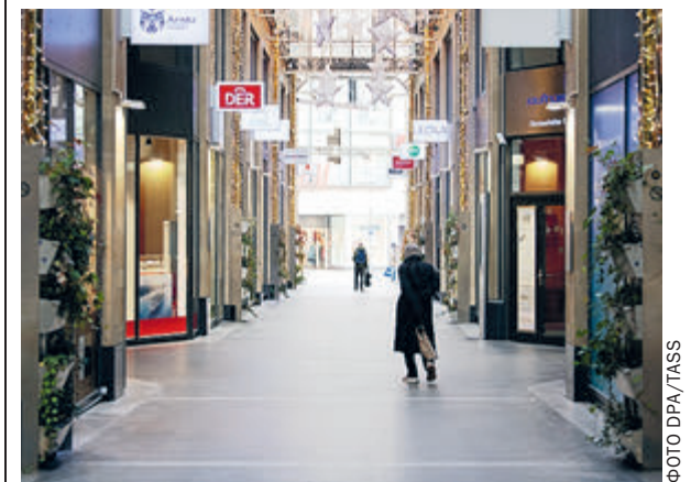
Мюнхен, рождественская распродажа. Еще в прошлом году здесь были толпы...

В Европе уже переделались улицы городов, нарядно украшены витрины, стоят елки у муниципалитетов, вывесили меню в ресторанах. Все судорожно доделывают незаконченные дела и прикидывают, с кем и где отмечать это странное Рождество. Есть над чем поразмыслить. Как говорят итальянцы, «Рождество празднуй со своими, Пасху – с кем захочешь!». Вот только средиземноморская традиция включает в число «своих» не только жену и детей, но и братьев, сестер, родителей, дедушек с бабушками, дядей с тетями и племянниками... На Кипре один знакомый мне долго объяснял это, загибая пальцы. Выяснилось, его семья в сочельник – это минимум полсотни человек. Но даже на острове теперь запрещено собирать дома более 10 человек, рестораны закрыты, бары работают только навынос. Ночного загула и танцев не предвидится. В католической Польше можно уссесться за праздничным столом лишь влятером, в Бельгии вообще больше двух не собираться.