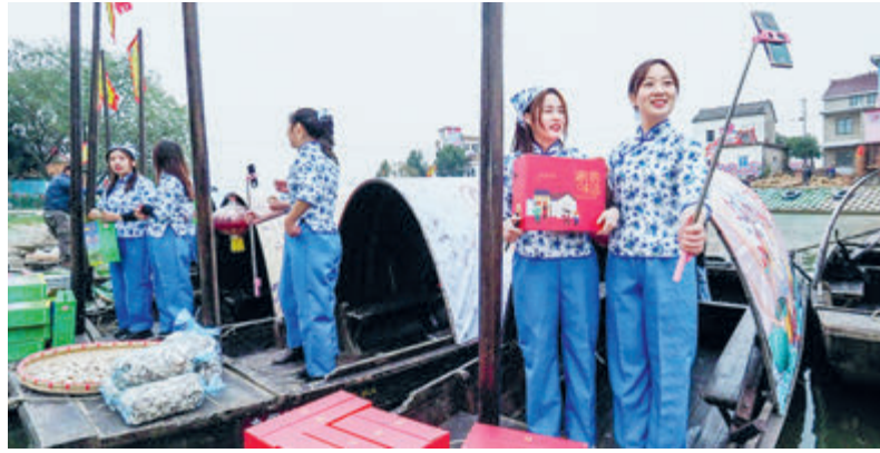
Сельчане провинции Аньхой зарабатывают на продаже их продукции через онлайн-трансляции.