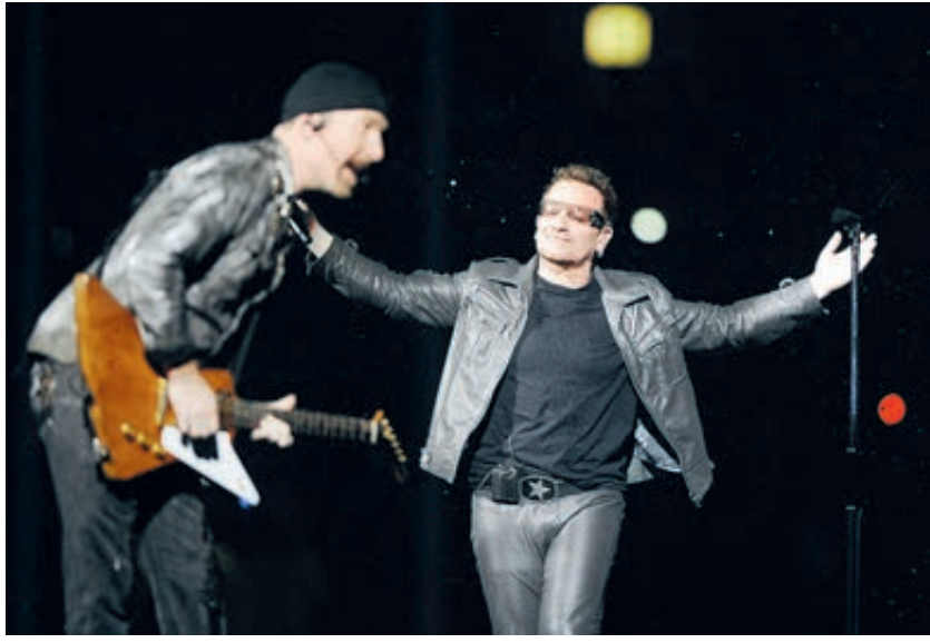
U2 сыграла в Москве один раз почти 10 лет назад и снова в гости не собирается.