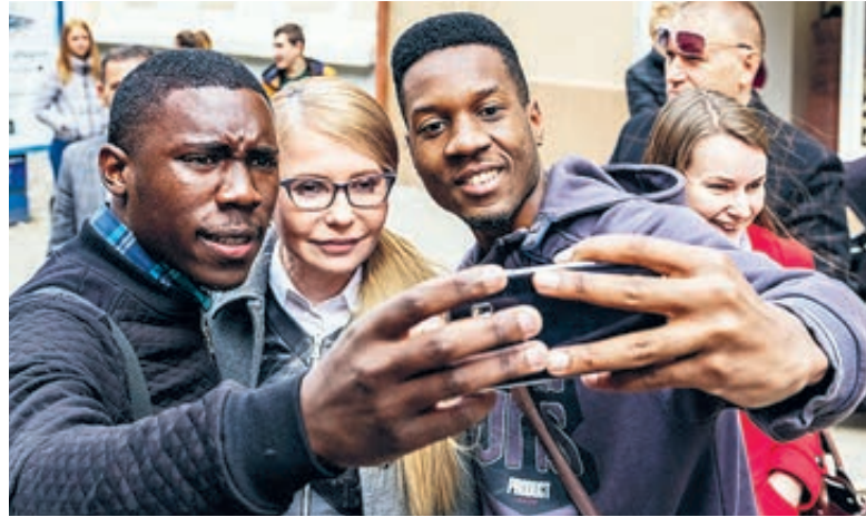
Юлия Тимошенко с избирателями.