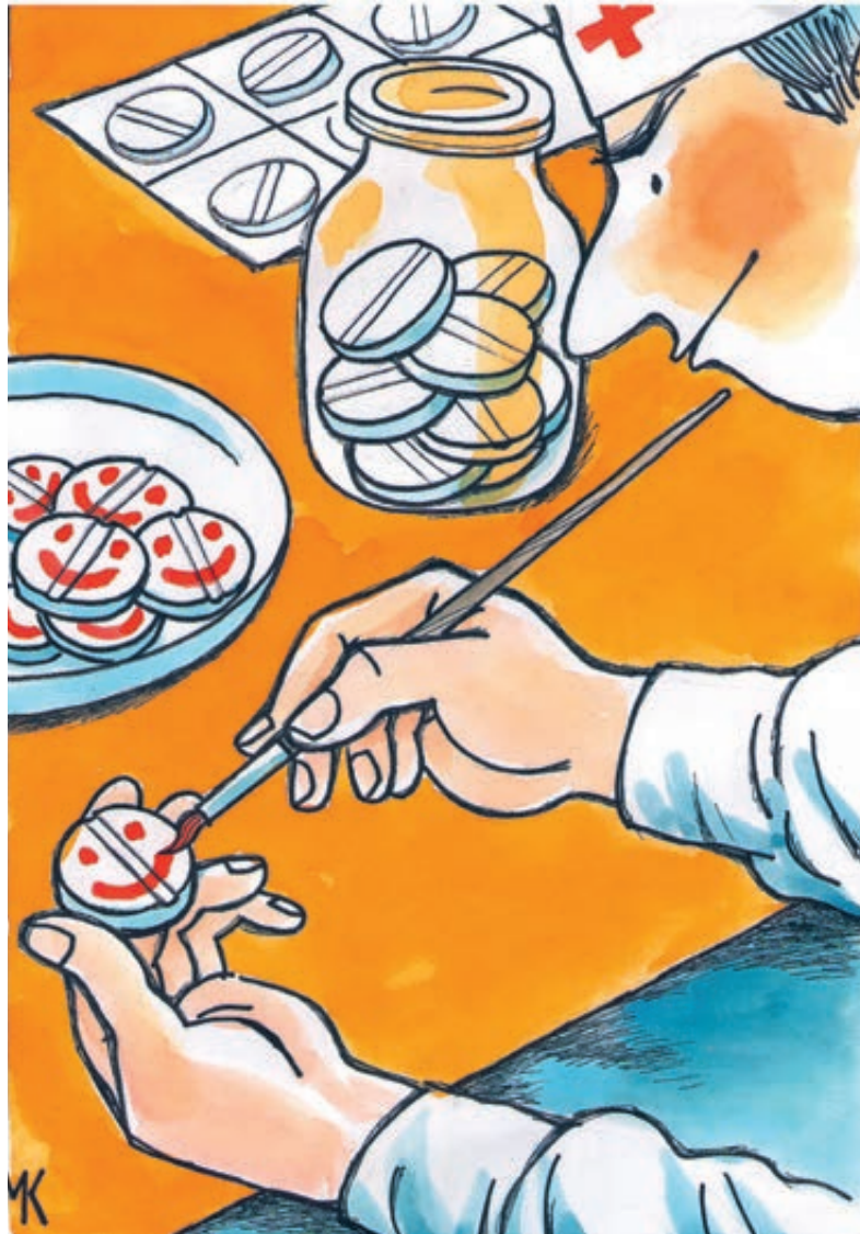
ИЛЛЮСТРАЦИЯ НИКОЛАЯ КАПУСТЫ/САРТООБАНК.RU

Как вам такое объяснение? Наверное, сотрудники Abbott считают россиян полными тупицами. Иначе зачем надо было экстренно прекращать продажи в Рос-