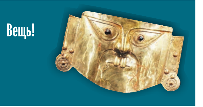
ЛЮДМИЛА БЕЗРУКОВА САНКТ-ПЕТЕРБУРГ

Ну так когда же мы наконец войдем в число стран с цивилизо- ванным концертным бизнесом? Также вопрос времени? Надеюсь, де- сятилетия для этого не требуются. ■