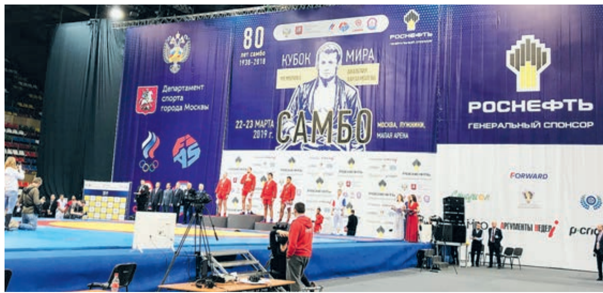
Российские спортсмены вышли победителями в борьбе, которая родилась в России.

Кубок мира «Мемориал Анатолия Харлампиева» стал первым крупным соревнованием по самбо в 2019 году и вызвал большой интерес московских любителей спорта, жителей и гостей столицы – Малая спортивная арена «Лужников», вмещающая более 8,5 тысячи человек, была практически вся заполнена. Значительную часть трибун занимали болельщики российских спорт-