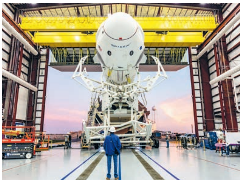
Первый частный орбитальный космический корабль Crew Dragon для пилотируемых полетов создан в компании Илона Маска SpaceX.

оявление нового пилотируемого корабля – всегда знаковое событие. Не так много было создано таких аппаратов за более чем полувековую историю мировой космонавтики. Если точно, всего девять кораблей: в нашей стране четыре – «Восток», «Восход», «Буран» и «Союз», в США столько же – «Меркурий», «Джемини», «Аполлон», «Спейс шаттл» и один в Китае – «Шэньчжоу». Сейчас многие из них – вчерашний день космонавтики, давно уже не эксплуатируются. Остались только «Союзы» и «Шэньчжоу», которые совершают рейсы на орбиту и обратно. Так что пополнение космического транспортного парка вызывает понятный повышенный интерес.