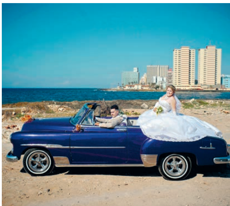
Сценка из гаванской жизни. Кстати, владение недвижимостью кубинцам было разрешено в 2011-м, а автомобилем – в 2014-м. Теперь можно владеть и бизнесом. Все как у взрослых.

Куба провозглашена «социалистическим, правовым и демократическим государством в форме унитарной республики». Вводятся пост президента и премьер-министра, которые наряду с секретарем Национального собрания возглавляют Госсовет. Он управляет страной в промежутках между сессиями парламента от его имени. А вот глава государства сможет занимать пост строго не более двух сроков по пять лет. После