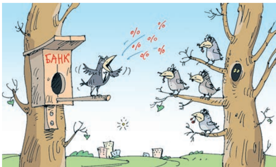
ИЛЛЮСТРАЦИЯ СЕРГЕЯ КОКАРЕВА/CARTOONBANK.RU

Свежий пример: 27 апреля с подачи конкурсной администрации сотрудники ФСБ задержали начальника операционного отдела банка «Северный кредит» (лицензия отозвана в конце 2017 года) Елену Липкину и двух ее подельников, которых подозревают в хищении средств на 3,1 млрд. Но чаще бывает