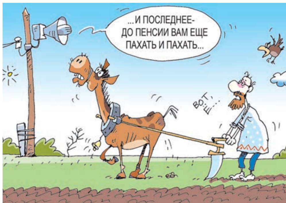
ИЛЛЮСТРАЦИЯ СЕРГЕЯ ЛЮКАЧЕВА/САРТОНБАНК.РУ