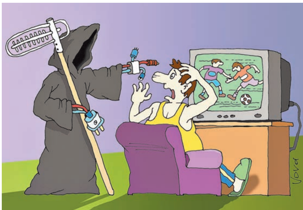
ИЛЛЮСТРАЦИЯ ВЛАДИМИРА ЛЬВАНОВА/САЙТООБРАЗОК.РУ

В Европе топовые футбольные лиги, получив средства от ТВ, делят их между клубами-участниками, обеспечивая им безбедную жизнь. И здесь суммы умножаются каждые несколько лет