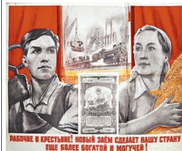
РАБОЧЕ И КРЕСТЬЯНЕ! НОВЫЙ ЗАЕМ СДЕЛАЕТ НАШУ СТРАНУ ЕЩЕ БОЛЕЕ БОГАТОЙ И МОГУЧЕЙ!

Если рассуждать здраво, вкладываться в ОФЗ действительно есть резон. Во-первых, гарантия сохранности вложений. Вы ведь кладете деньги не на счет в коммерческом банке, который в любой момент может обанкротиться или остаться без лицензии. Это бумаги пока еще платежеспособного государства, чей долг по займам составляет всего 15% ВВП. Во-вторых, Минфин обещает доходность по купону ОФЗ на 0,5–1% больше, чем по депозитам государственных банков. То есть риск минимальный, выгода очевидна. Но ажиотажа почему-то не наблюдается.