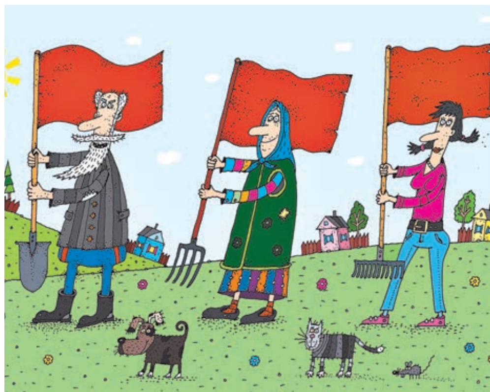
ИЛЛЮСТРАЦИЯ СЕРГЕЯ БЕЛОБЕЗОВА/CARTOONBANK.RU