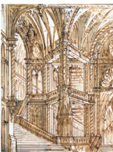
1 Василий Баженов в кругу семьи. Неизвестный художник, 1780 год. 2 Церковь в селе Быково. 3 Архитектурный эскиз. 1764 год.

трица сама была фигурой крайне неоднозначной. В залах фонда IN ARTIBUS мы видим и парадные портреты Екатерины II, и ее изображение в шугае и кокошнике, и государыню в образе античной богини Минервы.