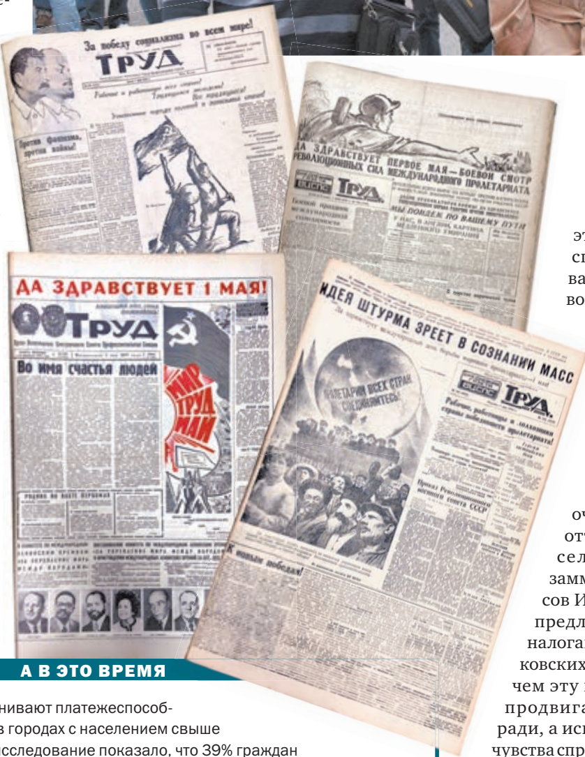
А В ЭТО ВРЕМЯ

К этому добавить нечего. Разве что вспомнить кое-что из старых первомайских призывов, вдруг зазвучавших свежо и актуально. Вот, например: «Долой угнетателей пролетариата!», «За равное правие и достойную жизнь!», «Все ради человека, все на благо человека», «Кто не работает – тот не ест»... ■