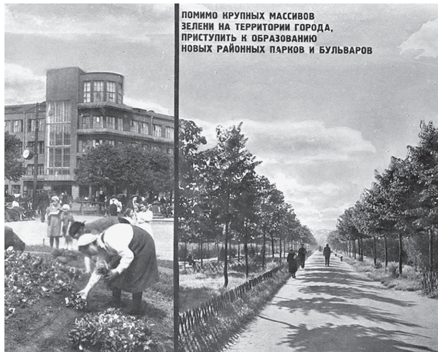
ПОСАДКА ЦВЕТОВ В СИВЕРЕ

Обо всем этом говорили участники выездного заседания президиума политсовета московского отделения ЕР, которое прошло в эколого-просветительском центре «Лосиная биостанция». Выступавшие напомнили, что за-