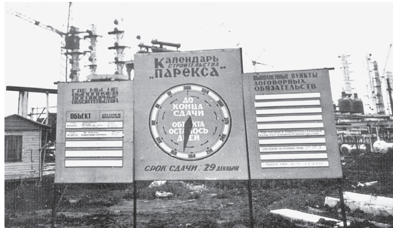
Пуск установки «Парекс» шел точно по графику.

специалистов. И действительно, к 1971 году на территории предприятия насчитывалось уже 120 технологических установок, а объемы переработки нефти были одними из самых высоких не только в СССР, но и в Европе.