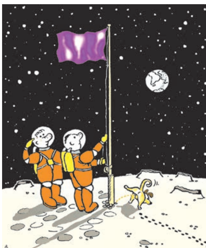
ИЛЛЮСТРАЦИЯ ВАСИЛИЯ АЛЕКСАНДРОВИЧА САРТОНОВИЧА