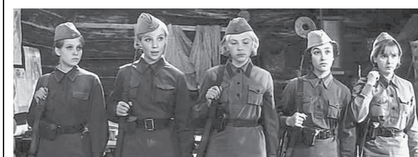
«А зори здесь тихие», 1972 год.