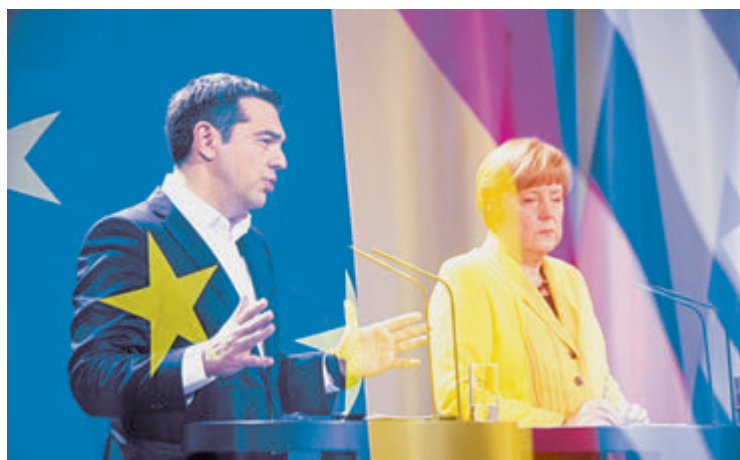
Визит премьер-министра Греции Алексиса Ципраса в Германию.

Все понимают, что деньги новому греческому правительству нужны как воздух. Казна пуста, нечем платить даже пенсии. Но ясно и то, что представить план реформ, основанный на рожденном в недрах ЕС «меморандуме о политике экономии», Афины не смогут — для нового правительства Ципраса это смерти подобно. Ведь именно обещания заморозить выплату астрономического долга, выйти из зоны евро и перейти к драхме, а также вернуть сотни тысяч рабочих мест вынесли на вершину власти мало кому известных политиков левого толка. Тем не менее брюссельские чиновники уперлись и с настойчивостью одного из героев Ильфа и Петрова упорно повто-