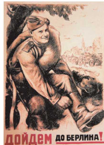
Плакат «Дойдем до Берлина!». 1944 год.

23 апреля от имени всех Объединенных наций главы трех правительств довели до сведения германского командования и распространили на всех фронтах Германии заявление: «Настоящим обращаются с торжественным предупреждением ко всем комендантам и охране, а также к служащим гестапо и ко всем другим лицам, в ведении которых находятся союзные военнопленные. Они заявляют, что всех этих лиц будут считать ответственными в индивидуальном порядке за разгромленные союзных военнопленных. Любое лицо, виновное в дурном обращении или допустившее дурное обращение с любым союзным военнопленным, будет подвергнуто беспощадному преследованию и наказано».