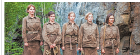
«А зори здесь тихие», 2015 год.