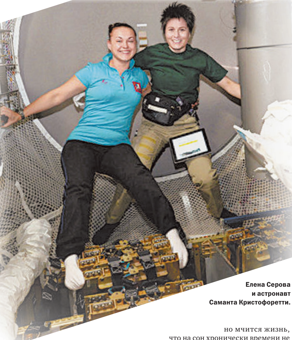
Елена Серова и астронавт Саманта Кристофоретти.

Это, скажу прямо, трудно поверить. Я знаю, как тщательно проводят медико-послеполетные исследования и измерения. Скорее загадка в другом. Елена чрезвычайно энергично, с полной самоотдачей (как и все, что делала на станции) занималась на МКС физическими упражнениями. В течение первых 4,5 месяца полета – по 2 часа в день, а за месяц до посадки – все 4. Представьте, какая воля нужна, чтобы 4 часа ежедневно отдавать тяжелейшим тренировкам, которые и не всякий крепкий мужик выдержит. Бывали случаи, когда космонавты по-тихому сокращали тренировочное расписание. А вот Елена делала все, что предписывалось. Она вообще не из тех, кто позволяет себе хотя