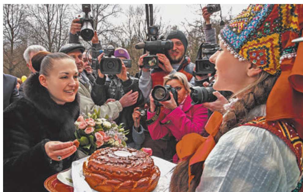
На торжественной церемонии в Звездном городке.