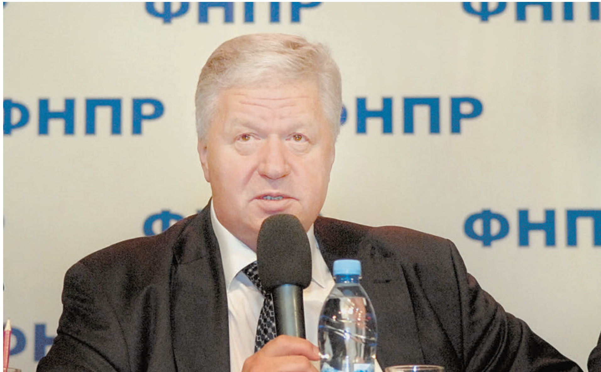
Председатель ФНПР Михаил Шмаков.

День 70-летия Победы, который мы будем скоро отмечать, – это символ победы нашего многонационального народа над немецко-фашистскими варварами, то, что стало забываться, а иногда и переписыв-