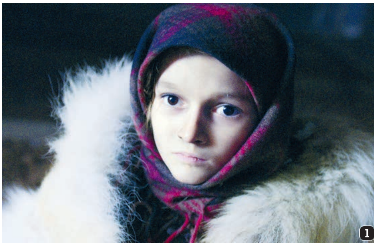
ФОТО ИЗ ОПЫТНЫХ ИСТОЧНИКОВ