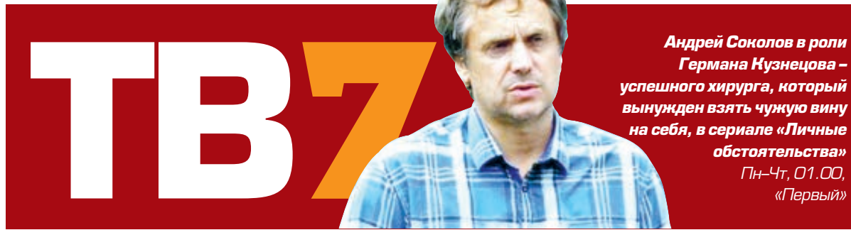
Андрей Соколов в роли Германа Кузнецова – успешного хирурга, который вынужден взять чужую вину на себя, в сериале «Личные обстоятельства» Пн-Чт, 01.00, «Первый»