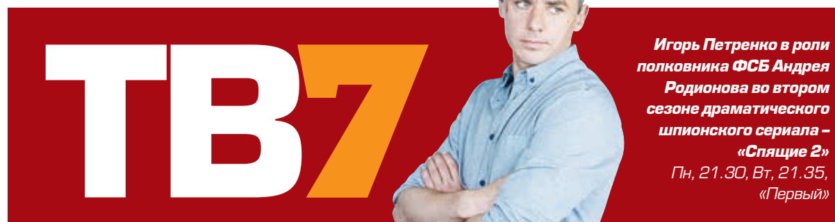
Игорь Петренко в роли полковника ФСО Андрея Родионова во втором сезоне драматического шпионского сериала – «Спящие 2» Пн, 21.30, Вт, 21.35, «Первый»