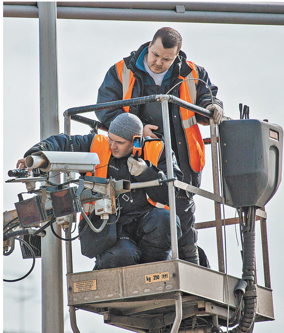
По мнению экспертов, перед тем, как снижать нештрафуемый порог, необходимо навести порядок со скоростными ограничениями. Иначе польза от этого будет только для владельцев камер фиксации нарушений.