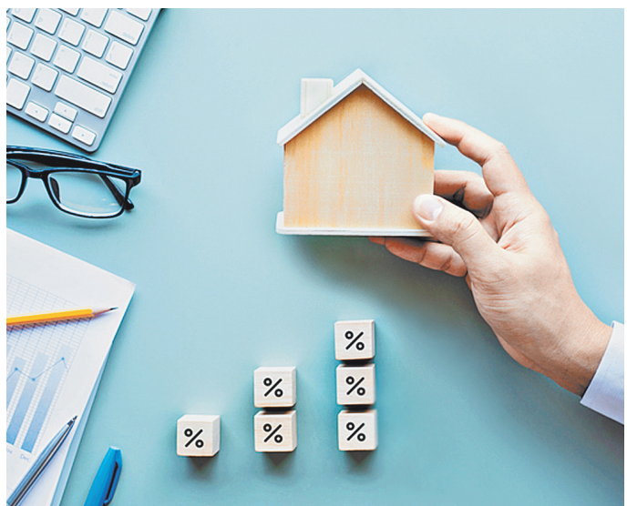
Остановка роста, а затем возможное снижение цен на жилье смягчат последствия от подорожания ипотеки.

Индия наряду с Китаем являются основными драйверами роста спроса на нефть в мире, и в случае введения жестких ограничений в стране можно ожидать соответствующей реакции со стороны нефтяных котировок, считает Амраган. ●