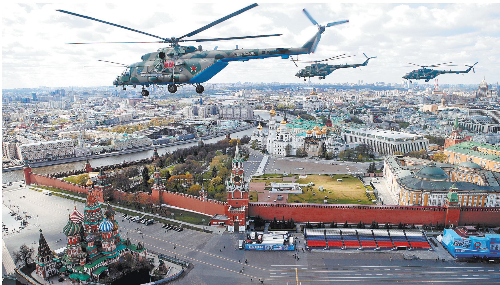
Воздушную часть Парада Победы впервые откроют три транспортных вертолета Ми-26. За ними над Красной площадью пролетят транспортно-боевые Ми-8, а также ударные Ми-35 и Ка-52.