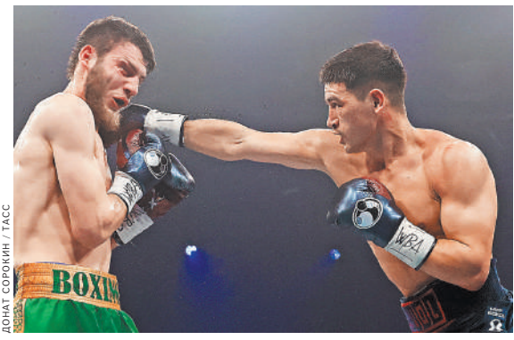
Дмитрий Бивол (справа) остается непобежденным боксером. На его счету 19 выигранных боев, из них 11 нокаутом.

Дмитрий Бивол отметил, что теперь его цель — стать абсолютным чемпионом мира. На данный момент поясами Всемирного боксерского совета (WBC) и Международной боксерской федерации (IBF) в весовой категории до 79,38 кг владеет другой россиянин Артур Бетербиев. ●