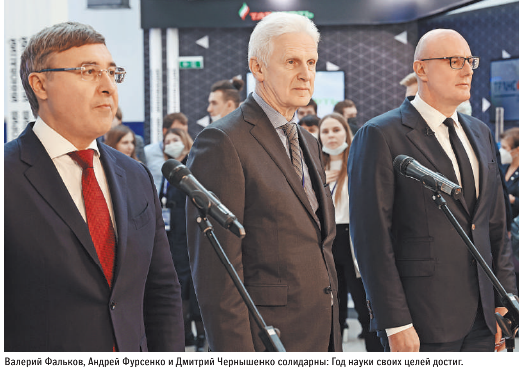
Валерий Фальков, Андрей Фурсенко и Дмитрий Чернышенко солидарны: Год науки своих целей достиг.

А президент РАН Александр Сергеев среди всего прочего выделил один качественный результат — это возрождение или, как он выразился, «реинкарнация» общества «Знание». По его словам, очень важно донести научную информацию до общества, в первую очередь, до молодежи, подростков. А чтобы она доходила, это надо делать интересно, захватывающе — современному. «И это», — заключил академик Сергеев, — получилось». ●