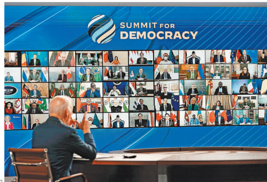
Вот так выглядит демократическая карта мира по-американски. Фото с «Саммита за демократию».

ЮРИЙ АВЕРЬЯНОВ: Конечно, так называемый «Саммит за демократию» несет в себе антироссийский и антикитайский заряд. Но главная цель, которую преследует Белый дом, другая. Американские элиты пытаются убедить себя в том, что их страна по-прежнему является единственной сверхдержавой, что ее глобальное доминирование неоспоримо и что весь мир равняется именно на Вашингтон.