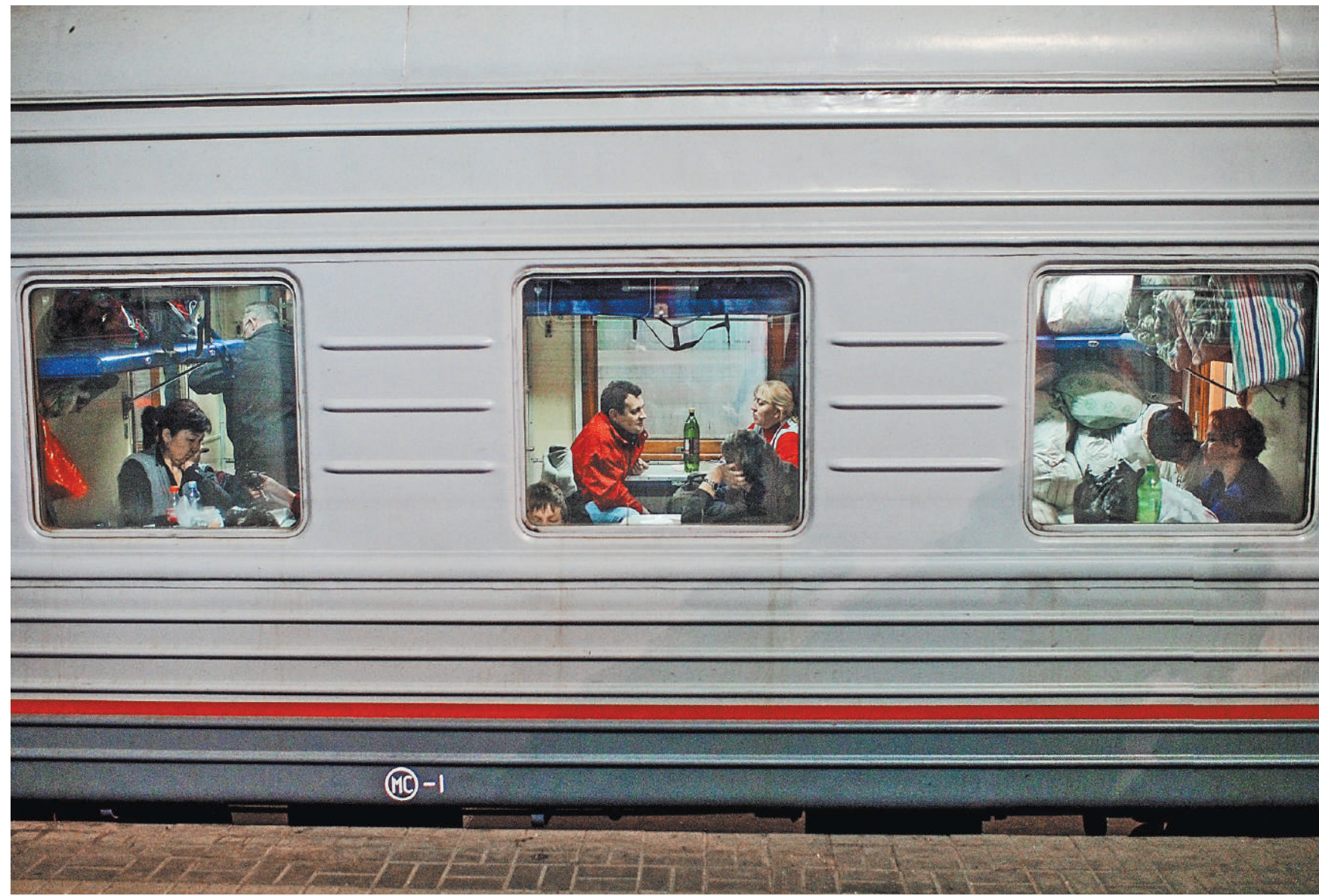
Сейчас стоимость билетов на места на верхних и нижних полках может отличаться в несколько раз.

1 ← Между тем в обновляемых правилах есть и другие изменения. Купить билет можно будет в «женское» или «мужское» купе, если такие есть в поезде. Детям до 10 лет места в эти купе оформляются независимо от пола ребенка. Также можно будет приобрести специализированные места для пассажиров с детьми.