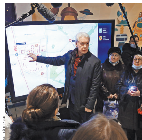
Сергей Собянин: Благодаря программе «Мой район» по всему городу появятся новые центры притяжения.

В следующем году завершится строительство Северо-Восточной хорды, а еще через год — реконструкция развязки на МКАД