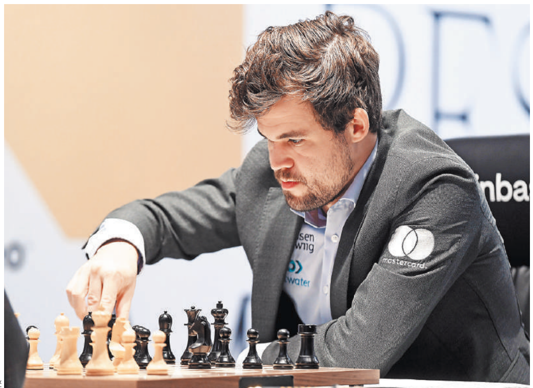
Магнус Карлсен в четвертый раз защитил титул чемпиона мира по шахматам.

Ян боролся, играл здорово, но не хватало чуть-чуть. Та партия отняла много нервов и ка-