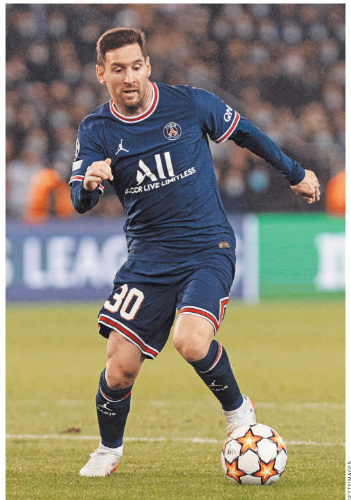
«ПСЖ», за который выступает Лионель Месси, намерен выиграть Лигу чемпионов.

Жеребьевка 1/8 финала Лиги Европы состоится 25 февраля. В ней примут участие 16 клубов — восемь команд, которые заняли первые места в группе ЛЕ и восемь клубов, выступавших в стыковых матчах Лиги Европы. ●