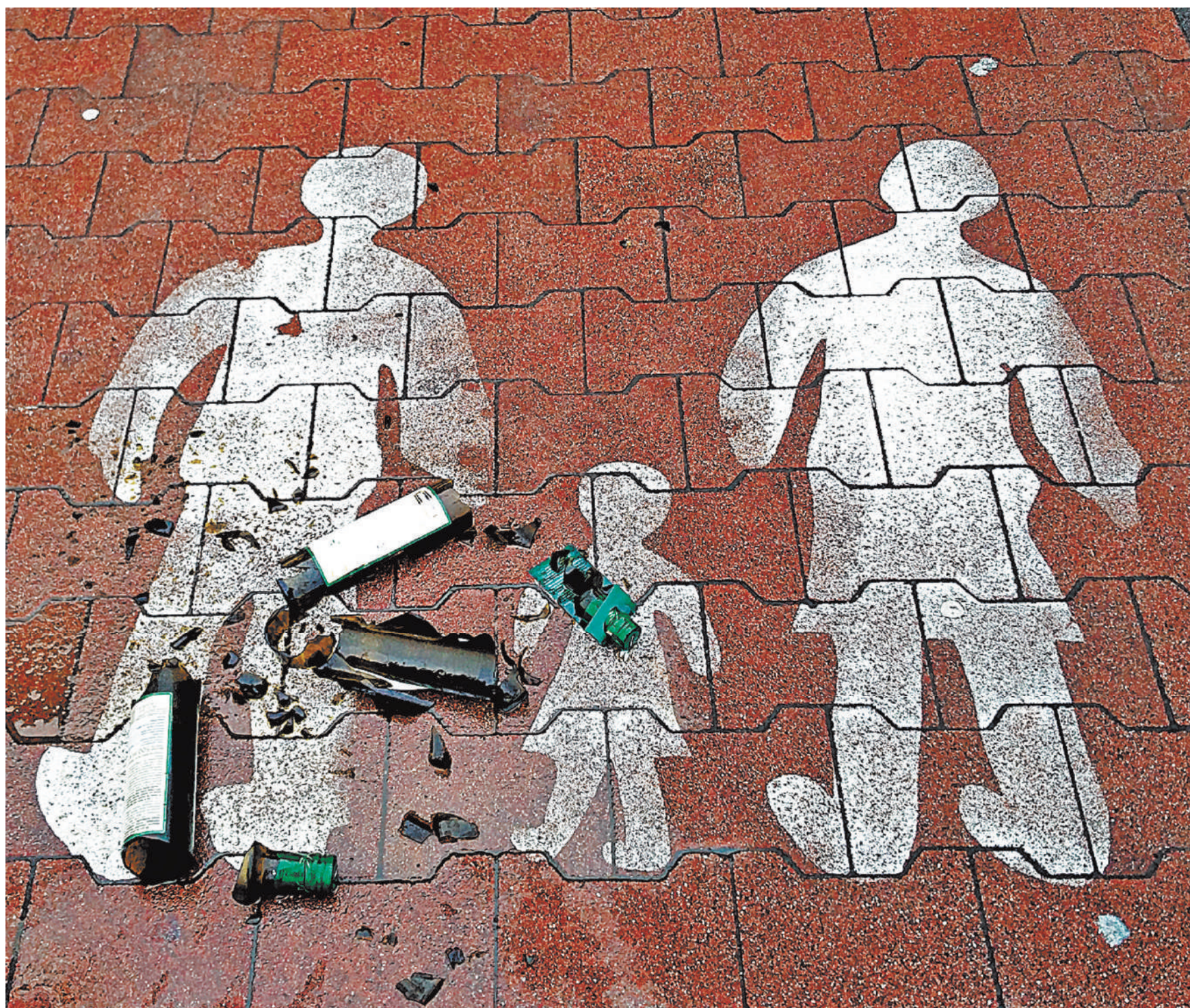
По мнению СК, нынешний год побил рекорд по уголовным делам о контрафактном алкоголе.