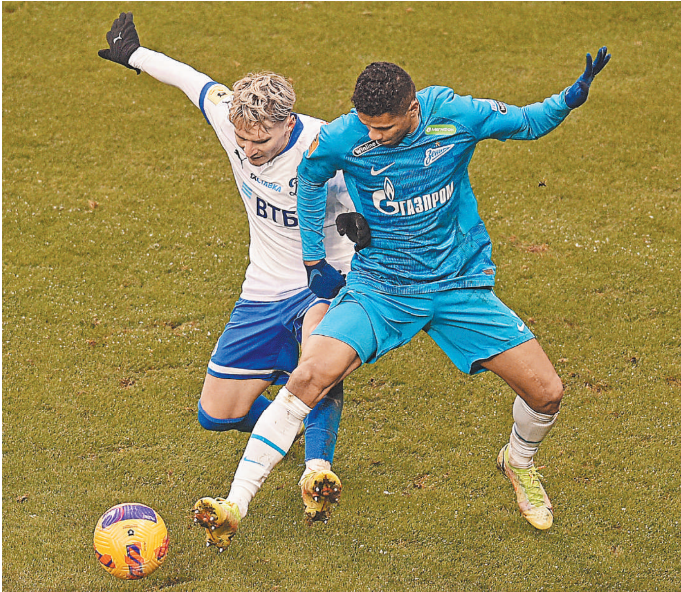
В матче двух лидеров чемпионата было не так много опасных моментов, зато хватало борьбы.

После перерыва ситуация изменилась. Москвичи вспом-