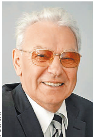
Ладыгин сберег российско-кубинское сотрудничество и ГРУ как важнейшую структуру Генштаба.

Ладыгин и Фидель Кастро более пяти часов проговорили с глазу на глаз. Федор Иванович нашел слова, убедившие лидера кубинской революции сохранить хорошие отношения с новой Россией. Да и Москва не пошла на полный разрыв. Объективно получилось, что именно Главное разведывательное управление в лице своего начальника сберегло российско-кубинские отношения, а по линии спецслужб они даже укрепились. ГРУ ГШ Ладыгин возглавлял с 1992 по 1997 год. Мало кому известно, что начальником одной из лучших в мире военных разведок он стал по результатам конкурса. То было время, когда стало модно отбирать на руководящие должности тех, кто представлял наиболее привлекательную программу развития той структуры, руководить которой собирался. Не обошло модное веяние и армию. Сегодня трудно сказать, что предлагал в 1992 году генерал Ладыгин и кто был его конкурентами. Но выбрали его. И он с честью справился со своими обязанностями. В памяти своих товарищей Федор Иванович останется примером честного служения Отечеству, а не политической конъюнктуре.